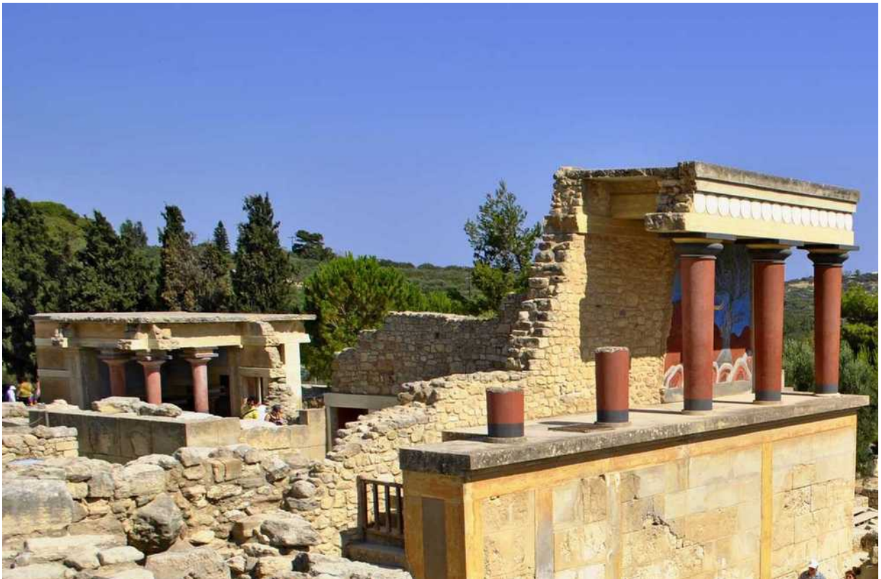
Εικόνα 10: Το παλάτι της Κνωσού