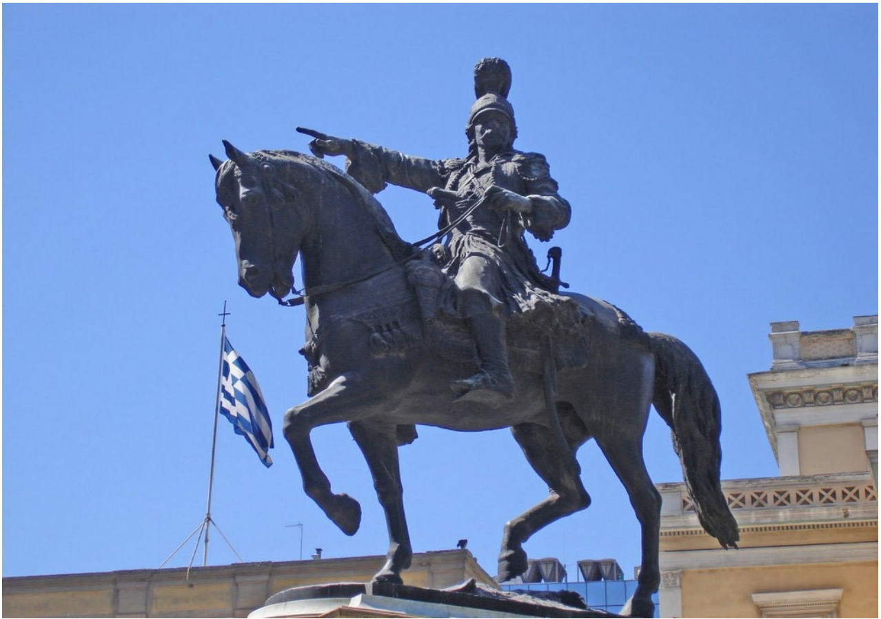
Εικόνα 8: Θεόδωρος Κολοκοτρώνης