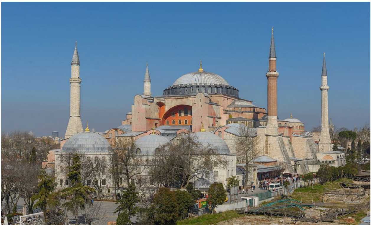
Εικόνα 11: Αγια Σοφιά, Κωνσταντινούπολη