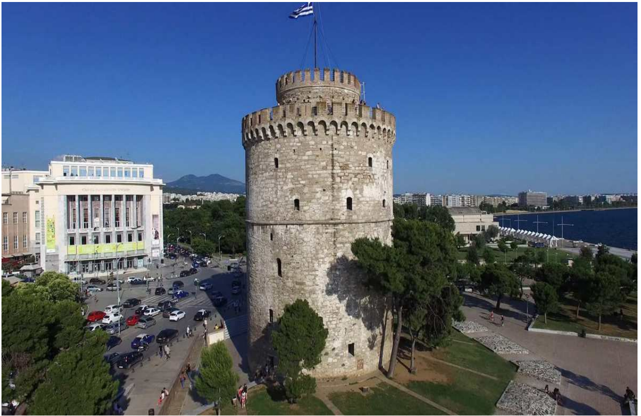
Εικόνα 12: Λευκός πύργος