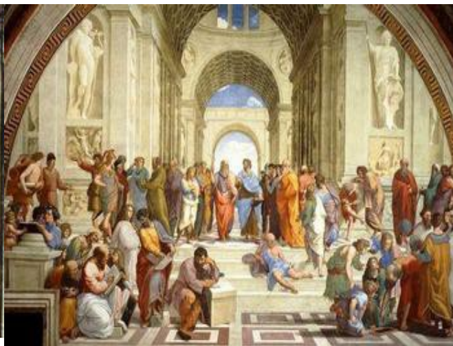
Εικόνα 2: Ο Αριστοτέλης σε αραβικό χειρόγραφο Εικόνα 3: «Η σχολή των Αθηνών» Ραφαήλ. 1510