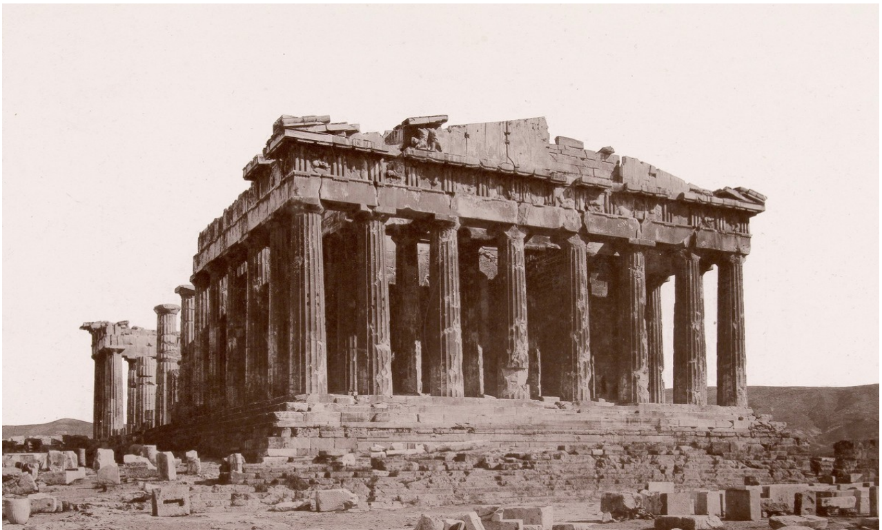
Εικόνα 9: Παρθενώνας