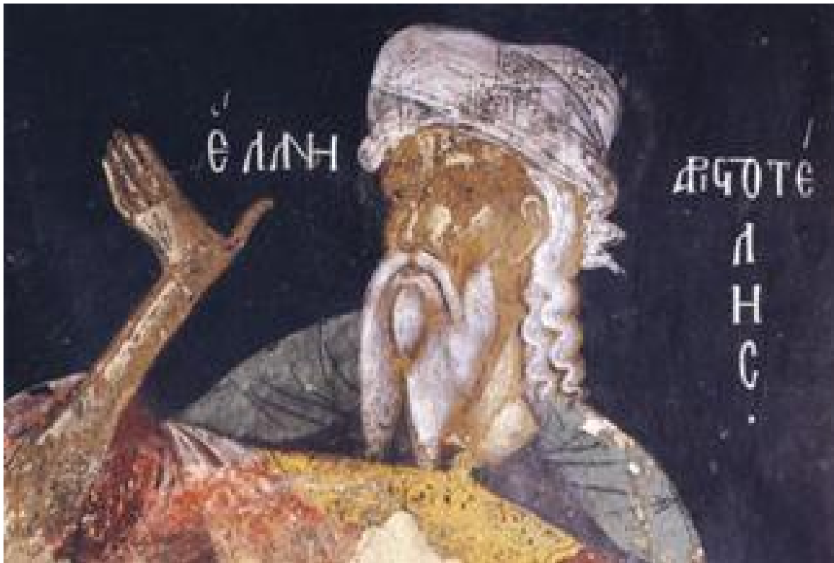
Εικόνα 6: Ο Αριστοτέλης σε τοιχογραφία από το καθολικό της Μονής Φιλανθρωπινών στο Νησί της λίμνης των Ιωαννίνων (1560)