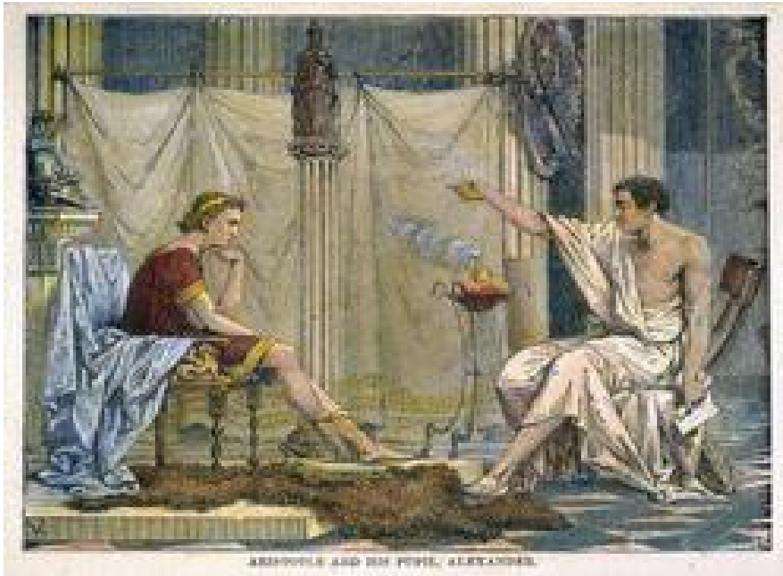
Εικόνα 1: Ο Αριστοτέλης και ο μαθητής του, Μέγας Αλέξανδρος

Mentor Deliberative speaking Rhetoric Education Educational process Educator – mentor