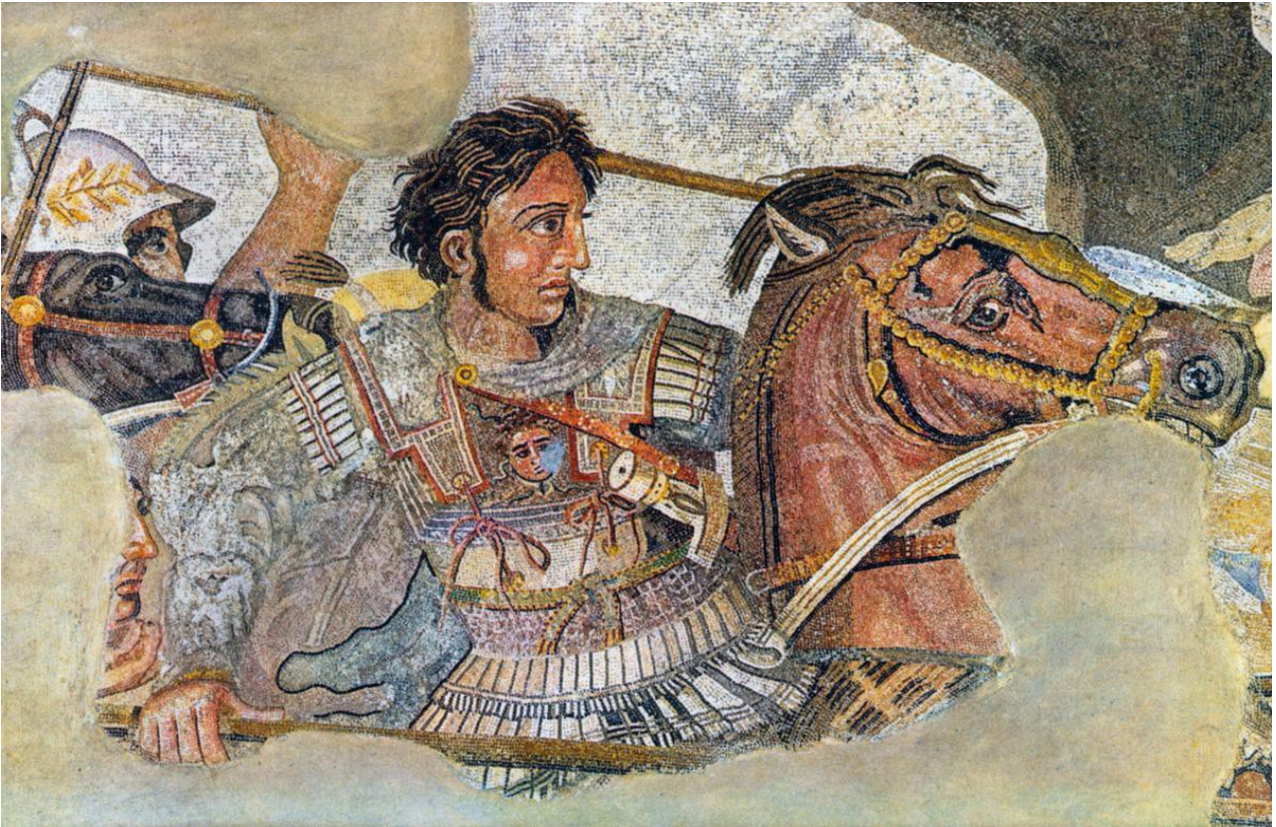
Εικόνα 7: Μέγας Αλέξανδρος