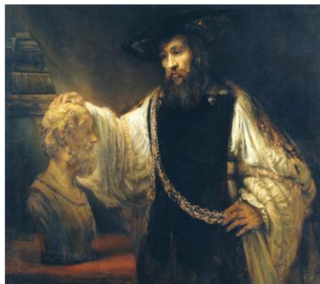
Εικόνα 5: Ο Αριστοτέλης μπροστά από την προτομή του Ομήρου, έργο του Ρέμπραντ (1653, Μητροπολιτικό Μουσείο Νέας Υόρκης)