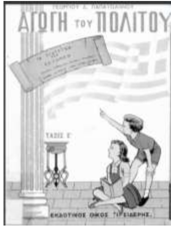
1' έκδοση (1962)