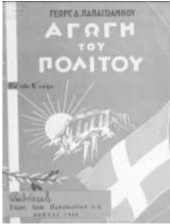
6' έκδοση (1966)