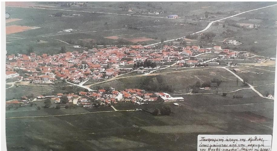
Πανοραμική άποψη της Κριθιάς, όπως φαίνεται από την κορυφή του Ντεβέ-καρανί. (Μάιος του 2006)