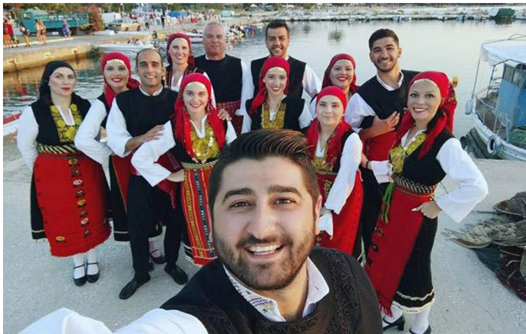
Χορευτική παράσταση στη Θάσο, 2018