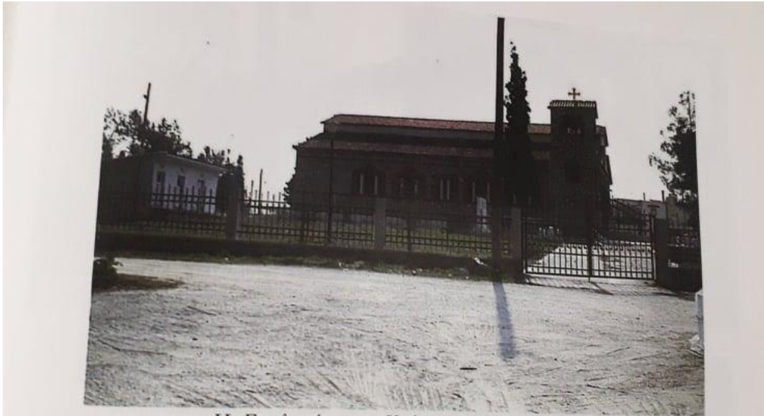
Η Εκκλησία της Κοίμησης της Θεοτόκου. Η νέα (σημερινή) Εκκλησία της Κριθιάς (κτίστηκε τη δεκαετία του 1970)