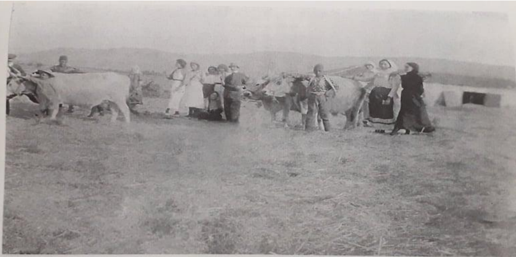
Αλώνια το 1912 στο τσιφλίκι της οικογένειας Ι. Παρασκευαΐδη που βρισκόταν μεταξύ Κριθιάς και Σεντίλ. Μπαχρ.