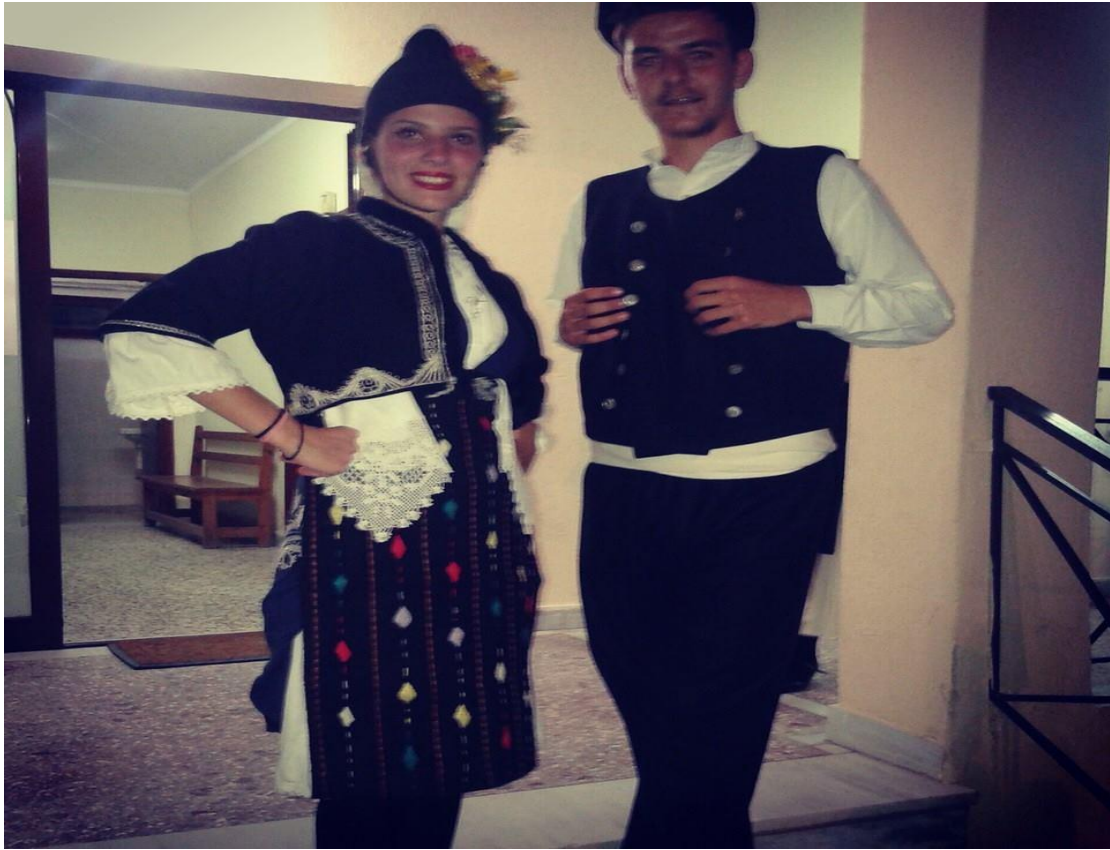
Χορευτική παράσταση στο Εξαμίλι. 2015, φορεσιά Μακεδονίας