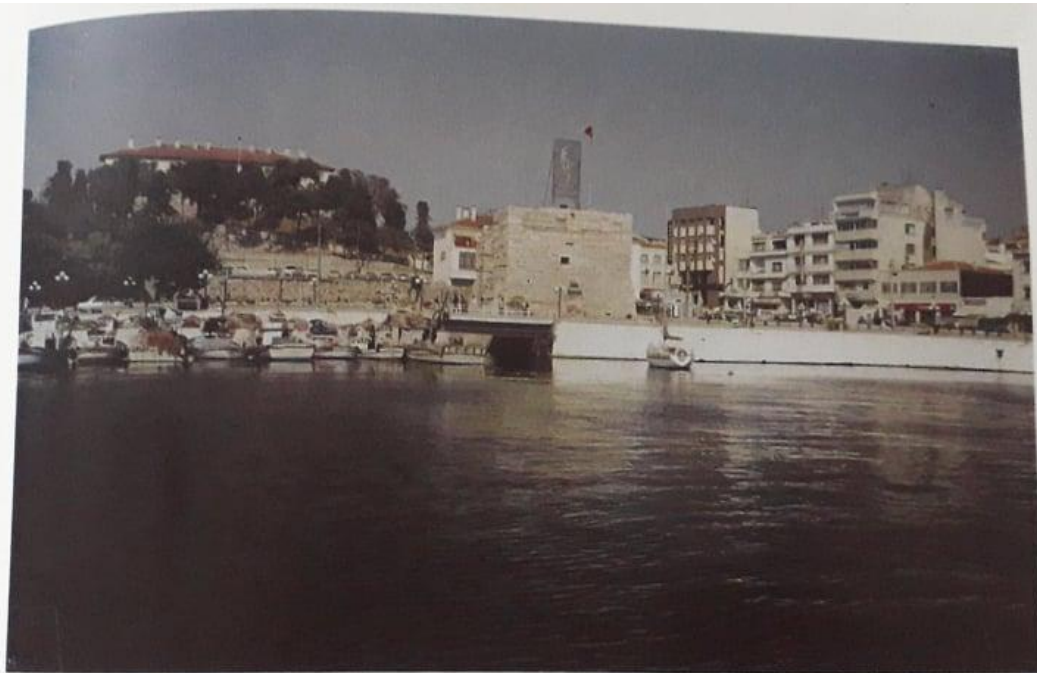
Μερική άποψη της Καλλίπολης με το γραφικό λιμανάκι της.