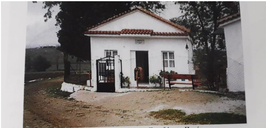
Το παρεκκλήσι της Ζωοδόχου Πηγής. Η " Παναγδέλα " (σε μεταγενέστερη μορφή)