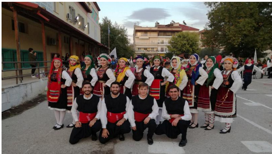
Χορευτική παράσταση στην Σκύδρα, 2017 (φορεσιά Μεταξάδων)

Ο Μορφωτικός Πολιτιστικός Σύλλογος Κριθιάς ιδρύθηκε το 1983 με σκοπό την διατήρηση των ηθών και εθίμων του τόπου μας. Ο σύλλογος μας αποτελείται από 7 χορευτικά τμήματα με 150 ενεργά μέλη. Επιπλέον διαθέτουμε πλούσια ιματιοθήκη. Έχει λάβει μέρος ο σύλλογος με μεγάλη επιτυχία σε αρκετά παιδικά φεστιβάλ καθώς και σε παραστάσεις εντός και εκτός Ελλάδας.