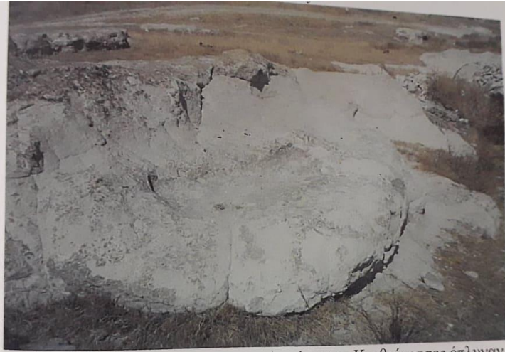
Φυσική πέτρινη γούρνα σε ποταμάκι όπου οι Κριθιώτισσες έπλυναν.