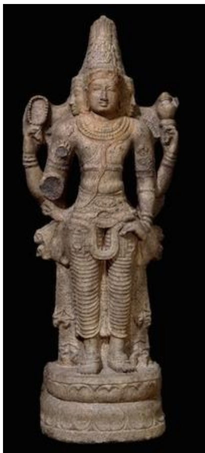
Εικόνα 4: Πέτρινη φιγούρα του Brahma, δυναστεία Chola, γ. 1110-1150, από το Ταμίλ Ναντού, νότια Ινδία, 131 εκατοστά ύψος, Βρετανικό Μουσείο

Συχνά λέγεται ότι υπάρχει μια τριάδα ινδουιστών θεών: ο Μπράχμα ο δημιουργός, ο Βισνού ο προστάτης και ο Σίβα ο καταστροφέας. Αλλά ενώ ο Βισνού και ο Σίβα έχουν οπαδούς και ναούς σε όλη την Ινδία, ο Μπράχμα δεν λατρεύεται ως μεγάλη θεότητα. Ο Μπράχμα είναι η προσωποποιημένη μορφή μιας απροσδιόριστης και άγνωστης θείας αρχής που ονομάζεται ο Ινδουιστής Brahman. Στον μύθο του Shiva ως Lingodbhava, όταν ο Brahma ψάχνει για την κορυφή του linga της φωτιάς, ο Brahma ισχυριζόταν λανθασμένα ότι είχε βρει λουλούδια στην κορυφή του, όταν στην πραγματικότητα το Shiva linga ήταν χωρίς τέλος. Για αυτό το ψέμα τιμωρήθηκε