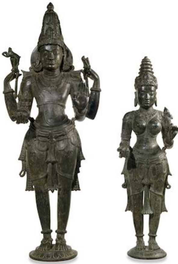
Εικόνα 3: Χάλκινες φιγούρες του θείου ζευγαριού Shiva και Parvati, αρχές 11 ου αιώνα, 67 cm ύψος, Δυτική Ινδία, Βρετανικό μουσείο.

Ο Σίβα είναι μια ισχυρή ινδουιστική θεότητα. Έχει μια γυναίκα σύζυγο, όπως και οι περισσότεροι θεοί, ένα από τα ονόματα των οποίων είναι η Parvati, "η κόρη του βουνού". Ο Shiva και η Parvati μπορεί να εμφανιστούν ως ένα αγαπημένο ζευγάρι που κάθεται μαζί σε μια μορφή που ονομάζεται «Umamaheshvara». Σε αυτό το παράδειγμα έχουν σχεδιαστεί δύο ξεχωριστές χάλκινες εικόνες ως ομάδα. Τόσο ο Shiva όσο και η Parvati φορούν περίτεχνα κοσμήματα. Ο Σίβα είναι η ισχυρότερη θεότητα και έτσι απεικονίζεται με τέσσερα χέρια και είναι η ψηλότερη μορφή. Στα χέρια του κρατάει το όπλο του, την τρίαινα, ένα μικρό ελάφι και ένα φρούτο. Το τέταρτο χέρι του ανυψώνεται σε αβεβαιότητα (abhayamudra). Όπως και άλλες εικόνες του Shiva φοράει δύο διαφορετικά σκουλαρίκια. Η Παρβάτι κατέχει ένα lotus στο ένα χέρι και ένα στρογγυλό φρούτο στο άλλο. Το χάλκινο χύτευμα στον 11ο αιώνα αναπτύχθηκε ιδιαίτερα στο Ταμίλ Ναντού στο