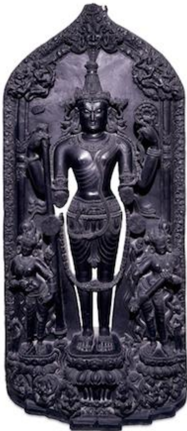
Εικόνα 2 : Στήλη με μία φιγούρα του Θεού Βισνού, 12 ος αιώνας, Δυναστεία Pala 162.56 cm Βεγγάλη, Ανατολική Ινδία, Βρετανικό μουσείο.