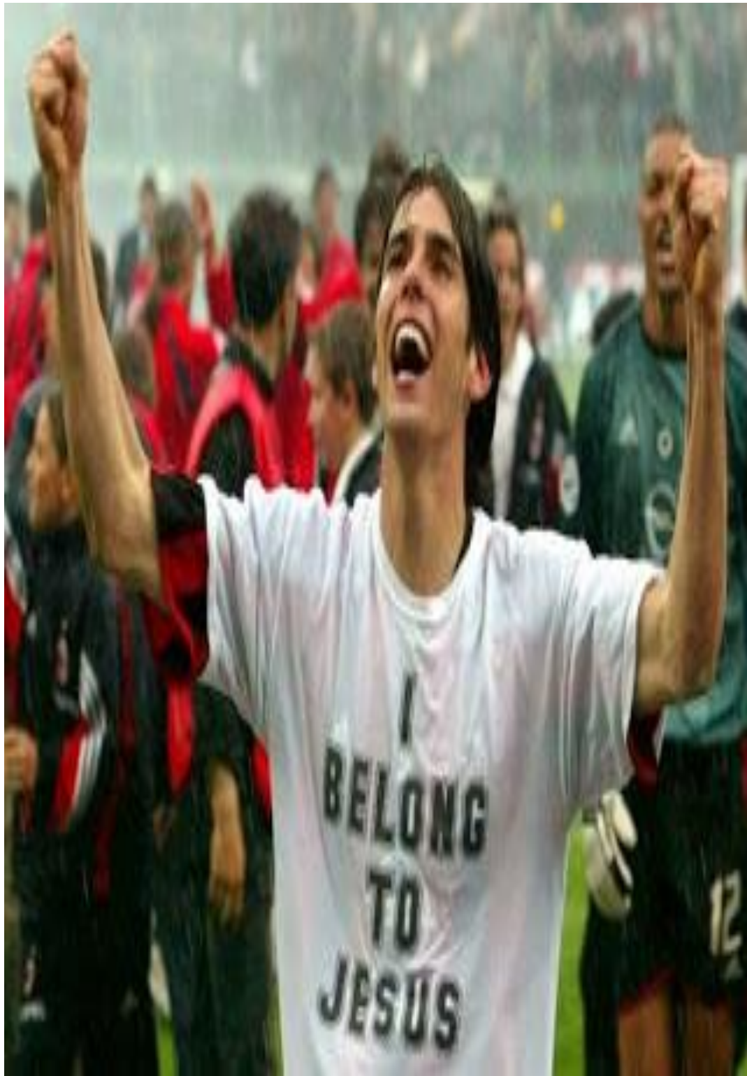
Ο Βραζιλιάνος ποδοσφαιριστής της Μίλαν Κακά πανηγυρίζει και δείχνει την μπλούζα κάτω από την φανέλα του που γράφει: Ανήκω στον Ιησού.