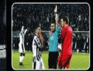
Πήρε την απόφαση να δείξει σφ σάιντ