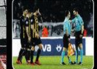
Πήγε στα αποδυτήρια, δεν επέστρεψε ποτέ