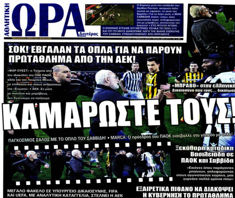
Ωρα των Σπορ

Η Ώρα των Σπορ παρουσιάζει όχι μια, αλλά έξι εικόνες από την στιγμή της εισβολής. Στις πέντε απεικονίζεται ο μεγαλομέτοχος του Π.Α.Ο.Κ., πάλι σε πλάγια γωνία και με το βλέμμα στραμμένο αλλού. Φαίνεται και το όπλο στη ζώνη του, χωρίς, όμως, να έχει επεξεργαστεί για να είναι πιο εμφανές. Τρεις εικόνες ενώνονται με μια λωρίδα από φιλμ, σαν να είναι χωρισμένες σε καρέ, για να μεταδώσουν στον θεατή ένα έντονο στοιχείο δράσης.