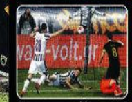
Έγραψε στο φύλλο αγώνα ότι νίκησε ο ΠΑΟΚ

ΑΠΟΧΩΡΗΣΕ Η ΑΕΚ! ΔΕΝ ΚΑΤΕΒΗΚΕ ΝΑ ΠΑΙΞΕΙ ΤΑ 6 ΛΕΠΤΑ!