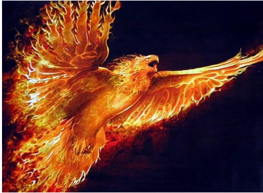
Εικόνα 7: Φοίνικας

Στη φιλοσοφική λίθο συναντάμε ένα ακόμη μυθικό πλάσμα, τον Βασιλίσκο (Ρουλιγκ, 1998:306). Είναι ένα μεγαλόσωμο φίδι με πράσινο δέρμα και κίτρινα μάτια που πετρώνουν όποιον τα βλέπει (π.χ. την Ερμιόνη Γκρέιντζερ, τον Τζάστιν Φιντς-Φλέτσο, τον Κόλιν Κρίβι την γάτα του Φιλτς και το φάντασμα του Σχεδόν Ακέφαλου Νικ). Η Μυρτιά που Κλαίει πέθαινε όταν συνάντησε τον Βασιλίσκο, καθώς κοίταξε αμέσως το βλέμμα του. Στην ελληνική και ρωμαϊκή μυθολογία γίνονται αναφορές στον Βασιλίσκο. Ο Βασιλίσκος δημιουργήθηκε στην Αρχαία Ελλάδα από τον μάγο Έρπος τον αφελή. Στην ελληνική φαντασία θεωρείται «βασιλιάς των φιδιών» (Μπούρα, 2019).