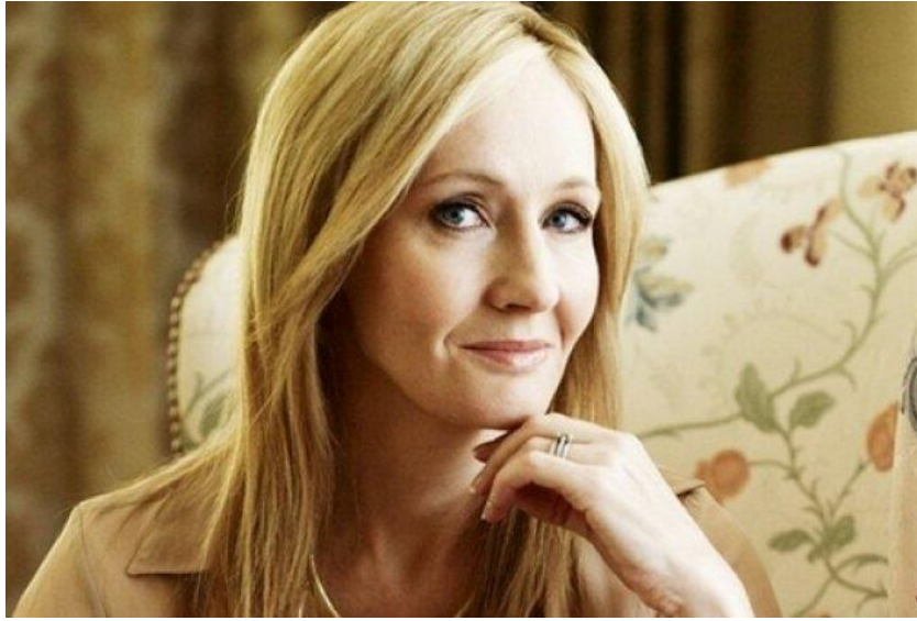
Εικόνα 1: Τζόαν Ρουλινγκ, η δημιουργός του φανταστικού κόσμου του Χάρι Πότερ

Ο Χάρι Ποτέρ είναι μάγος όπως ήταν και οι γονείς του. Για τη συγγραφέα οι μάγοι είναι σαν τους απλούς ανθρώπους, μπορεί να πραγματοποιούνε μαγικά ξόρκια αλλά όπως και εμείς συμβιώνουν με τους άλλους και έχουνε καθημερινές ασχολίες. Ακόμη οι άνθρωποι χωρίς μαγικές ικανότητες ή αλλιώς Μαγκλς, όπως τους χαρακτηρίζει στα βιβλία της, έχουν δικά τους μαγαζιά, πανεπιστήμια αλλά και υπουργεία. Οι μάγοι στο φανταστικό κόσμο της Τζόαν Ρόουλινγκ αγαπάνε, κάνουν όνειρα, που επιθυμούνε να γίνουνε πραγματικότητα, ζηλεύουν, ειρωνεύονται, μάχονται, υποστηρίζουν ο ένας τον άλλον, συμφιλιώνονται και τσακώνονται. Στους δύο προαναφερθέντες κόσμους κυριαρχεί το αίσθημα της αδικίας και του δικαίου, του καλού και του κακού του έρωτα και της φιλίας, της η ζωής και του θανάτου (Κοντολέων,1998 ό.α. στο Ρόουλινγκ, 1999). Ο κεντρικός χαρακτήρας είναι ο Χάρι Πότερ, ο οποίος θυμίζει ένα φυσιολογικό αγόρι που είναι έξυπνος, δείχνει κουράγιο, έχει ανασφάλειες και διαθέτει μαγικές δυνάμεις. Είναι μυθιστορηματικός ήρωας σκοπός είναι οι αναγνώστες των βιβλίων να τον αγαπήσουν. Ο Χάρι μεγάλωσε σε ένα κοινωνικά και συναισθηματικά στερητικό περιβάλλον οι φροντιστές του οποίου ήταν οι συγγενείς του, οι οποίοι είναι Μαγκλς. Οι συγγενείς-φροντιστές οι οποίοι μεγάλωσαν τον Χάρι, μετά τον θάνατο των γονιών του, προσέδιδαν τους μάγους κατά επέκταση και στους γονείς του Χάρι τον χαρακτηρισμό των «ανώμαλων» (Κοντολέων,1998 ό.α. στο Ρουλινγκ, 1999).