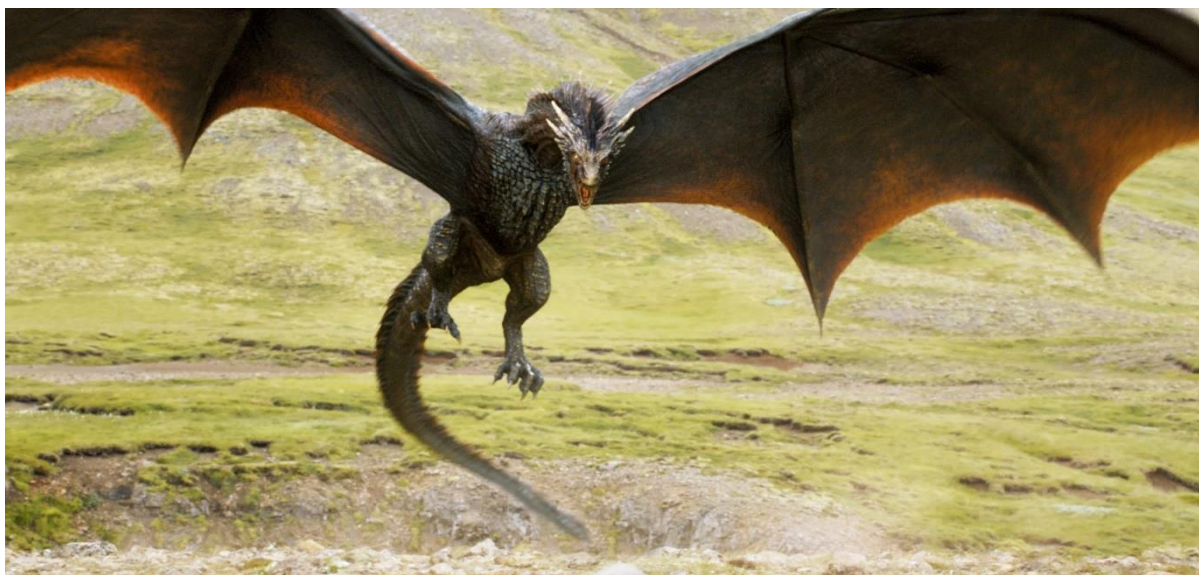
Εικόνα 6: Ο Δράκος στη ταινία του Χάρι Πότερ, το κύπελλο της φωτιάς

προστάτες των θησαυρών τους. Έχουν μεγάλα φτερά που έμοιαζαν σαν αυτά που έχουν οι νυχτερίδες και βγάζουν φωτιές από το στόμα τους (Jones, 2018).