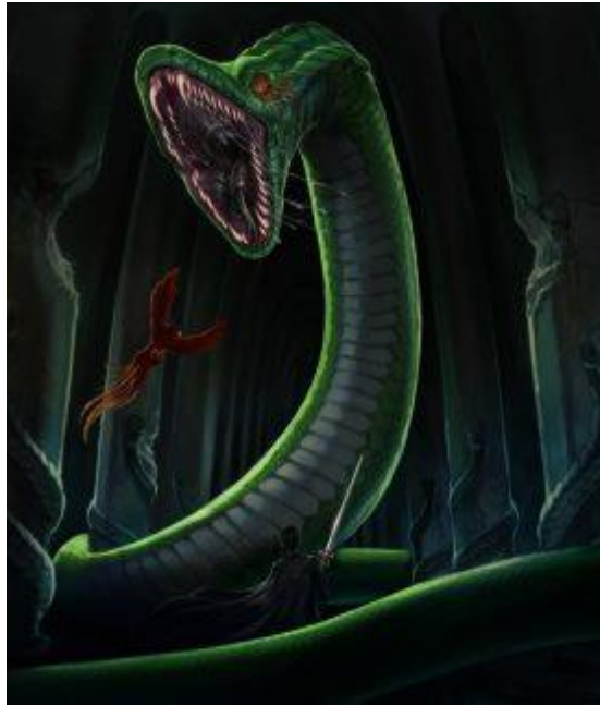
Εικόνα 8: Ο Βασιλίσκος στο κόσμο του Χάρι Πότερ

Στον αιχμάλωτο του Αζκαμπαν, συναντάμε τον Ωραιόμορφο ο οποίος είναι υπόγρυπας (Ρουλιγκ, 1999:126). Τα μυθικά αυτά πλάσματα αναφέρονται σε ένα δράμα με τίτλο « Γρύπες», το οποίο έχει γράψει ο Πλάτωνας. Οι γρύπες βλέποντας την όψη τους έχουν στοιχεία από το λιοντάρι και τον αετό. Μπορεί κάποιος να πιστεύουν ότι έχουν Ανατολίτικη προέλευση, αλλά στην μυθολογία μας διαβάζουμε συχνά για τα πλάσματα αυτά (Pirrotta, 2009). Επίσης, η εμφάνιση τους στη μινωική λάρνακα, ήταν η απεικόνιση των θεϊκών οντοτήτων, όπως ήταν οι θεότητες Horus ή Hathor-Isis φύλακες των ανθρώπων που πηγαίνανε στο κάτω κόσμο ή φυλάγανε τον κάθε ένοικο της λάρνακας (Porter, 2011).