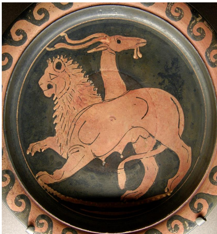
Εικόνα 13: Η Χίμαιρα