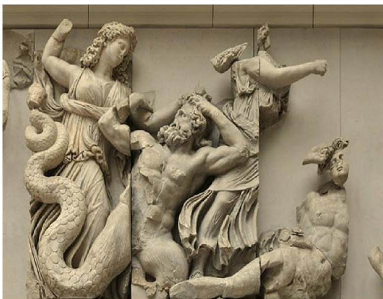
Εικόνα 5: Γιγαντομαχία

Οι γίγαντες αν και ήταν θεϊκά πλάσματα μοιάζανε με τους ανθρώπους στην όψη τους. Οι γίγαντες ήταν μεγάλοι σε μέγεθος και ανίκητοι. Οι γίγαντες μπορούσαν να ηττηθούν μόνο εάν έφευγαν από τον τόπο τους ή αν βοηθούσε τους Θεούς ο Ηρακλής. Βέβαια μπορούσαν να προστατευτούν από ένα βότανο της μητέρας τους της Γη. Οι τόποι καταγωγής τους είναι οι Φλέγρες και η Παλλήνη (Μήττα, χ.η).