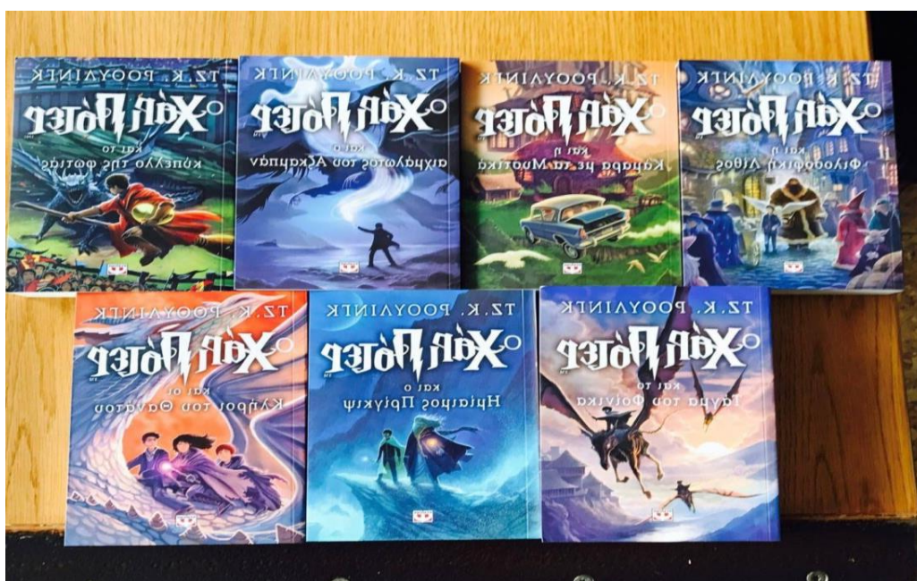
Εικόνα 2: Η Βασική σειρά βιβλίων του Χάρι Πότερ

Στα βιβλία του Χάρι Πότερ εντοπίζονται στοιχεία ελληνικής και ρωμαϊκής μυθολογίας, καθώς πολλοί από τους ήρωες των βιβλίων παρουσιάζουν εμφανής ομοιότητες στα ονόματα και σε κάποια άλλα στοιχεία που αφορούν τόσο στον χαρακτήρα με μυθολογικά πρόσωπα (Κοντολέων, 1998 ό.α στο Ρουλινγκ,1999). Η παρουσίαση των στοιχείων της ελληνικής και ρωμαϊκής μυθολογίας πραγματοποιείται εκτενέστερα σε επόμενα κεφάλαια.