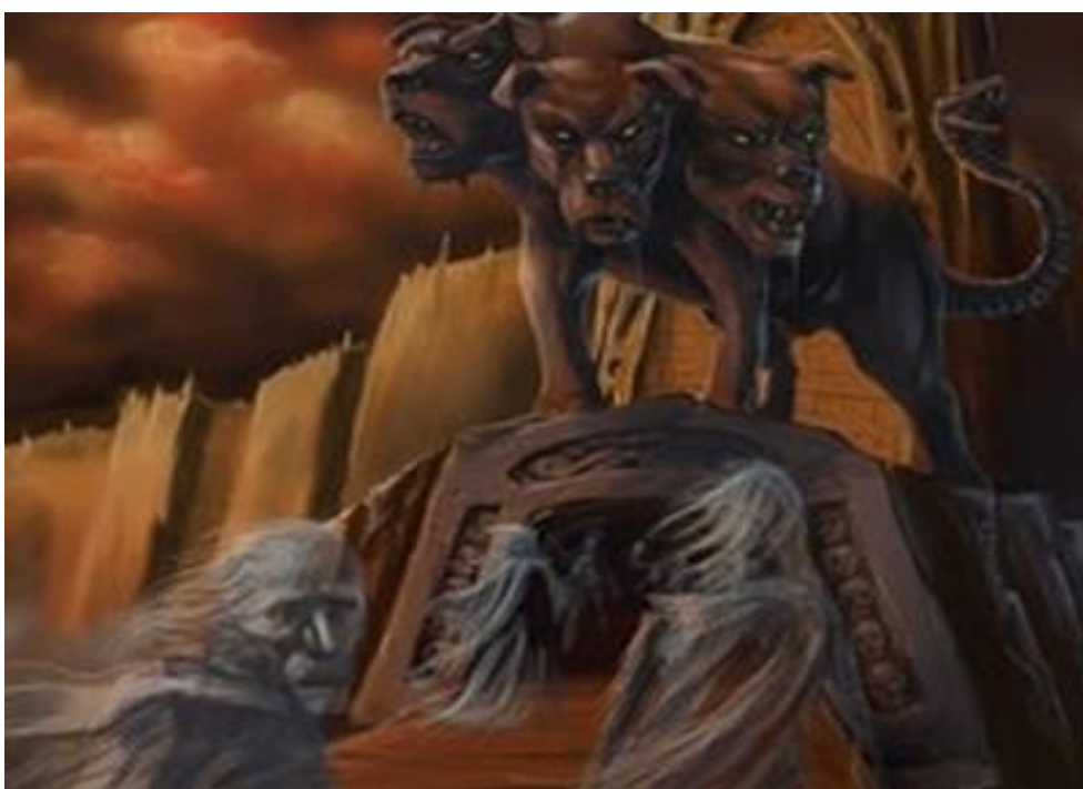
Εικόνα 3: Κέρβερος, ο φύλακας του Κάτω Κόσμου

από τον Ηρακλή στον ποταμό Αχέροντα. Ο Ηρακλής ταξίδευε για να πάει στον Κάτω Κόσμο με την βοήθεια των δύο θεών, της Αθηνάς και του Ερμή. Εκεί ο Χάρωντας και ο Άδης ηττήθηκαν. Ο Ηρακλής έκανε μια συμφωνία με την Περσεφόνη να πάρει τον τρικέφαλο σκύλο, αλλά δεν θα χρησιμοποιούσε κανένα όπλο, για να τον πιάσει και δεν θα τον γυρνούσε πίσω σε άσχημη κατάσταση. Έτσι πήρε τον κέρβερο, κουβαλώντας τον σε έναν από τους ώμους του και όταν ολοκλήρωσε τον άθλο του, ο Κέρβερος γύρισε στον Κάτω Κόσμο και φύλαγε την είσοδο. Βέβαια όταν έπρεπε να φτάσουν στον Ευρυσθέα, στον δρόμο πέθαναν πολλά άτομα, λόγω του Κέρβερου και όταν έπεφταν τα σάλια του στη γη δημιουργούνταν το ακόνιτο (MATYSZAK, 2013).