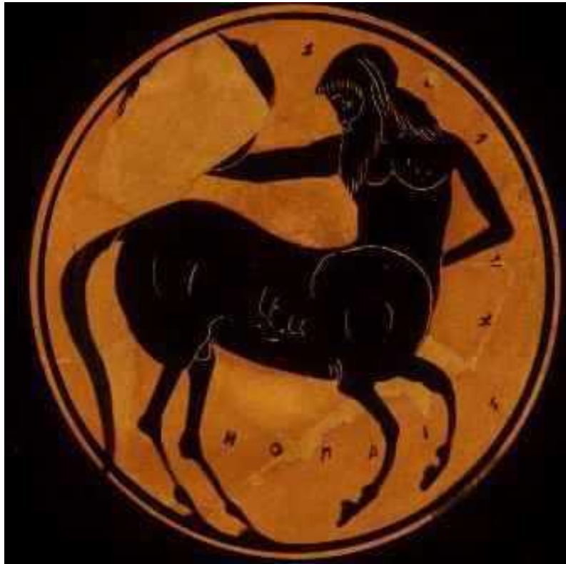
Εικόνα 4: Κένταυρος

Ο Χάγκριντ είναι μισός γίγαντας, άλλοι γίγαντες που αναφέρονται είναι η μαντάμ Μαξιμ στο κύπελο της φωτιάς (Ρουλιγκ, 2000) & στο τάγμα του φοίνικα ο Κάρκος (Ρουλιγκ, 2003). Οι γίγαντες είναι λαός της Θράκης και είναι βάρβαροι. Ο Στέφανος Βυζάντιος ερμηνεύει με διαφορετικό τρόπο τη Γιγαντομαχία. Οι γίγαντες μισούσανε τους ανθρώπους. Ήταν μισάνθρωποι οι οποίοι κυνηγήθηκαν και τιμωρήθηκαν από τον Ηρακλή. Η συσχέτιση που υπάρχει με την Θράκη αφορά την ιδέα που έχουν οι Έλληνες του Νότου για τον λαό της Θράκης ότι είναι βάρβαρος πολιτισμός (Μήττα, χ.η). Όμως πως δημιουργήθηκαν οι Γίγαντες;