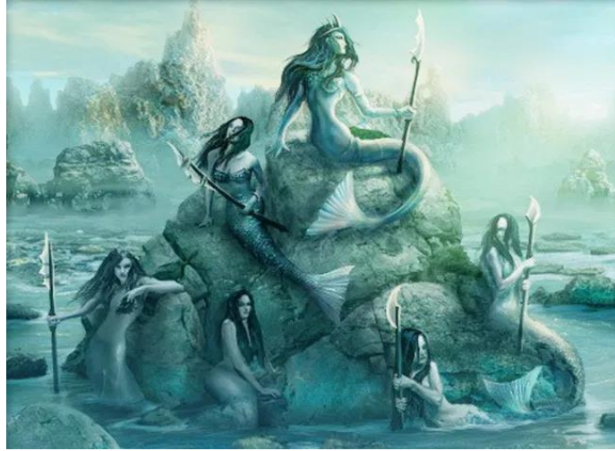
Εικόνα 10: Σειρήνες

Στον Ημίαιμος Πρίγκιπ γίνεται αναφορά στη σφίγγα (Ρουλιγκ, 2005:19). Η σφίγγα στη ελληνική μυθολογία παρουσιάζεται ως ένα λιοντάρι με φτερά και κεφάλι γυναίκας ή ως γυναικά με στήθος λιονταριού, η ουρά της σαν αυτή που έχει το ερπετό και φτερά, όπως έχει ένα πτηνό (MATYSZAK, 2013). Ο Οιδίποδας γνώριζε ότι η σφίγγα ζητούσε από όλους που ταξίδευαν να απαντήσουν σε ένα αίνιμά της και αυτούς που έδιναν λανθασμένη απάντηση τους σκότωνε. Η Σφίγγα αν συναντούσε κάποιον που έδινε σωστή απάντηση στο αίνιγμα της σκότωνε το εαυτό της. Ο Οιδίποδας βρήκε την απάντηση και η Σφίγγα έπεσε από τον βράχο. Ο άντρα που νίκησε την Σφίγγα, γύρισε στην Θήβα και του πρότειναν να κάνει σύζυγό του την Ιοκάστη και να γίνει ο ίδιος βασιλιάς, αφού ο προηγούμενος είχε πεθάνει (MATYSZAK, 2013).