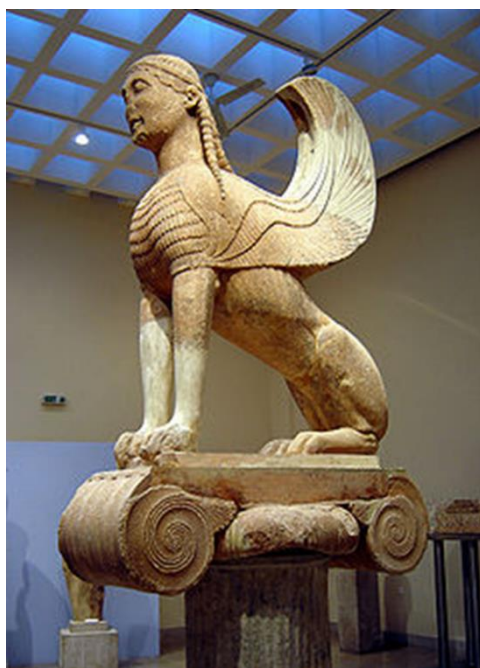
Εικόνα 11: Η Σφίγγα των Ναξίων

Επίσης αναφέρεται η Γκένογκ Τζοούνς που ήταν αρχηγός των Αγιοκέφαλων Αρπυιών (Ρόουλινγκ, 2005:82, 110 &155). Οι Αρπυιές ήταν μυθικά τέρατα με σώμα πουλιού και κεφάλι γυναίκας οι οποίες κατά τον Ησίοδο είχαν πανέμορφα μακριά μαλλιά. Οι Αρπυιές είχαν αδερφή την Ίριδα, η οποία ήταν αγγελιοφόρος των θεών το όνομά τους σημαίνει άρπαγα όπως και οι Αρπυιές έπαιρναν το φαγητό από τα θύματά τους και δεν γινόταν φάνε τα αποφάγια τους εξαιτίας της δυσωδίας τους ήταν μολυσμένα. Είχανε φτερά από ατσάλι και έμοιαζαν σαν πανοπλία (MATYSSZAK, 2013). Βασάνιζαν τον βασιλιά της Θράκης Φινέα. Ο Δίας είχε τυφλώσει τον βασιλιά και οι Ερινύες του έτρωγαν το φαγητό με αποτέλεσμα να μην τρώει τίποτα. Σαν υποχρέωση είχανε να παραδίδουν αυτούς που παραβιάζανε τους νόμους και τους εγκληματίες στις Αρπυιές (MATYSSZAK, 2013). Ο Φινέας ζήτησε από τους Αργοναύτες να σκοτώσουν τις Αρπυιές, όμως δεν ήθελαν να θυμώσουν τον Δία και τις έδιωξαν. Ο Φινέας μπόρεσε να φάει και πρόσφερε την βοήθειά του στους Αργοναύτες ώστε να συνεχίσουν το ταξίδι τους (MATYSSZAK, 2013). Η προέλευση του ονόματος τους είναι από την αρχαία ελληνική λέξη άρπαξ και σημαίνει αρπακτικές. Ο Όμηρος κάνει αναφορά στα έργα του μόνο για μια αρπυία, την Ποδάγρη. Ο Ησίοδος αναφέρει άλλες τρεις: την Αέλλω, την Ωκυπέτη και την Κελαινώ (MATYSSZAK, 2013).