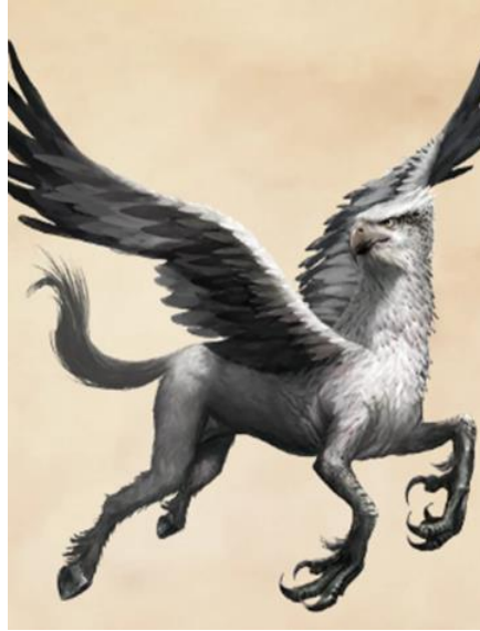
Εικόνα 9: Ωραιόμορφος

Στο κύπελο της φωτιάς ο Χάρι και οι άλλοι διαγωνιζόμενοι έχουν να αντιμετωπίσουν τους γοργονάνθρώπους (Ρουλινγκ, 2000). Είχαν πανέμορφη φωνή με την οποία παρέσερναν τους ναυτικούς και τους σκοτώνανε. Ακόμη λένε ότι οι σειρήνες μεταμορφώθηκαν σε πλάσματα που θύμιζαν πουλιά, επειδή δεν καταφέρανε να προστατέψουν την Περσεφόνη. Έμεναν στα νησιά που ήταν κοντά στη νότια Ιταλία. Αν μια σειρήνα δεν μπορούσε να μαγέψει τον άντρα με την φωνή της, εξαφανιζόταν. Οι Αργοναύτες ήταν αυτοί που κατάφεραν να εξαφανίσουν όλο τον ανατολικό κλάδο του πληθυσμού της, όταν το τραγούδι του Ορφέα ήταν ανώτερο από αυτό των σειρήνων (MATYSSZAK, 2013).