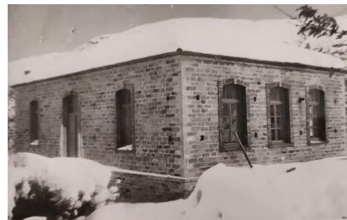
Διδακτήριο Δημοτικού Σχολείου Παλαιογρατσάνου