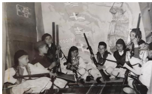
5 ο Δημοτικό Σχολείο Κοζάνης