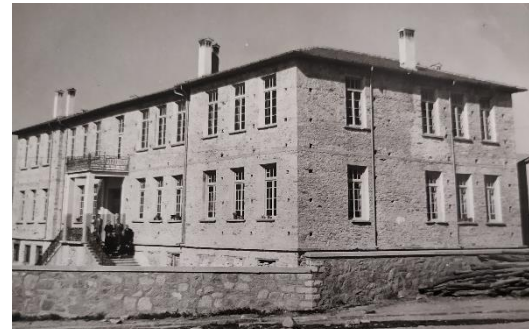
Διδακτήριο 1 ο και 2 ο Δημοτικού Σχολείου Βελβεντού