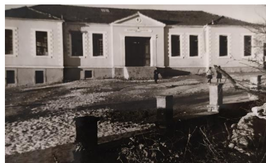
Διδακτήριο 1 ο Δημοτικού Σχολείου Κρόκου