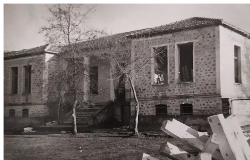
Διδακτήριο Δημοτικού Σχολείου Καταφυγίου