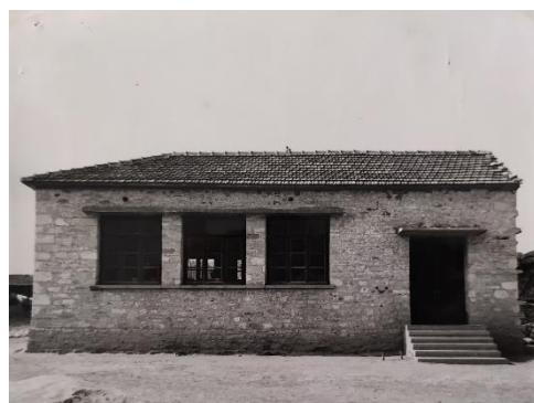
Διδακτήριο Δημοτικού Σχολείου Ροδίτου