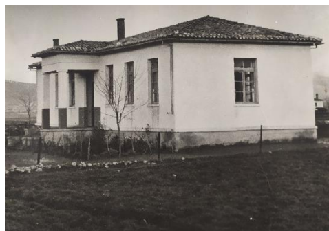
Διδακτήριο Δημοτικού Σχολείου Βατερού