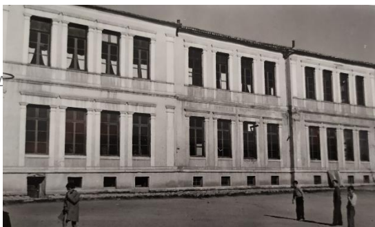
Διδακτήριο 5 ο Δημοτικού Σχολείου