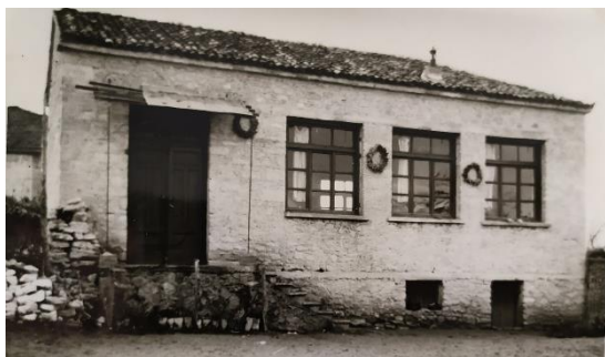
Διδακτήριο Δημοτικού Σχολείου Αγίας Παρασκευής