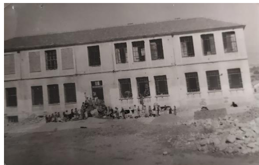
Διδακτήριο 2 ο Δημοτικού Σχολείου Σερβίων