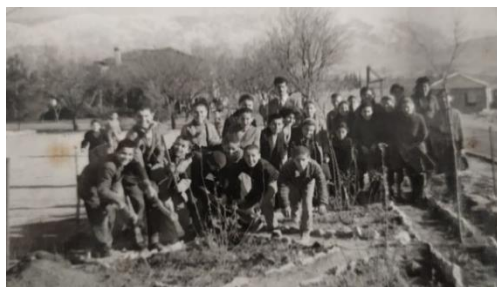
Δημοτικό Σχολείο Κοΐλων