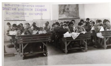
Τριθέσιο Δημοτικό Σχολείο Βατερού