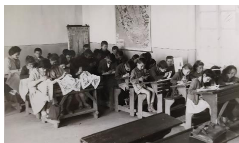
Δημοτικό Σχολείο Βαθύλακκου