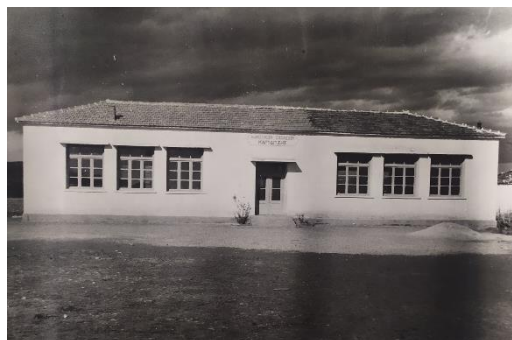
Διδακτήριο Δημοτικού Σχολείου Καρυδίτσας