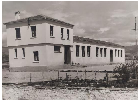
Διδακτήριο Δημοτικού Σχολείου Βαθύλακκου