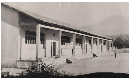
Διδακτήριο 1 ο Δημοτικού Σχολείου Σερβίων