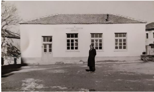
Διδακτήριο 2 ο Δημοτικού Σχολείου Κρόκου