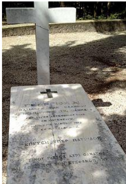
Εικ. 13. Ο τάφος του Γεωργίου Α΄, Τατόι.