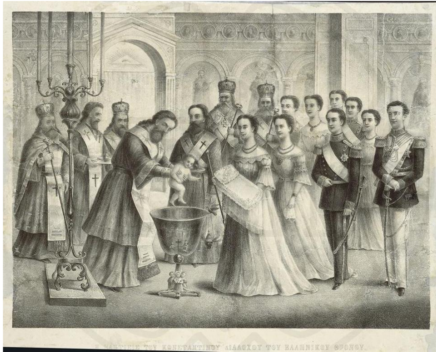
Εικ. 7. Λιθογραφία (50x59 εκ.), Η βάπτιση του Κωνσταντίνου Α΄, διαδόχου του ελληνικού θρόνου, 22 Αυγούστου 1868, Μουσείο Μπενάκη.