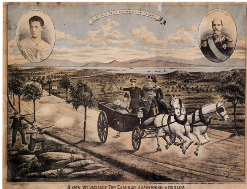
Εικ. 9. Η δολοφονική απόπειρα εναντίον του βασιλιά Γεωργίου Α΄ και της κόρης του Μαρίας στο Παλαιό Φάληρο, 14 Φεβρουαρίου 1898.