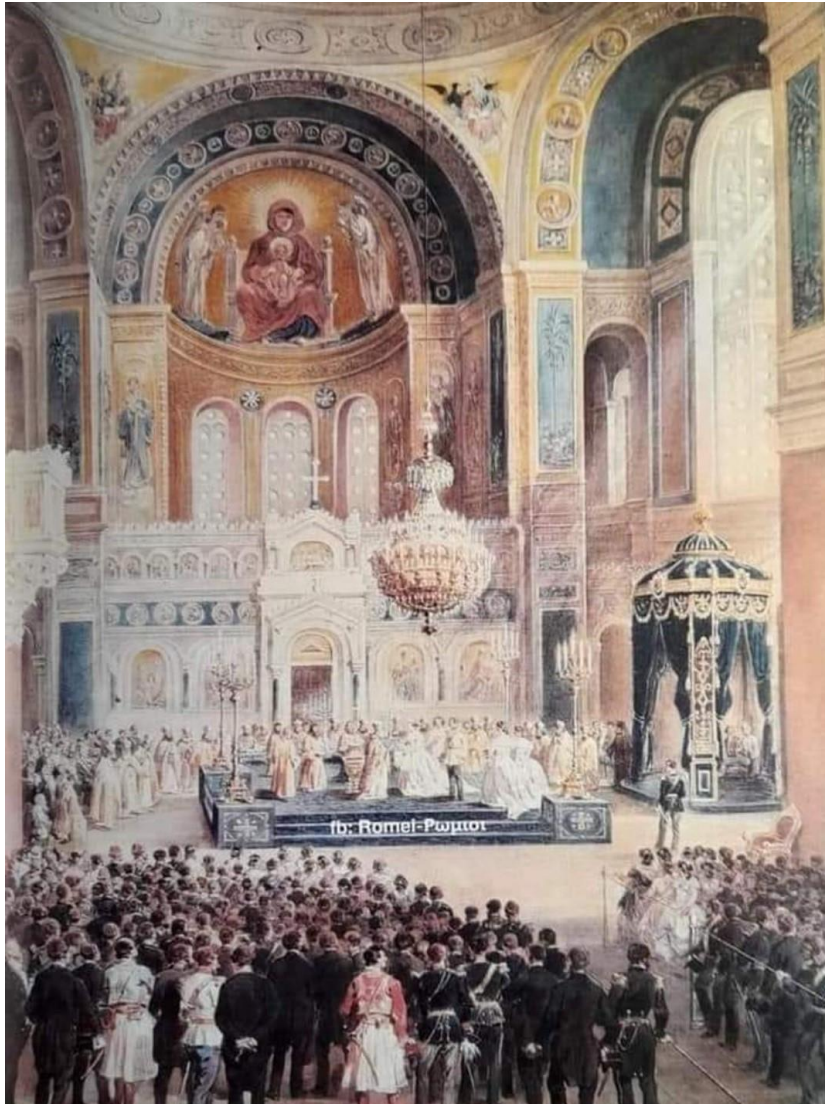
Εικ. 8. Πίνακας, Η βάπτιση του Κωνσταντίνου, 1869, Schranz και Bayot, Μουσείο της Ιστορικής και Εθνολογικής Εταιρείας.