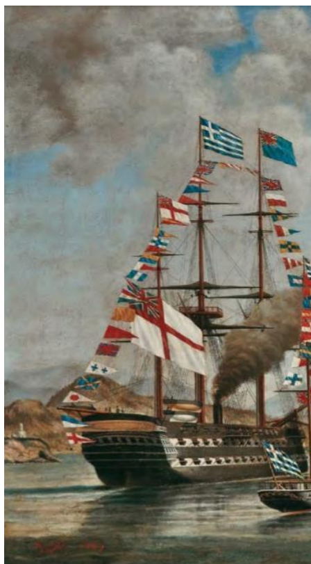
Εικ. 1. Πίνακας (90x150 εκ.), Η έλευση του βασιλιά Γεωργίου Α΄, 1869, Ανδρέας Κριεζής.

Ο Ανδρέας Κριεζής (1813-1877) είχε καταγωγή από την Ύδρα και υπήρξε λιθογράφος, ζωγράφος και αιογράφος με σπουδές στο Παρίσι. Εργάστηκε για ένα διάστημα στο βασιλικό τυπογραφείο και