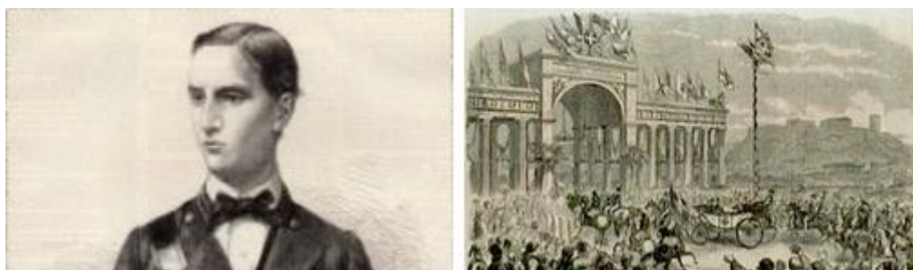
Εικ. 4. Ο Βασιλιάς Γεώργιος Α΄ σε ταξίδι στο Λονδίνο, IllustratedLondonNews , 10/10/1863.

Ο Βασιλιάς Γεώργιος Α΄ απεικονίζεται από το ζωγράφο Ιακωβίδη με πολιτικά. Πρόκειται για σπάνια εμφάνιση που ο ζωγράφος κατάφερε να αποδώσει με ρεαλιστικό τρόπο. Ο Γιώργος Ιακωβίδης υπήρξε ο κατεξοχήν εκπρόσωπος της ακαδημαϊκής ζωγραφικής στην Ελλάδα, κορυφαίος ζωγράφος του 20 ου αιώνα εκπρόσωπος της σχολής του Μονάχου (γερμανικός ιμπρεσιονισμός). Στα έργα του αποτυπώνει την απτή πραγματικότητα με ρεαλιστικές λεπτομέρειες, αγαπά τα θέματα με παιδιά και η προσήλωση και η αγάπη του στο θέμα αυτό τον καθιστά ως τον καλύτερο ζωγράφο του παιδικού κόσμου. Χρύσανθος, Χ. (2006). Οι Μεγάλοι Έλληνες Ζωγράφοι. Γεώργιος Ιακωβίδης . Αθήνα: Ελληνικά Γράμματα.