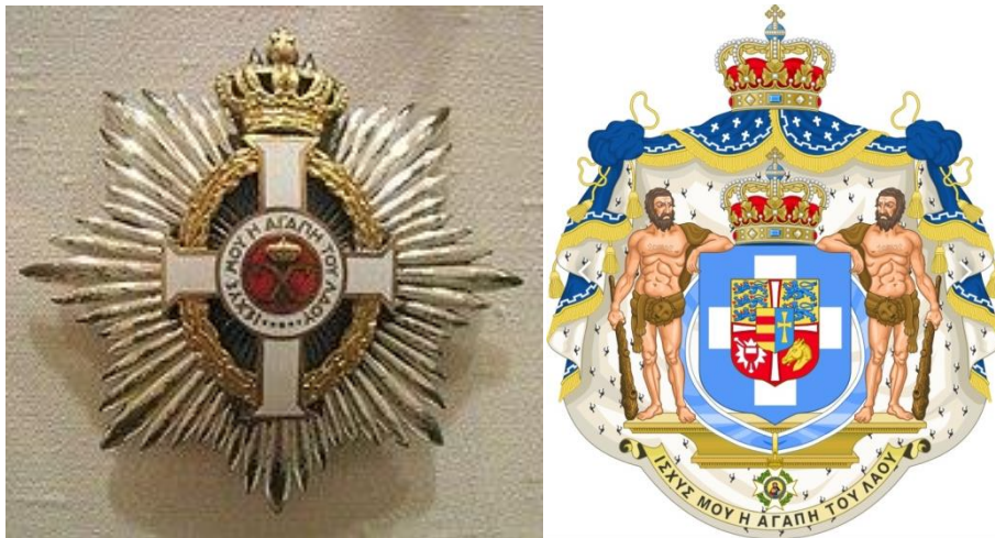
Εικ. 6. Τάγμα του Γεωργίου Α΄ (16 Ιανουαρίου 1915)