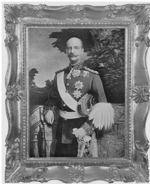
Εικ. 2. Πίνακας σε καμβά (70x50 εκ.). Πορτραίτο του Βασιλέως Γεωργίου Α', George Burroughs Torrey, 1920, Ιδιωτική Συλλογή, Βοστώνη.

λιθογραφείο της Αθήνας φιλοτέχνησε κυρίως προσωπογραφίες που παριστάνουν κυρίως γόνους αρχοντικών οικογενειών των νησιών όπου δίνεται έμφαση στη λεπτομέρεια των διακοσμητικών στοιχείων. http://www.nationalgallery.gr/site/content.php?sel=247&artist_id=4376