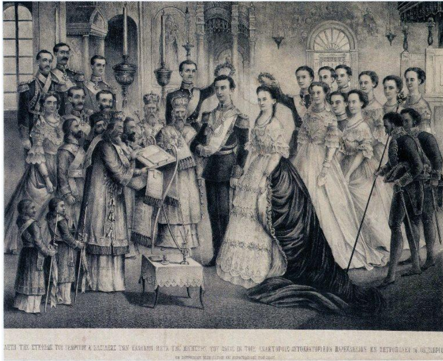
Εικ. 5. Ο γάμος του Βασιλιά Γεωργίου Α΄ και της μεγάλης δούκισσας Όλγας.