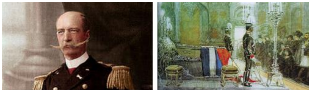
Εικ. 11. Καρποστάλ, Προσωπογραφία του Γεωργίου Α΄, 1912.