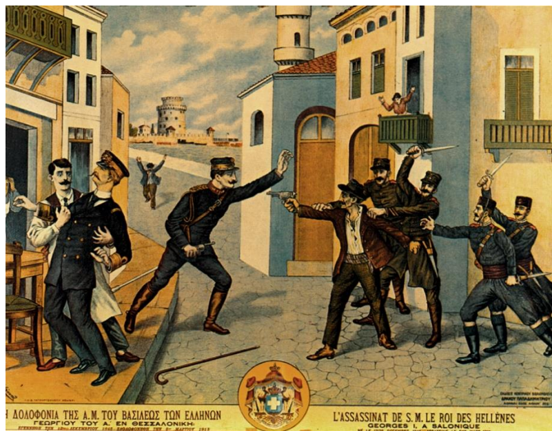
Εικ. 10. Η δολοφονία του Γεωργίου Α΄ στη Θεσσαλονίκη, 5 Μαρτίου 1913.