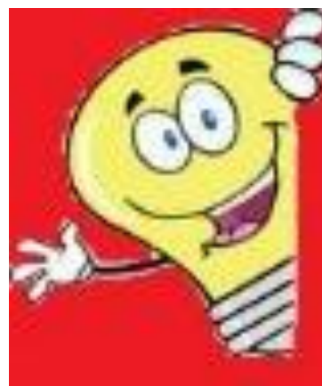
Εικόνα 1: Κύριος Φαντάσιος

Ο Κύριος Φαντάσιος πρόκειται για μία λάμπα με ανθρώπινα χαρακτηριστικά, που στέλνει στο νηπιαγωγείο ένα δέμα, το οποίο θα πρέπει να ψάξουν να βρουν τα παιδιά. Μέσα στο δέμα θα εμπεριέχονται κάποιες λέξεις επιλεγμένες (υποτίθεται) από τον κύριο Φαντάσιο, με τις οποίες τα παιδιά θα πρέπει να γράψουν ένα ποίημα ή ένα κείμενο με λογική σειρά των