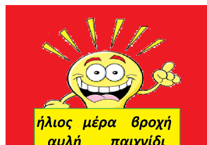
Εικόνα 4: Λέξεις Κ. Φαντάσιου

1. αφού τελειώσει το πρώτο βίντεο με τον Κ. Φαντάσιο τα παιδιά θα προσπαθήσουν να βρουν το κρυμμένο δώρο που τους έστειλε, το οποίο θα έχει τοποθετήσει η νηπιαγωγός χωρίς να το γνωρίζουν, μέσα στην τάξη τους. Αφού το βρουν θα το ανοίξουν στη μέση της τάξης και με την βοήθεια της νηπιαγωγού θα