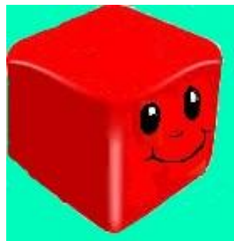
Εικόνα 2: Κύριος Ζάρης

Ο Κύριος Ζάρης στην πραγματικότητα είναι ο βοηθός δύο μεγάλων ζαριών. Το ένα ζάρι είναι γεμάτο με βασικές λέξεις και φράσεις όπως : είμαι, θέλω, και, αν, εγώ, μου αρέσει. Με αυτές τις λέξεις ή φράσεις τα παιδιά καλούνται να δημιουργήσουν ανάλογα με τη λέξη που θα τους τύχει ένα δίστιχο και με το πέρας των μαθημάτων ένα τετράστιχο. Το δεύτερο ζάρι έχει στις πλευρές του φατσούλες συναισθημάτων με τις οποίες τα παιδιά, ανάλογα με αυτή που θα τύχουν, θα κληθούν να αφηγηθούν μια ίδια ιστορία που θα δοθεί σε όλους, με το συναίσθημα που τους έτυχε. Έτσι, θα εξασκηθούν στο να αλλάζουν το ύφος, τη στίξη και άλλα χαρακτηριστικά ενός κειμένου ανάλογα με τη διάθεση που τους ζητείται και να αντιλαμβάνονται τις διαφορές που δημιουργούνται σε αυτό το κείμενο. Μαζί με την παρούσα πτυχιακή εργασία παραδίδεται και βίντεο με τον κύριο Ζάρη, το οποίο θα προβληθεί στα παιδιά για να προκληθεί το ενδιαφέρον τους.