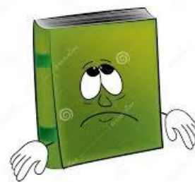
Εικόνα 3: Κύριος Παραμύθης

Ο Κύριος Παραμύθης πρόκειται για ένα κενό παραμύθι, το οποίο πρέπει να γεμίσουν τα παιδιά. Το κάθε παιδί θα δημιουργήσει το δικό του παραμύθι. Το παραμύθι αυτό δεν θα περιέχει λέξεις αλλά ζωγραφιές των παιδιών τις οποίες θα σκανάρει η νηπιαγωγός. (Εικόνα 4.). Το κάθε παιδί θα αφηγηθεί στους άλλους το παραμύθι του και θα δώσει ένα τίτλο. Κάθε εβδομάδα θα κερδίζει βραβείο το παραμύθι το οποίο θα αφηγηθεί με τον πιο περιγραφικό τρόπο. Στόχος της όλης διαδικασίας είναι και η διαθεματικότητα με τα εικαστικά αλλά και η εξάσκηση στην περιγραφή. Μαζί με την παρούσα πτυχιακή εργασία παραδίδεται και βίντεο με τον κύριο Παραμύθι, το οποίο θα προβληθεί στα παιδιά για να προκληθεί το ενδιαφέρον τους.