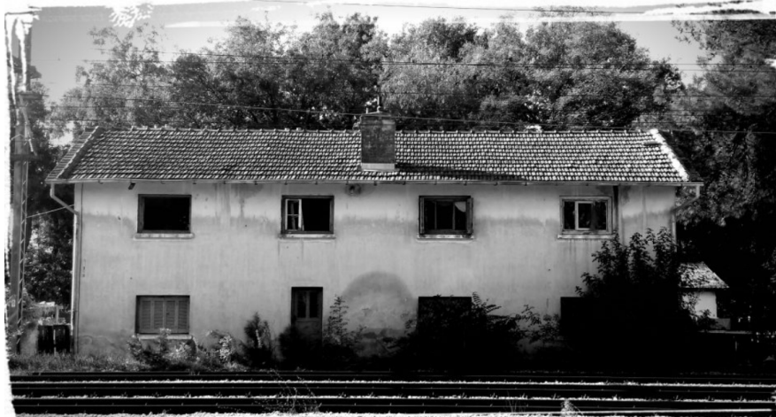
Εικόνα 3: Κτίριο Παλαιού Σιδηροδρομικού Σταθμού Σίνδου

Ο σιδηροδρομικός σταθμός έπαιξε σημαντικό ρόλο στην οικονομική και κοινωνική ανάπτυξη της Σίνδου, καθώς την κατέστησε σημαντικό κόμβο διακίνησης επιβατών και εμπορευμάτων (Γκλαβέρης, 1998). Η μεταφορά των εμπορευμάτων, των γεωργικών και κτηνοτροφικών προϊόντων πραγματοποιούνταν πιο γρήγορα προς κάθε κατεύθυνση (Παπαγεωργίου, 2002).