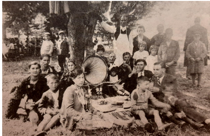
Εικόνα 6: Πρωτομαγιά στην «Καραγάτσια»

δέντρα προσέλκυε πολύ κόσμο από τις γύρω περιοχές. Πιο συγκεκριμένα, την πρωτομαγιά κατέφθανε πολύς κόσμος με την επιθυμία να «πιάσει τον Μάη». Εκείνη την περίοδο, όλοι οι καταστηματάρχες της Σίνδου μετέφεραν τον εξοπλισμό τους από τα καφενεία τους και τον έστηναν στην «Καραγάτσια».