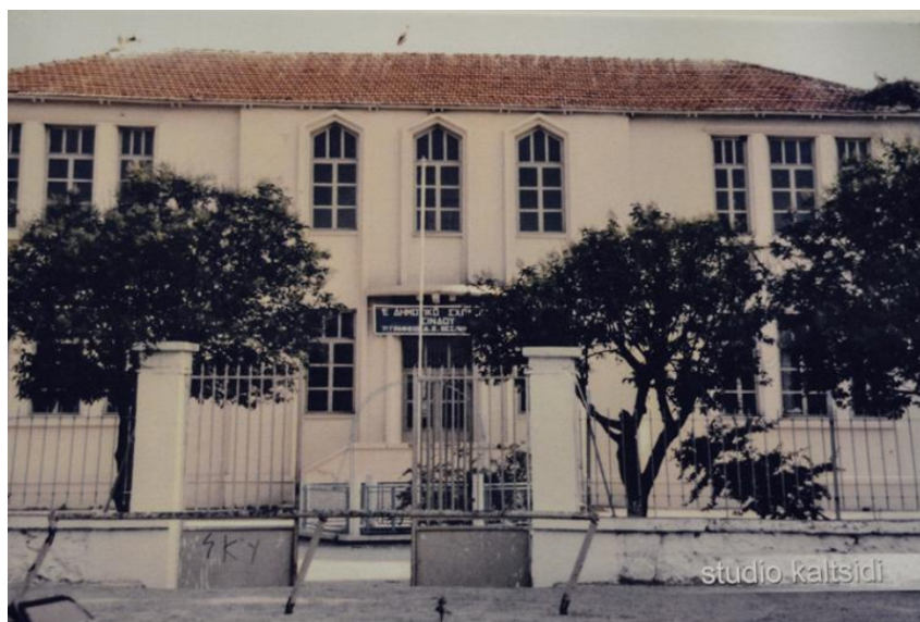
Εικόνα 5: Παλιό Δημοτικό Σχολείο Σίνδου

Το νέο διώροφο σχολείο εγκαινιάστηκε το 1932, κατά την περίοδο της κυβέρνησης του Βενιζέλου. Οι μαθητές που φοίτησαν πρώτοι ήταν το 1934. Μέχρι το 1994 λειτουργούσε ως Δημοτικό Σχολείο, το οποίο λειτουργούσε με διπλή βάρδια (πρωινό και εσπερινό). Είναι σχεδιασμένο σύμφωνα με τις προδιαγραφές του Καλλία, για τα σχολικά κτίρια. Τέλος, το σχολείο ήταν διακοσμημένο με την νεοκλασική επιρροή, ώστε να προσδίδει την επιβλητικότητα ενός φορέα της παιδείας και της μόρφωσης (Delta Municipality, 2019).