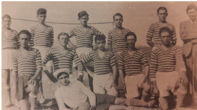
Εικόνα 7: Η ποδοσφαιρική ομάδα της “Ομόνοιας” το έτος 1939

Ακόμη, σημαντικό είναι να αναφερθεί, η ίδρυση του “Συστήματος Προσκόπων της Σίνδου” το 1956, στο οποίο συμμετείχαν πολλά παιδιά της κοινότητας Σίνδου. Το 1957 κατασκευάστηκε ένα κτίριο, με σκοπό την στέγαση των Προσκόπων, κοντά στο τοπικό κοινοτικό κατάστημα. Εκείνη την περίοδο ξεκίνησαν να ιδρύονται στις γύρω περιοχές και άλλα Συστήματα Προσκόπων και το 1962 αποφασίστηκε η ίδρυση της “Τοπικής Εφορίας Προσκόπων Σίνδου”, στην οποία εντάχθηκαν τα συστήματα Προσκόπων της Ν. Μεσήμβριας, των Κυμίνων και των Ν.Μαλγάρων. Τα επόμενα χρόνια τα Συστήματα των Προσκόπων ήταν πολύ δραστήρια, καθώς διοργάνωναν πολλές εκδρομές στην φύση (Γκλαβέρης, 1998).