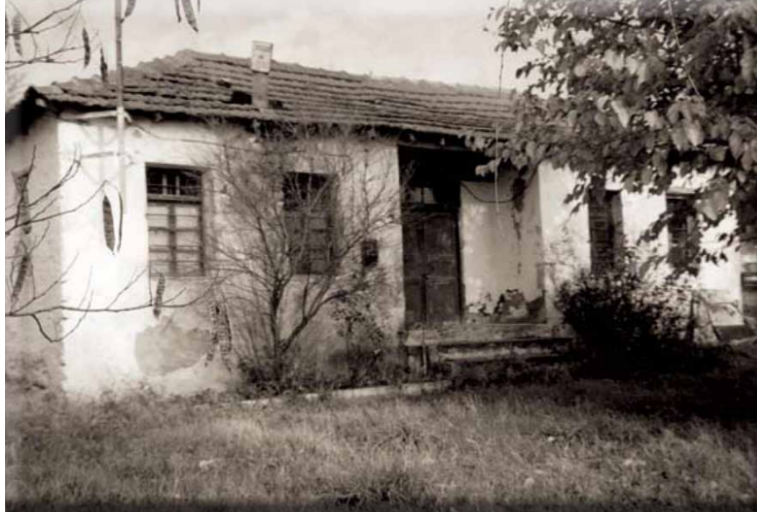
Εικόνα 4: Προσφυγικό κατάλυμα