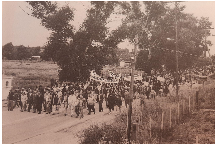
Εικόνα 8: Πορεία διαμαρτυρίας 2 Οκτωβρίου 1987 από τους κατοίκους της Σίνδου

Επιπλέον, ιδιαίτερα βοηθητική είναι μία φυσική προσφορά, η οποία βοηθά στην ανανέωση του καθαρού και υγιεινού αέρα. Πιο συγκεκριμένα, γίνεται αναφορά για τον άνεμο βαρδάρη, ο οποίος είναι ένας ψυχρός και ξηρός αέρας που πνέει από τον Αξιό ποταμό και έχει διάρκεια περίπου σαράντα ημέρες. Αυτός ο ισχυρός άνεμος βοηθάει σημαντικά στην ανανέωση του αέρα (Γκλαβέρης, 1998).