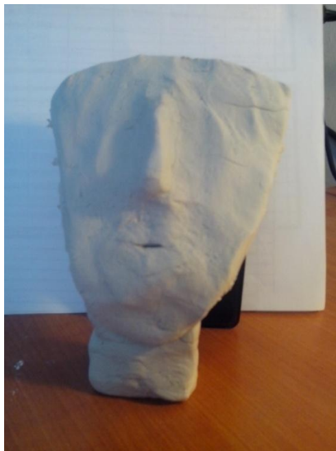
(Έργα της ιδίου της συγγραφέως)