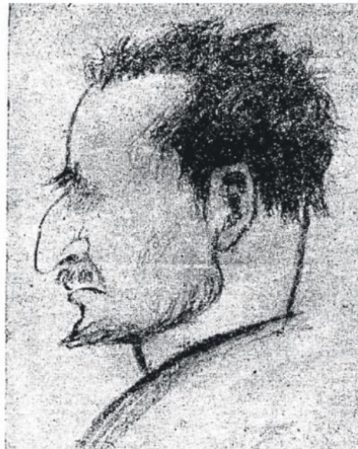
Αριστερά: Σκίτσο του Γ. Φτέρη από την περίοδο της τρέλας του Μητσάκη. [Πηγή: Α. Caracalos, Œuvres inédites de M. Mitsakis, 1957]. Δεξιά: Σκίτσο του Γ. Φτέρη από την περίοδο της τρέλας του Μητσάκη [Πηγή: εφ. Πατρίς, 8.6.1916].