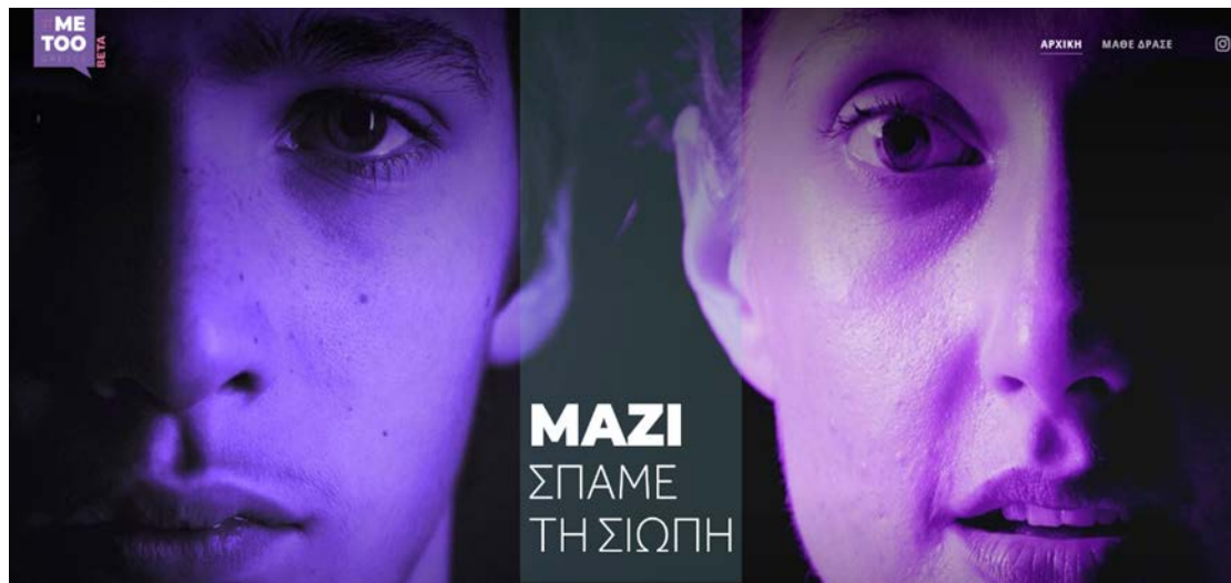
Εικόνα 2: Η αρχική σελίδα του οργανισμού «METOO GREECE»

και τα αυξανόμενα περιστατικά σεξουαλικής κακοποίησης, αλλά μέσω του διαδικτύου δημιουργήθηκαν δράσεις που αποσκοπούσαν στην άμβλυνση του προβλήματος και στην ενίσχυση της θέσης του θύματος, ενθαρρύνοντάς το να μιλήσει για τα περιστατικά που έχει βιώσει και να αισθανθεί ασφάλεια. Μια χαρακτηριστική περίπτωση αποτελεί η σελίδα #METOO GREECE, που δημιουργήθηκε τα τελευταία χρόνια στην Ελλάδα. Με σύνθημα την έκφραση «Σπάμε τη σιωπή», η σελίδα διαμορφώθηκε με στόχο την συμπαράσταση στις γυναίκες που έχουν δεχθεί σεξουαλική κακοποίηση (#METOO GREECE, 2022). Η σελίδα #METOO GREECE, έχει ενημερωτικό χαρακτήρα καθώς το περιεχόμενό της αφιερώνεται στα δικαιώματα της γυναίκας και στις δράσεις που πραγματοποιούνται σε μια προσπάθεια προάσπισης των δικαιωμάτων αυτών. Πρόκειται για μια σελίδα στην οποία η κακοποιημένη γυναίκα μπορεί να βρει καταφύγιο, να ενημερωθεί και να δράσει άμεσα για να σπάσει την αλυσίδα της κακοποίησης. Αντίστοιχη μη κερδοσκοπική οργάνωση, η οποία παρέχει υπηρεσίες στις κακοποιημένες γυναίκες στα πλαίσια του κινήματος, αποτελεί η ομώνυμη οργάνωση «Metoo» (Me too, 2022). Αμφότερες αυτές οι οργανώσεις επεκτείνουν την δράση τους παρέχοντας υπηρεσίες συμβουλευτικού χαρακτήρα, ενισχύοντας τη θέση του θύματος και δίνοντας του το βήμα να δημοσιοποιήσει και να καταγγείλει τα περιστατικά σεξουαλικής κακοποίησης που έχει δεχθεί.