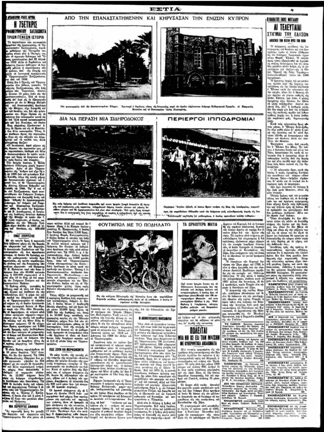
Εικόνα 1. Εστία, 22 Οκτωβρίου 1931