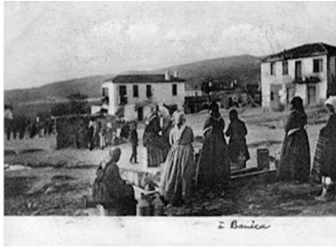
Εικόνα 1: Πλατεία Βεύης.