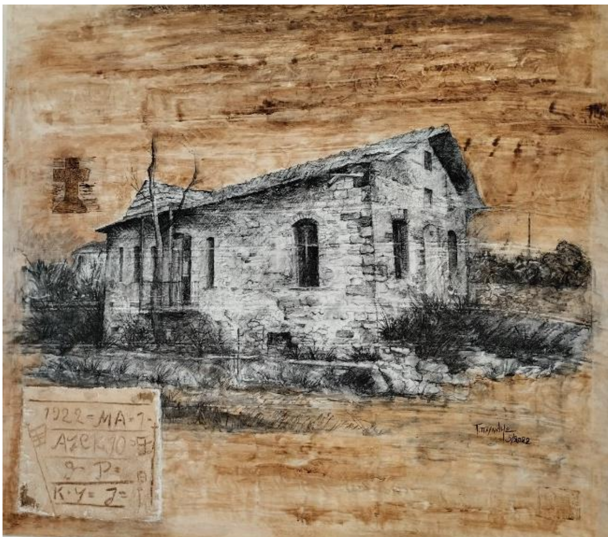
Εικόνα 26: Έργο μου οικίας Ράππου/ 1,20 X 1,00 εκ./ μεικτή τεχνική.