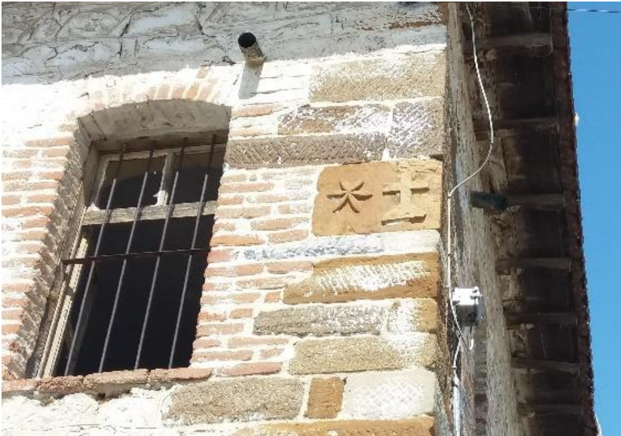
Εικόνα 10: Λιθανάγλυφη επιγραφή στην δεξιά άκρη του κτηρίου.