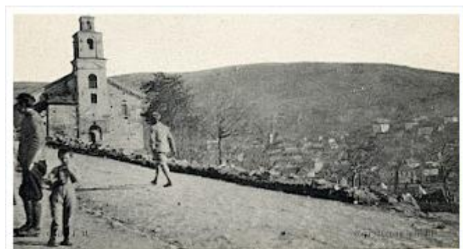
Εικόνα 3: Παλαιά εκκλησία Βεύης.