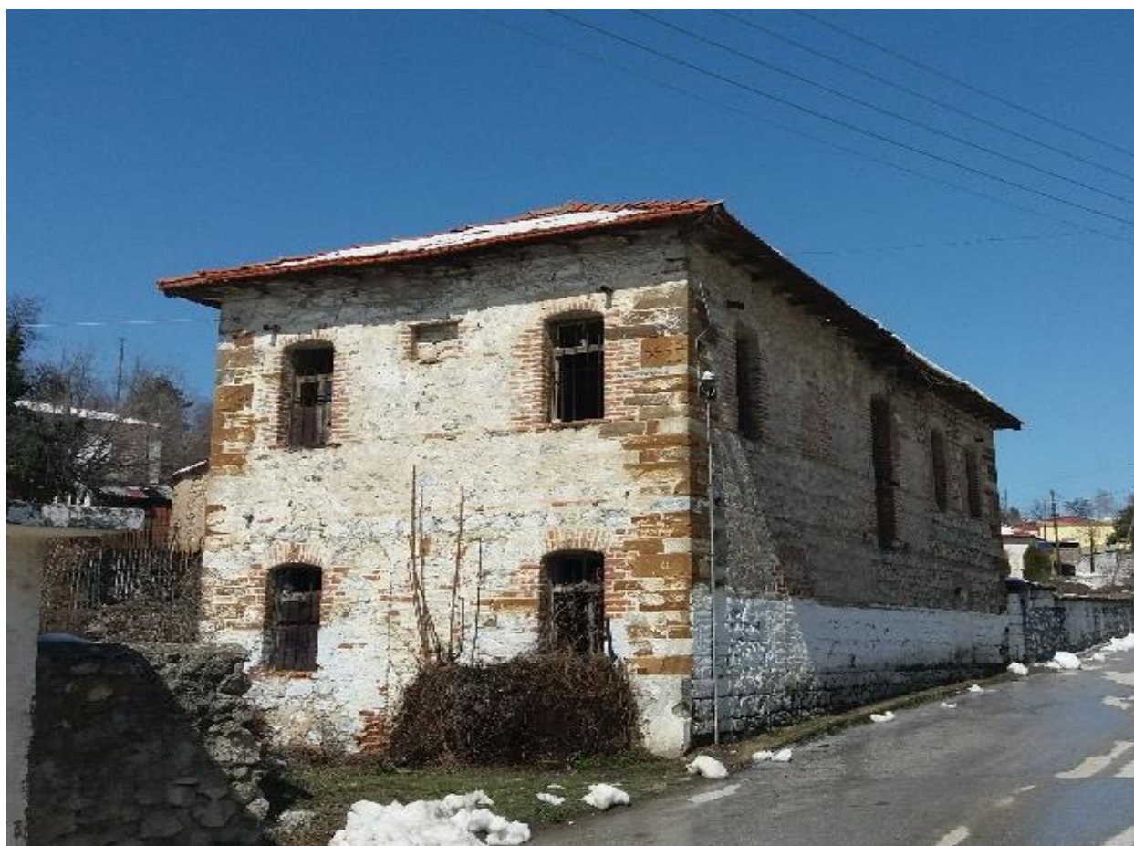
Εικόνα 7: Δεξιά πλάγια και πίσω όψη 2 ο Παλαιό δημοτικό σχολείο Βεύης