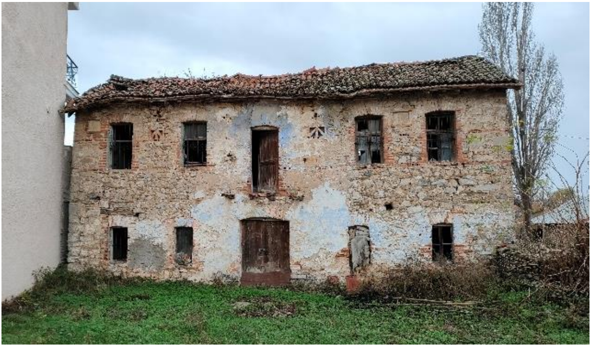
Εικόνα 27: Κόρια όψη οικίας Γ.Ρόμπη