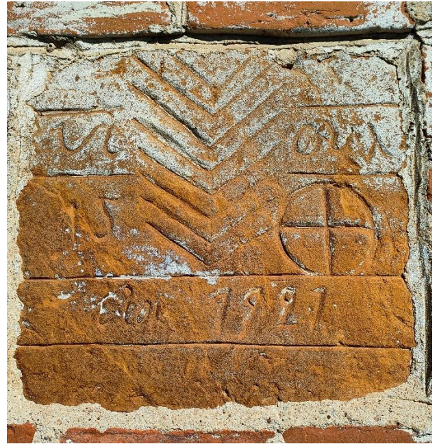
Εικόνα 15 και 16: Λαξευμένοι σταυρός αριστερά ψηλά στην άκρη του κτιρίου/ Λιθανάγλυφη επιγραφή του κτιρίου ψηλά στο μέσον της πρόσοψης. .