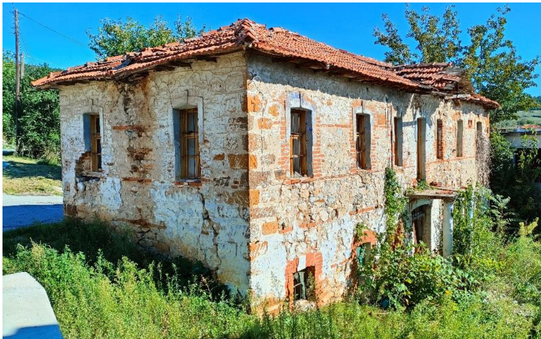
Εικόνα 15: Αριστερή πλάγια όψη κτιρίου