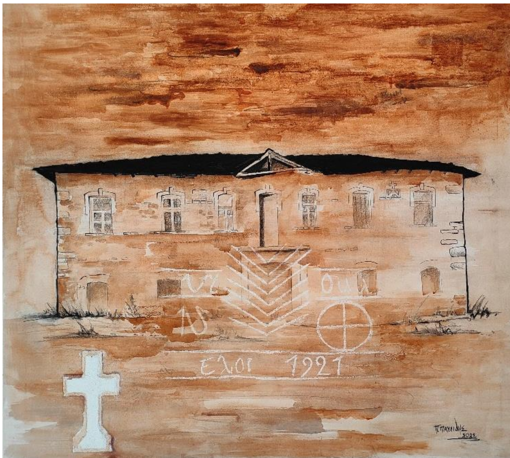
Εικόνα 17: Έργο μου οικίας Παπαφιλίππου/ 1,20 X.1,00 εκ./ μεικτή τεχνική.