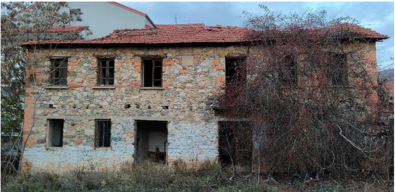
Εικόνα 19: Πρόσωση κτιρίου