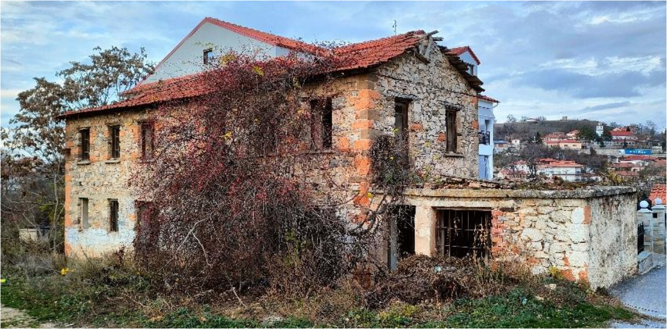
Εικόνα 18: Οικία Ντόρε Πρεκοπάνκεν