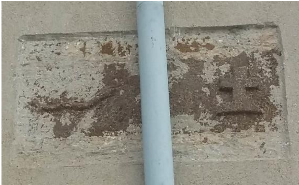
Εικόνα 3: Λιθανάγλυφη Επιγραφή στην δεξιά άκρη του κτιρίου.