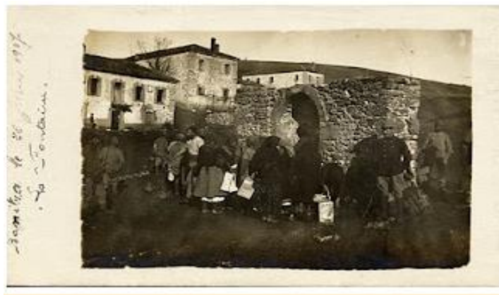
Εικόνα 2: Παλιό κέντρο Βεύης.