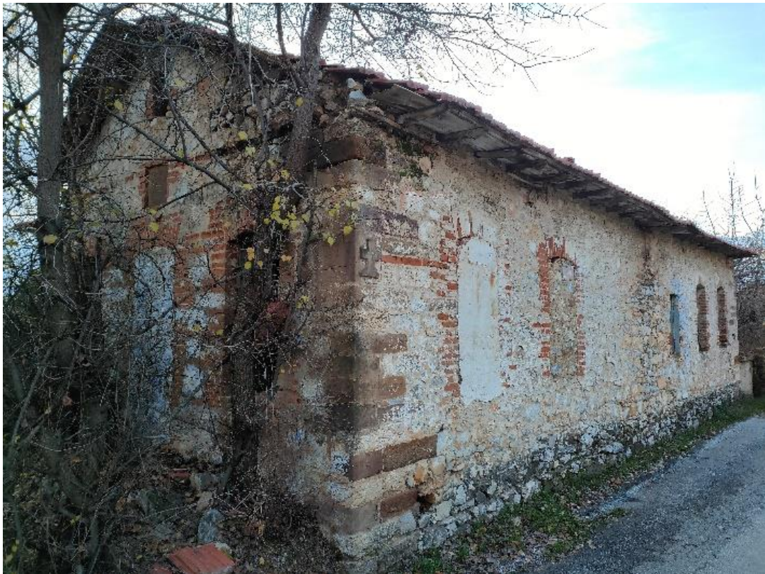
Εικόνα 23: Πίσω όψη οικίας Σταύρου Ράππου.