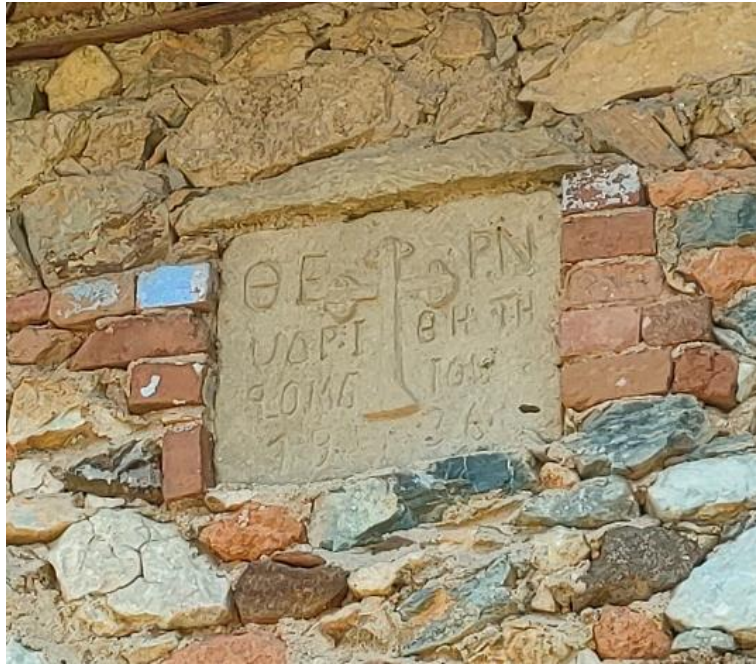
Εικόνα 20: Λιθανάγλυφη επιγραφή κτιρίου