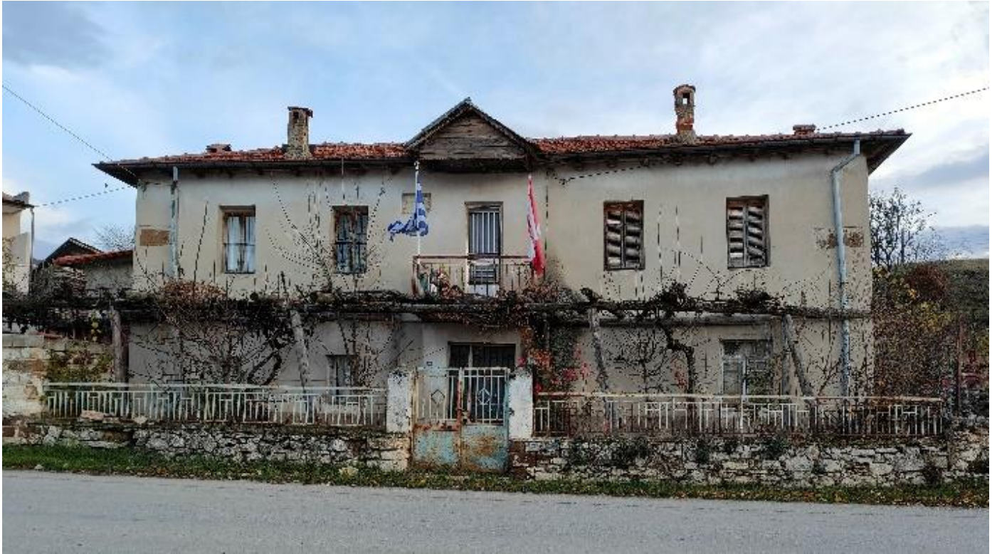
Εικόνα 1: Πρόσοψη οικίας Α.Κωτσπούλου.