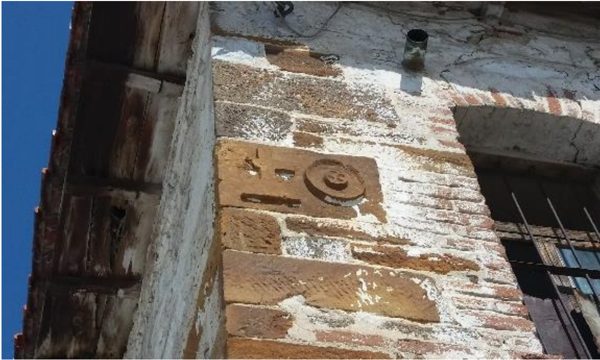
Εικόνα 9: Λιθανάγλυφη επιγραφή στην αριστερή άκρη του κτηρίου.