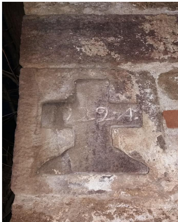
Εικόνα 25: Ανάγλυφος Σταυρός στην αριστερή άκρη της πίσω όψης του κτιρίου.