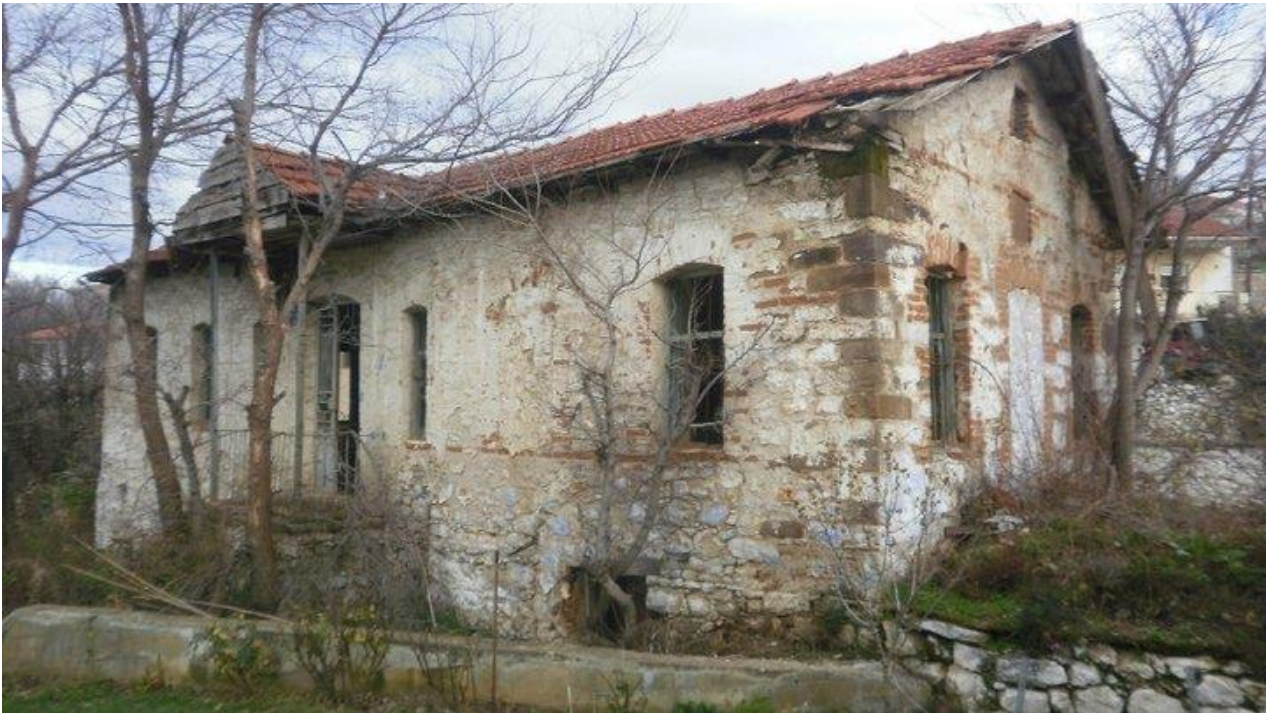
Εικόνα 22: Κύρια όψη οικίας Σταύρου Ράππου..