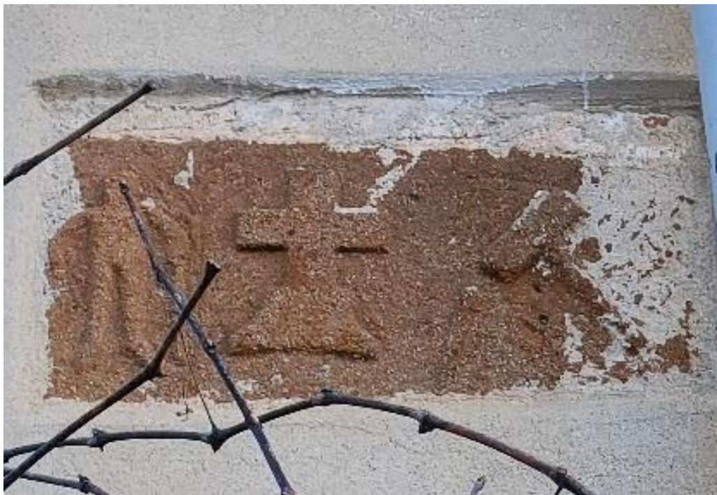
Εικόνα 2: Λιθανάγλυφη Επιγραφή στην αριστερή άκρη του κτιρίου.