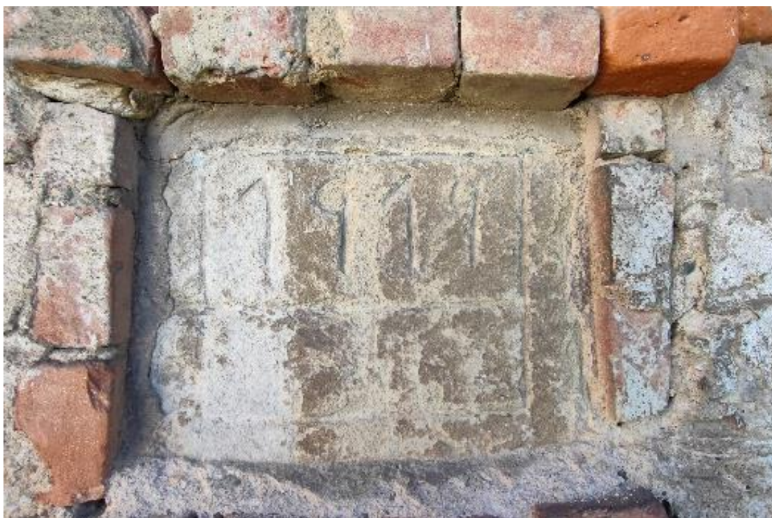
Εικόνα 29: Λιθανάγλυφη επιγραφή ψηλά στην δεξιά πλευρά του κτιρίου.