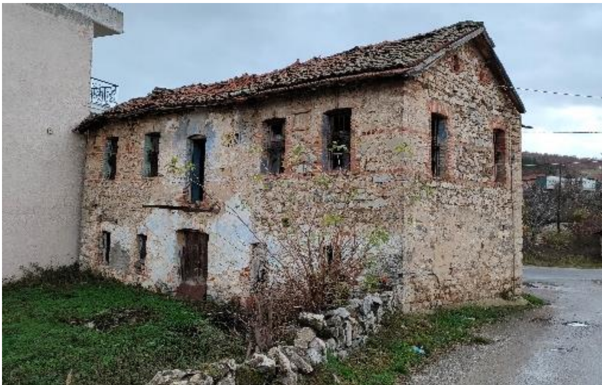
Εικόνα 28: Πρόσοψη και δεξιά πλάγια όψη κτιρίου