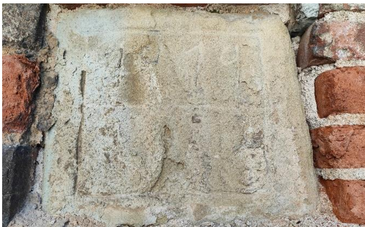
Εικόνα 30: Λιθανάγλυφη επιγραφή ψηλά στην αριστερή πλευρά του κτιρίου.