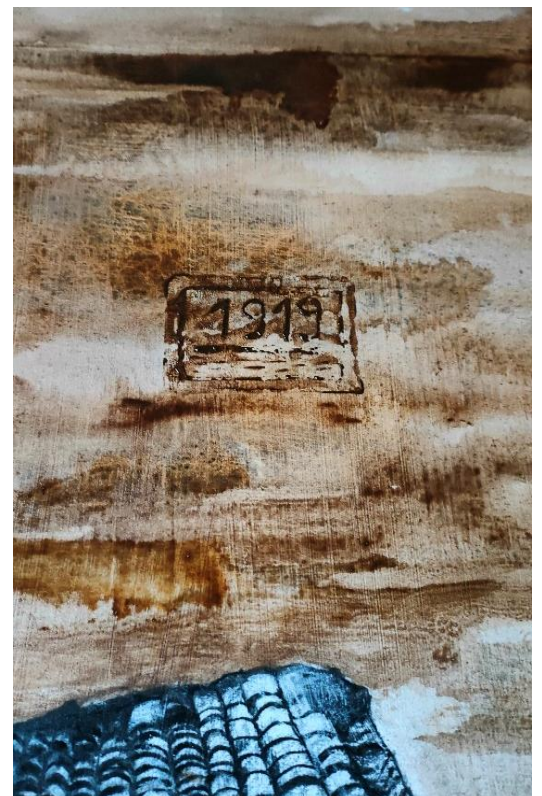
Εικόνα 31 και 32: Λεπτομέρειες έργου: χαρακτηριστικό τύπομα επιγραφής στον καμβά.