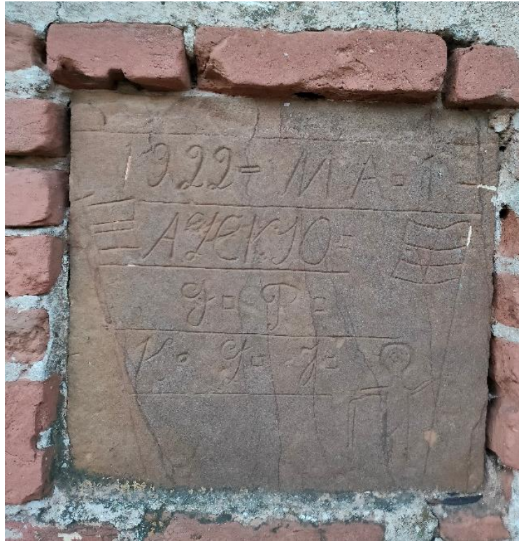
Εικόνα 24: Λιθανάγλυφη επιγραφή κτιρίου.