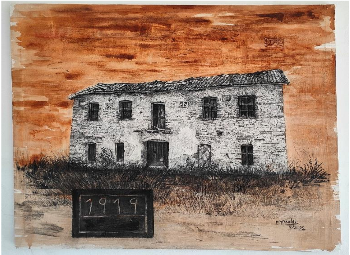
Εικόνα 31: Έργο μου, οικίας Γ.Ρόμπη/1,20 X 1,00 εκ./ μεικτή τεχνική.