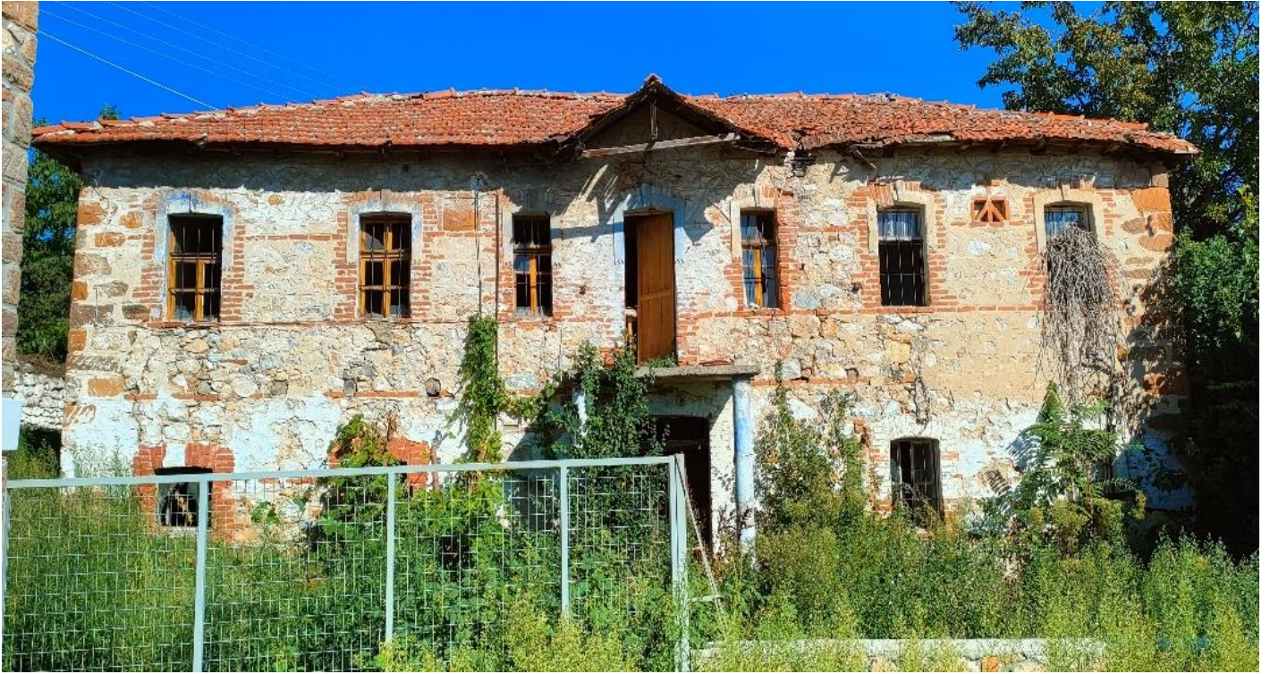
Εικόνα 14: Πρόσοψη οικίας Παπαφιλίππου .