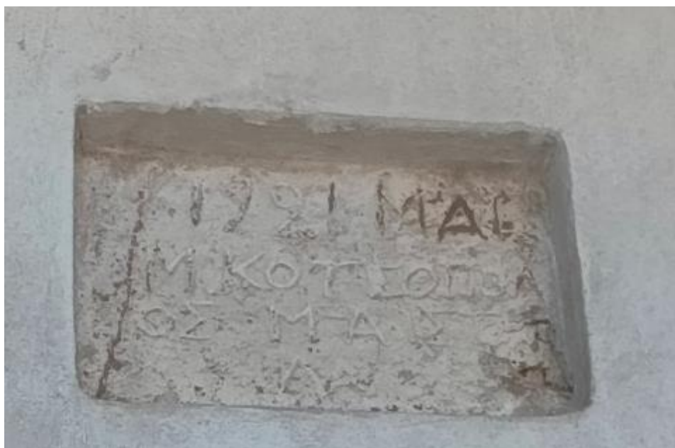
Εικόνα 4: Επιγραφή στο μέσον της πρόσοψης του κτιρίου.