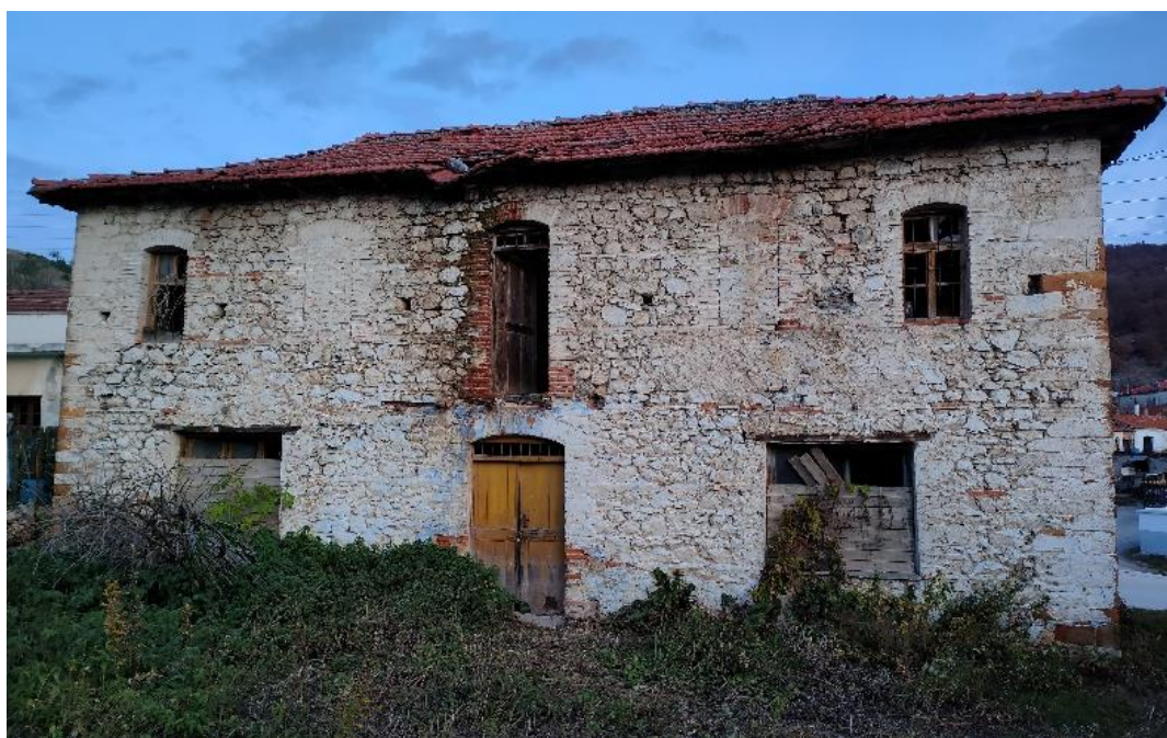
Εικόνα 8: Πρόσοψη κτιρίου.