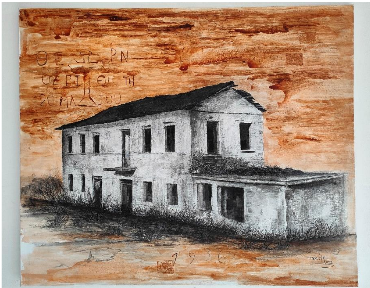
Εικόνα 21: Έργο μου οικίας Πρεκοπάνκεν/ 1,20 X 1,00 εκ./ μεικτή τεχνική.