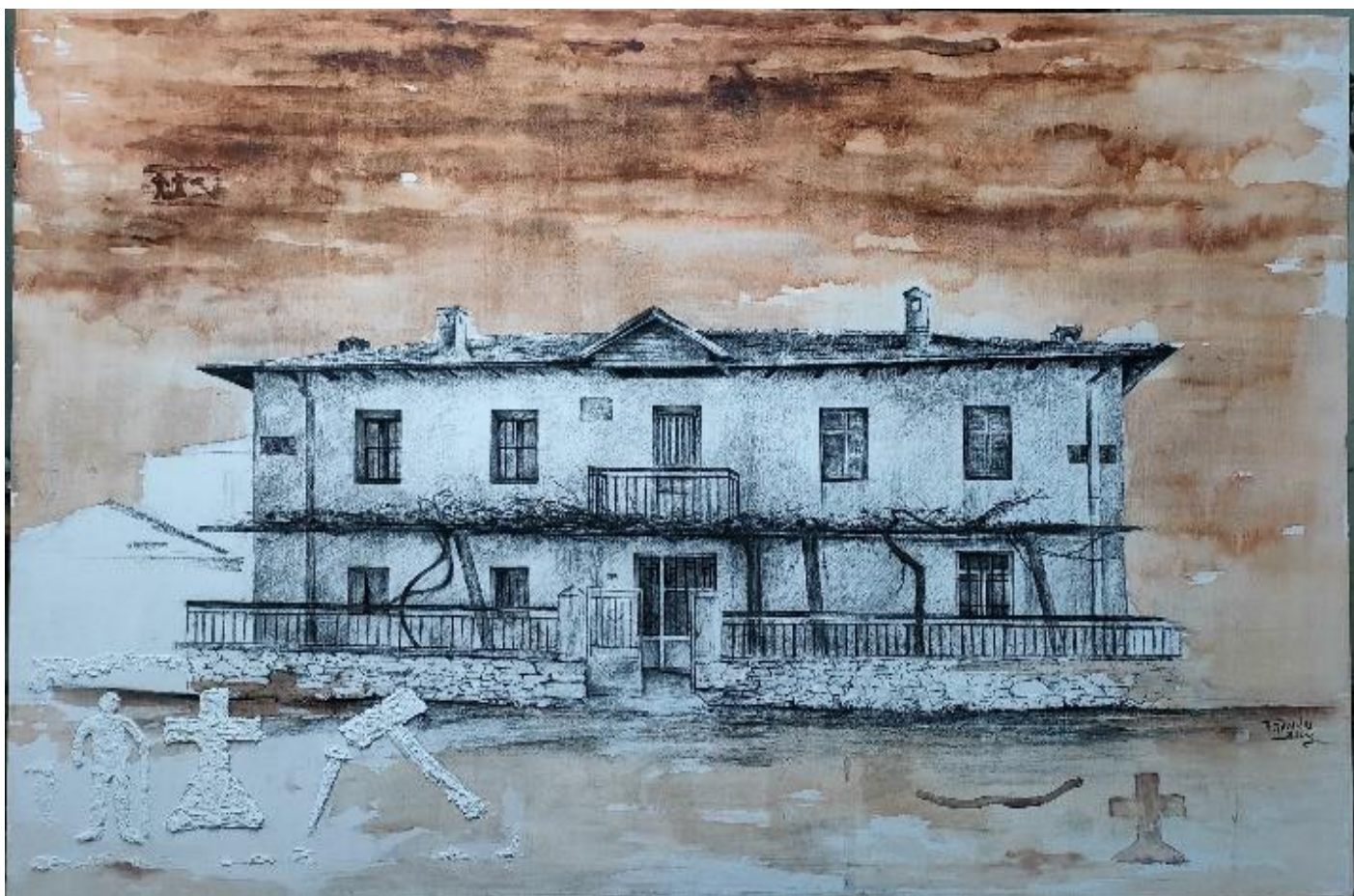
Εικόνα 5: Έργο μου οικίας Α. Κοτσοπούλου/ 1,37 X 1,10εκ./ μεικτή τεχνική