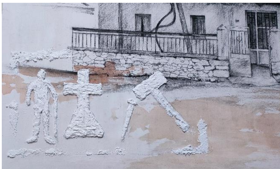
Εικόνα 6: Λεπτομέρεια έργου, δημιουργία ανάγλυφης επιγραφής μέσα στο έργο μου.