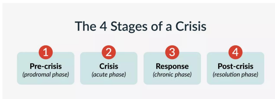
Εικόνα 1: Τα 4 στάδια της κρίσης

πολύπλοκη και άγνωστης διάρκειας. Καθώς η κρίση ξετυλίγεται σε πραγματικό χρόνο, οι συνθήκες μπορούν να αλλάξουν ριζικά, όπως και οι απαιτήσεις, οι ρόλοι και οι ευθύνες των διαφόρων ατόμων που εμπλέκονται. Οι ειδοποιήσεις θα αλλάξουν επίσης — τόσο όσον αφορά τις πληροφορίες που πρέπει να λάβει το κοινό όσο και τον τρόπο με τον οποίο πρέπει να τις λαμβάνουν. Αυτές οι ανάγκες υπαγορεύονται εν μέρει από το στάδιο στο οποίο βρίσκεται αυτή τη στιγμή η κρίση. Μια κρίση μπορεί να φαίνεται απρόβλεπτη, αλλά όλες ακολουθούν το ίδιο μοτίβο.