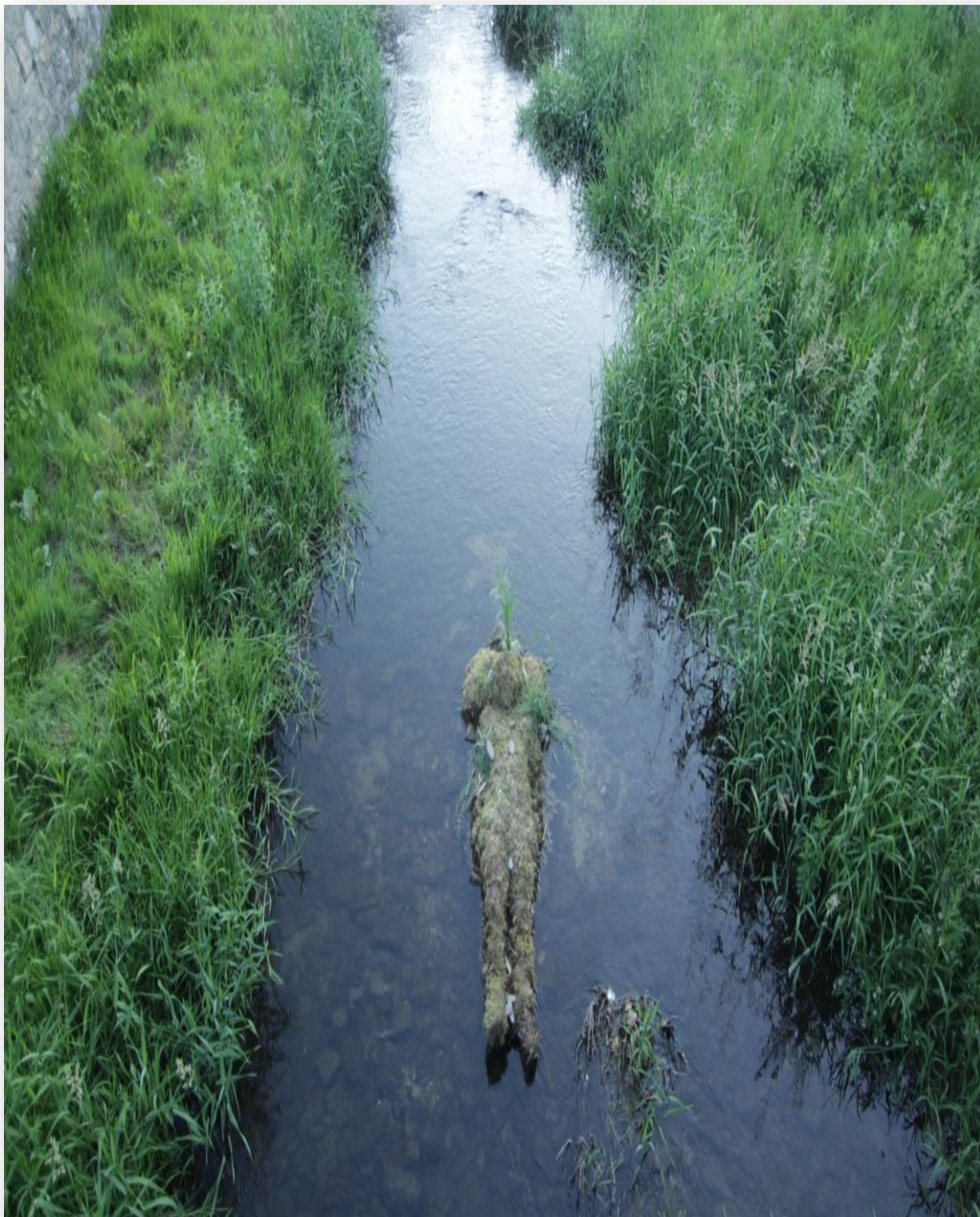
Φωτογραφία και εγκατάσταση: Μάγδα Χριστοπούλου, 2014