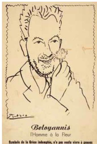
Εικ. 1 Pablo Picasso, Beloyannis, l, Homme a la Fleur

στην απόφαση του δικαστηρίου. Μάλιστα, ο Πικάσο άφησε εσκεμμένα το πορτρέτο ανοιχτό στη μια άκρη του, καθώς «έναν τόσο μεγάλο άνθρωπο δεν μπορείς να τον κλείσεις σε ένα πορτρέτο». 264