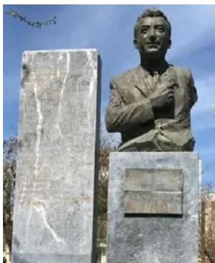
Εικ.4 Μνημείο Νίκου Μπελογιάννη, Αμαλιάδα

Αποτύπωση του Μπελογιάννη στην τέχνη αποτελεί και η ταινία του Νίκου Τζίμα «Ο άνθρωπος με το γαρούφαλλο».