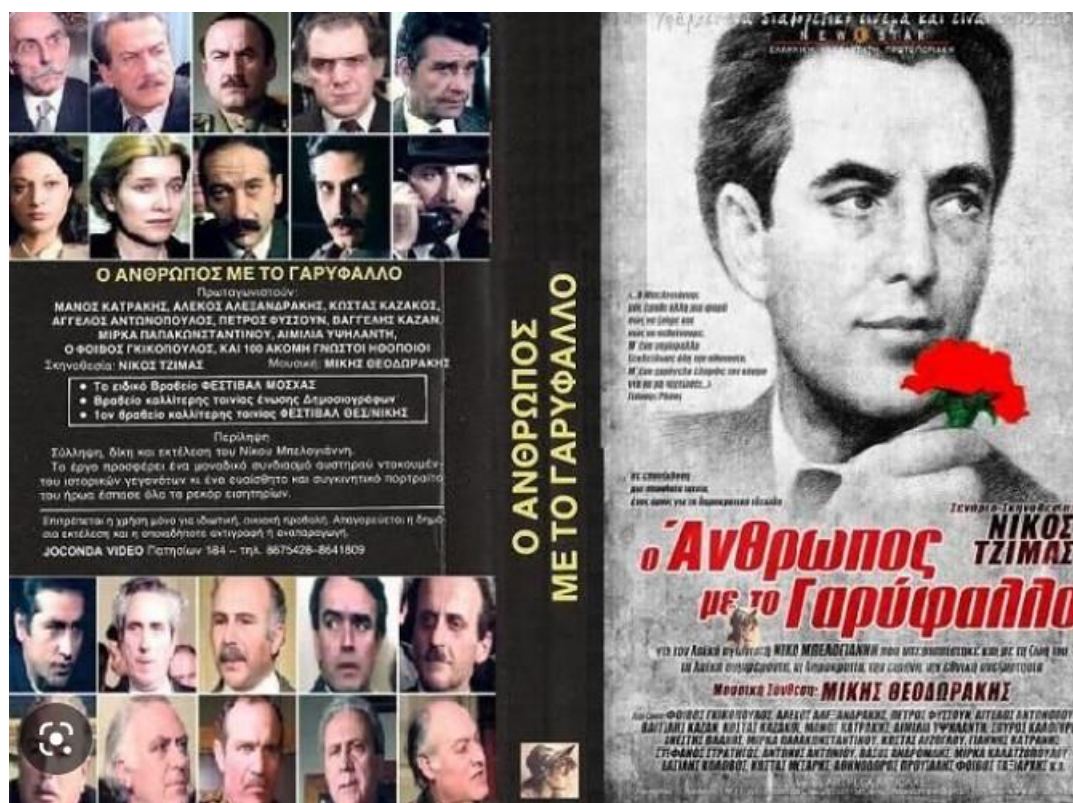
Εικ.5 Ο άνθρωπος με το Γαρύφαλλο, αφίσα ταινίας

γλιτώνουν η Έλλη Παππά λόγω του ανήλικου παιδιού της και ο Τάκης Λαζαρίδης λόγω του νεαρού της ηλικίας του. Ο Μπελογιάννης και άλλοι τρεις οδηγούνται στο εκτελεστικό απόσπασμα και εκτελούνται υπό το φως των προβολέων των καμιονιών. Η ταινία ολοκληρώνεται με τον λαό να ρίχνει κόκκινα γαρύφαλλα στους εκτελεσθέντες, ενώ στο φόντο παρουσιάζονται σκηνές, όπως η δολοφονία του Γρηγόρη Λαμπράκη, τα τανκς έξω από το Πολυτεχνείο και η διχοτόμηση της Κύπρου.