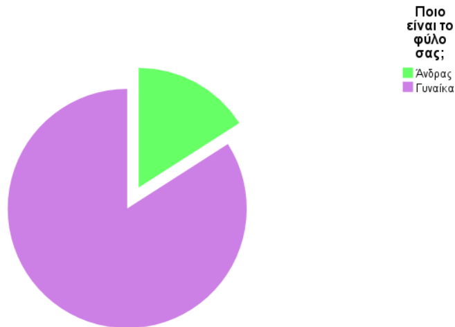
Γράφημα 1. Κυκλικό διάγραμμα των απαντήσεων των εκπαιδευτικών στη δήλωση σχετικά με το φύλο.

Σχετικά με την οικογενειακή τους κατάσταση, σύμφωνα με τα στοιχεία του πίνακα 2, το 37,7% των συμμετεχόντων είναι ανύπαντροι, 56,5 % είναι παντρεμένοι, 4,3% είναι διαζευγμένοι ενώ το 1,4% είναι χοίροι. Παράλληλα, παρατηρούμε ότι 24 εκπαιδευτικοί δεν έχουν κανένα παιδί, 14 έχουν ένα παιδί, 26 έχουν δύο παιδιά, 4 έχουν τρία παιδιά ενώ μόνος ένας εκπαιδευτικός έχει παραπάνω από τρία παιδιά. Όσον αφορά την ηλικία των παιδιών τους, 9 συμμετέχοντες απάντησαν πως έχουν παιδιά μέχρι 4 ετών, στις απαντήσεις “από 5 έως 9 ετών” και “από 15 έως 19 ετών” καταγράφηκε ισοβαθμία απαντήσεων και συγκεκριμένα 6 συμμετέχοντες σε κάθε περίπτωση, 7 εκπαιδευτικοί έχουν παιδιά ηλικίας από 10 έως 14 ετών ενώ οι περισσότεροι συμμετέχοντες, συγκεκριμένα 17, απάντησαν πως έχουν παιδιά ηλικίας άνω των 20 ετών.