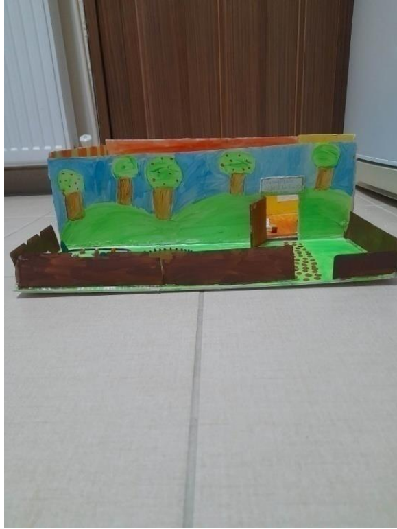
Εικόνα 4: Πρόσοψη νηπιαγωγείου