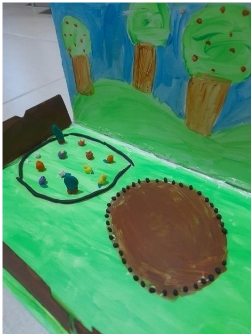
Εικόνα 9: Κήπος του νηπιαγωγείου