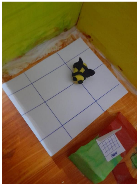
Εικόνα 11: Ρομποτική στην αίθουσα πληροφορικής