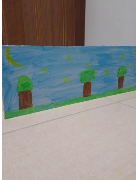
Εικόνα 6: Πίσω όψη νηπιαγωγείου