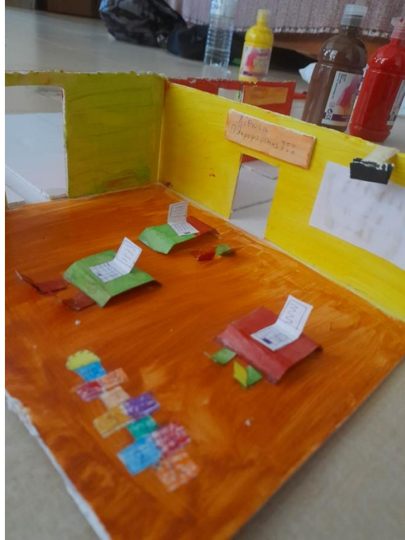
Εικόνα 10: Αίθουσα πληροφορικής