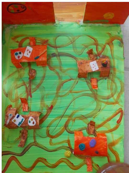
Εικόνα 17: Αίθουσα εικαστικών