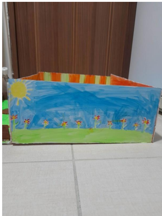
Εικόνα 7: Δεξιά όψη νηπιαγωγείου