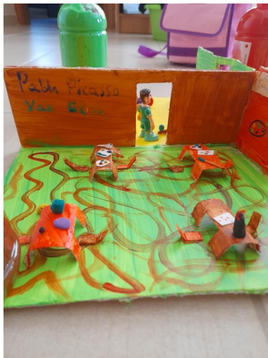
Εικόνα 16: Αίθουσα εικαστικών