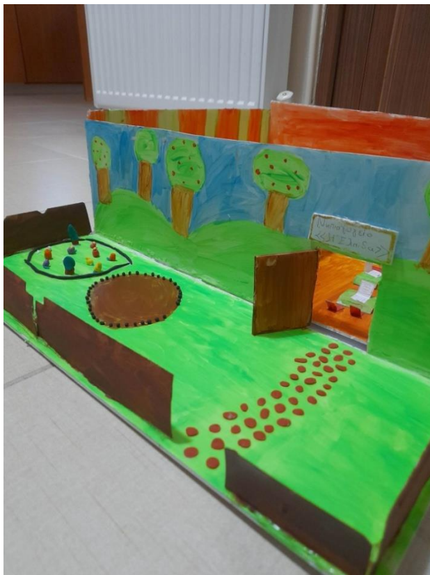
Εικόνα 8: Αυλή του νηπιαγωγείου