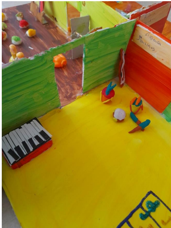
Εικόνα 14: Αίθουσα μουσικής