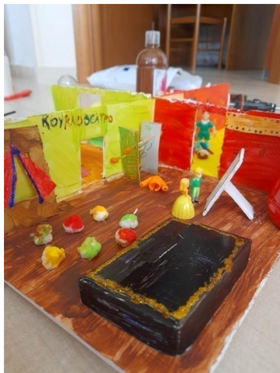
Εικόνα 12: Αίθουσα θεάτρου