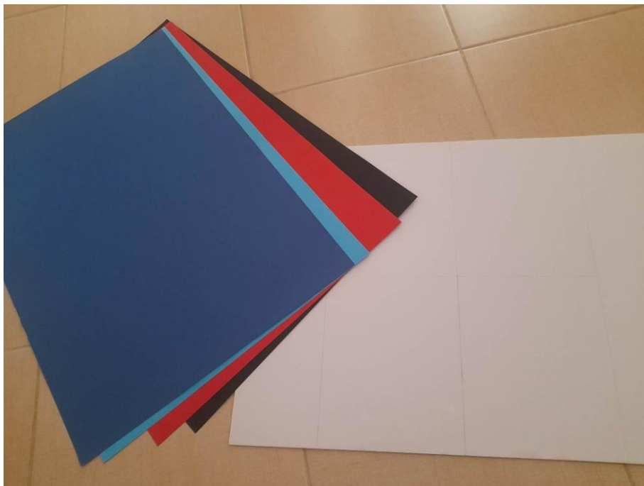
Εικόνα 1: Υλικά που χρησιμοποιήθηκαν για την κατασκευή του νηπιαγωγείου