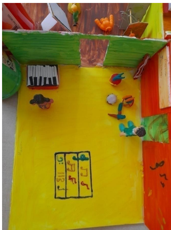
Εικόνα 13: Αίθουσα μουσικής