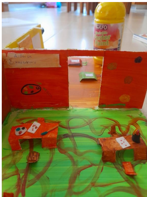
Εικόνα 15: Αίθουσα εικαστικών