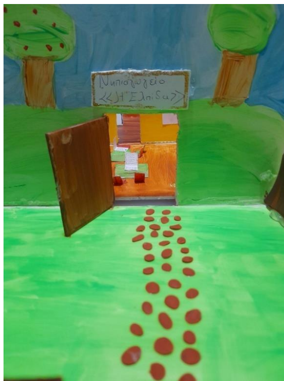
Εικόνα 3: Είσοδος νηπιαγωγείου