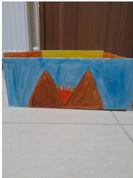
Εικόνα 5: Αριστερή πλευρά νηπιαγωγείου