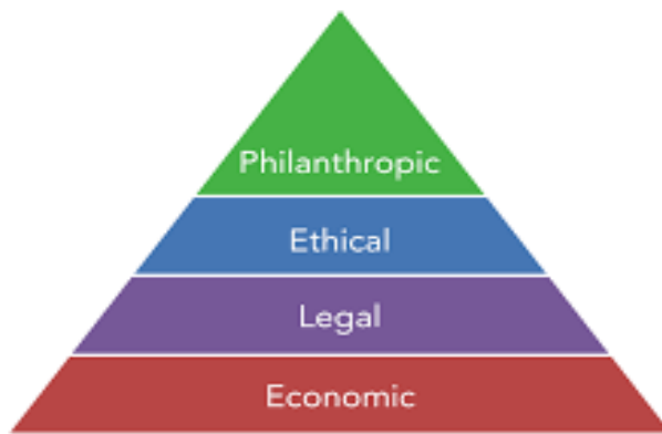
Carroll's CSR Pyramid