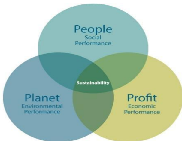
Εικόνα 2 Triple bottom Line 3P

Η θεωρία της τριπλής κατώτατης γραμμής, που έγινε γνωστή ως η θεωρία 3P (Profit-Planet-People/ Κέρδος, Πλανήτης, Άνθρωποι), διατυπώθηκε από τον Έλκινγκτον, στα μέσα της δεκαετίας του 1990. Όπως δηλώνει ο όρος, ένας οργανισμός λαμβάνει υπόψη το τρίπτυχο των παραγόντων, την οικονομική του ευημερία, την προστασία και διατήρηση του περιβάλλοντος, τον σεβασμό στον άνθρωπο (εργαζομένους, πελάτες, κοινωνικό σύνολο) (Elkington, J. 1997).