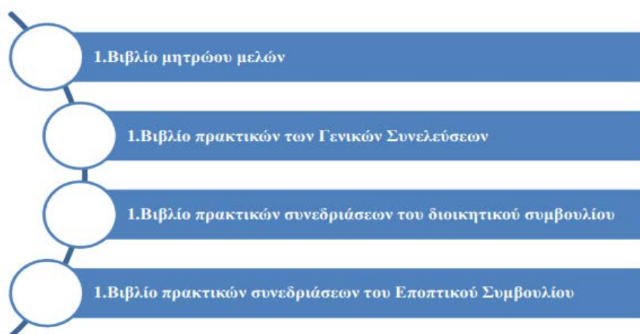
Εικόνα 3.1 : Τήρηση βιβλίων συνεταιρισμών (Παπαπάνου, 2019)

Σε ό,τι έχει να κάνει με την φορολόγηση, είναι καθοριστικό να τονιστεί πως κατά την ίδρυσή τους προβλέπονται σε ορισμένα περιστατικά ατέλειες είτε ακόμα και ελαττώσεις φόρων και τελών. Η φορολογία εισοδήματος επιβάλλεται στο γενικό καθαρό εισόδημα είτε ακόμα και στο κέρδος το οποίο είναι πιθανό να υπάρξει, πριν από τις χορηγούμενες εκπτώσεις στα μέλη τους (Φεφές, 2018).