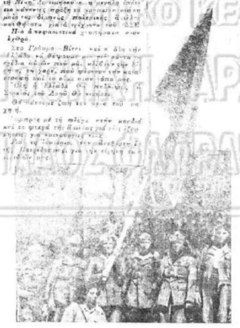
Εικόνα 6, Εξώφυλλο Μαχητρία