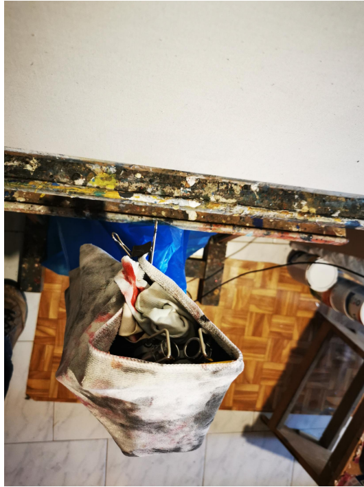
Εικ.2 (δεξιά) Μικρόφωνο στο κάτω μέρος του τελάρου καλυμμένο με πανί