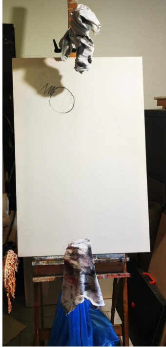
Εικ.1(αριστερά) Τελάρο με τα μικρόφωνα στο πάνω και κάτω μέρος καλημμένα με πανιά για να μη λερωθούν.