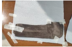
Εικόνα 28. Ορισμός σημείου κοπής υφάσματος