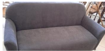
Εικόνα 40. Ολοκληρωμένη συναρμολόγηση

Αφού ολοκληρώθηκε το κάλυμμα, έπειτα από αρκετές δοκιμές και διορθώσεις πάνω στον σκελετό του καναπέ, έγινε η εφαρμογή του πάνω στα δύο μέρη (πλάτη, κάθισμα). Η διαδικασία ξεκίνησε πρώτα στο κάθισμα όπου, εφαρμόστηκε το κάλυμμα στην επάνω επιφάνεια καθώς και περιμετρικά στα πλαϊνά μέρη, το οποίο σταθεροποιήθηκε με τη χρήση κόλλας και συρραπτικού στην κάτω επιφάνεια (Εικόνα 37). Στη συνέχεια, εφαρμόστηκε το κάλυμμα στην πλάτη και στα μπράτσα με τον ίδιο τρόπο (Εικόνα 36). Έπειτα, ολοκληρώθηκε η συναρμολόγηση των δύο μερών του επίπλου με βίδες και τη χρήση ηλεκτρικού κατσαβιδιού (Εικόνα 40). Πιο συγκεκριμένα, τοποθετήθηκαν τέσσερις βίδες στην πλευρά που εφάπτεται το κάθισμα με την πλάτη και άλλες δύο στην κάθε πλευρά που εφάπτεται με τα μπράτσα (Εικόνα 38,39).