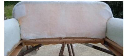
Εικόνα 24. Τοπ. Βάτας πλάτη