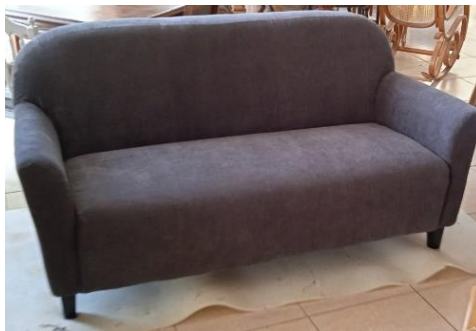
Εικόνα 45. Αναπαλαιωμένο έπιπλο