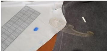
Εικόνα 30. Ορισμός σημείου ραφής