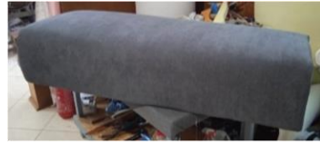
Εικόνα 37. Τοπ. καλύμματος