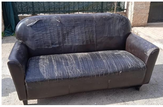
Εικόνα 5. Καναπές 2