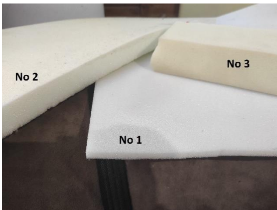
Εικόνα 25. Αφρολέξ No 1,2,3