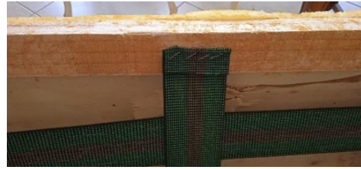
Εικόνα 18. Καρφωμένος ιμάντας

Μετά την αγορά των νέων υλικών (σούστες, ιμάντες, αφρολέξ κλπ.), τοποθετήθηκαν στο σύνολο εννέα σούστες και τρεις ιμάντες στο κάθισμα (Εικόνα 13). Στο κομμάτι της πλάτης, τοποθετήθηκαν συνολικά οκτώ ιμάντες (Εικόνα 16). Η διαδικασία ξεκίνησε με την τοποθέτηση των σουστών στο κάθισμα. Οι σούστες γαντζώθηκαν σε ειδικό κλίπ που είναι καρφωμένο στο σκελετό του καθίσματος με συρραπτικό (Εικόνα 17), και αμέσως μετά καρφώθηκαν επίσης με συρραπτικό οι ιμάντες που τοποθετήθηκαν οριζόντια στον σκελετό του καθίσματος και πλεχτά στις σούστες (Εικόνα 15). Στην πλάτη του καθίσματος τοποθετήθηκαν δύο διπλοί ιμάντες κάθετα καρφωμένοι με συρραπτικό (Εικόνα 18), και άλλοι τέσσερις οριζόντια καρφωμένοι στον σκελετό πλεχτά στους κάθετους (Εικόνα 16).