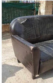
Εικόνα 3. Καναπές 2