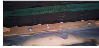
Εικόνα 38. Βίδες συναρμολόγησης