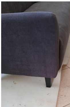
Εικόνα 44. Ξύλινο στήριγμα