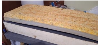
Εικόνα 20. Τοπ. Αφρολ 3 κάθισμα