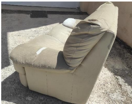
Εικόνα 2. Καναπές 1