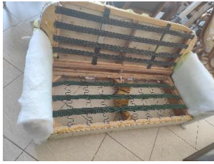
Εικόνα 13. Σκελετός με καινούριους ιμάντες