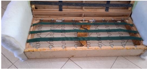
Εικόνα 15. Σκελετός με καινούριους ιμάντες