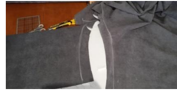
Εικόνα 29. Ορισμός σημείου ραφής