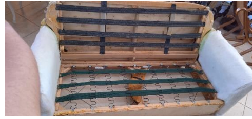
Εικόνα 14. Σκελετός με καινούριους ιμάντες