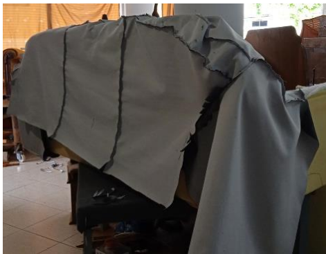
Εικόνα 35. Τελικό κάλυμμα

Αφού ολοκληρώθηκαν οι εργασίες στο σκελετό, έγινε κοπή του νέου υφάσματος σε διαφορετικές διαστάσεις βάσει του πατρών. Αναλυτικότερα, με οδηγό τα παλαιά κομμάτια ύφασμα που σταθεροποιήθηκαν επάνω στο νέο ύφασμα με χαρτοταινία (Εικόνα 27,28), ορίστηκαν τα σημεία που έπρεπε να κοπεί και να ραφεί το νέο ύφασμα (Εικόνα 29,30). Έπειτα, με τη βοήθεια ραπτομηχανής, έγινε η ραφή των κομματιών ένα προς ένα, στα σημεία που είχαν οριστεί (Εικόνα 31,32,33,34). Έτσι τελικά δημιουργήθηκαν τα δύο ξεχωριστά καλύμματα για την πλάτη και το κάθισμα. Αμέσως μετά την ραφή η διαδικασία προχώρησε με την δοκιμή του καλύμματος στα δύο κομμάτια του επίπλου με σκοπό να διορθωθούν ατέλειες και να διαπιστωθεί εάν εφάρμοζε σωστά στο σκελετό μετά τις αλλαγές των αφρολέξ (Εικόνα 35).