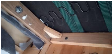
Εικόνα 39. Πλαϊνές βίδες συναρμολόγησης