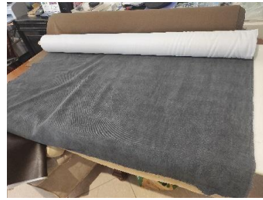
Εικόνα 8. Υφασμα τόπι 1