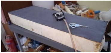
Εικόνα 19. Φόδρα καθίσματος