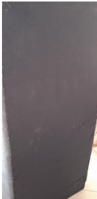
Εικόνα 41. Τοπ. φόδρα