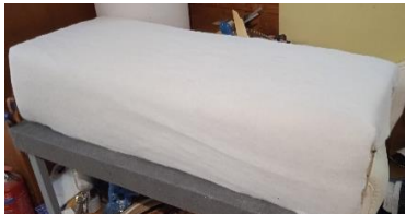
Εικόνα 22. Τοπ. Βάτας κάθισμα