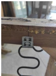
Εικόνα 17. Δέσιμο σούστας με σκελετό