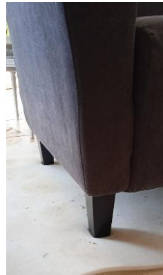
Εικόνα 43. Ξύλινο στήριγμα