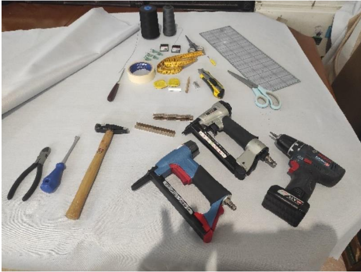
Εικόνα 6. Εργαλεία

Στην αρχή της υλοποίησης εργασιών αναπαλαίωσης συγκεντρώθηκαν τα απαραίτητα εργαλεία. Στην εικόνα 6. υπάρχουν τα βασικά εργαλεία που χρησιμοποιήθηκαν για τα επόμενα στάδια της διαδικασίας, τα οποία είναι: ηλεκτρικό τριπάνι, σφυρί, κατσαβίδι χειρός, χαρτοταινία, δύο διαφορετικά μεγέθη καρφωτικών εργαλείων - συρραπτικών, κοπίδι, ψαλίδια, κλωστές, χάρακες, μεζούρα 2m, κιμωλία, ειδική κόλλα και πλαγιόκοφτης. Επιπλέον χρησιμοποιήθηκε ραπτομηχανή για την δημιουργία του καλύμματος.