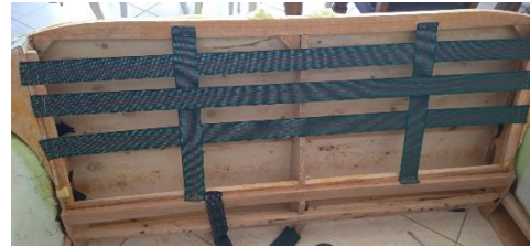
Εικόνα 16. Σκελετός με καινούριους ιμάντες