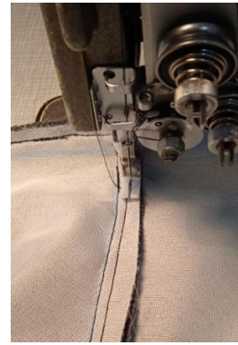
Εικόνα 34. Ραφή υφασμάτων