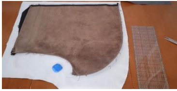
Εικόνα 27. Ορισμός σημείου κοπής υφάσματος