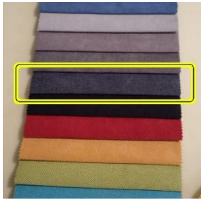
Εικόνα 7. Δειγματολόγιο υφασμάτων