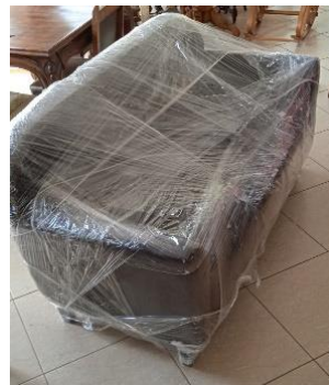
Εικόνα 46. Διαδικασία συσκευάσης επίπλου