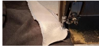
Εικόνα 31. Ραφή υφασμάτων