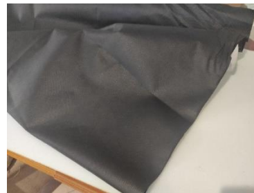
Εικόνα 10. Φόδρα

Σε αυτή τη φάση, αποσυναρμολογήθηκε ο καναπές σε δύο κομμάτια (πλάτη και κάθισμα), αφαιρέθηκαν τα ποδαράκια και μετρήθηκαν οι διαστάσεις του με μεζούρα, με σκοπό την παραγγελία του νέου υφάσματος και της φόδρας. Ανάμεσα σε διάφορες υφές και χρώματα, επιλέχθηκε μια σκούρα γκρι απόχρωση υφάσματος (Εικόνα 7) καθώς στον χώρο του εργαστηρίου όπου και θα παραμείνει το έπιπλο, μια πιο ανοιχτή απόχρωση θα αλλοιωνόταν λόγω ρύπων. Έπειτα ακολούθησε η παραγγελία υφάσματος δώδεκα μέτρων (Εικόνα 8,9) και φόδρας τεσσάρων μέτρων (Εικόνα 10).