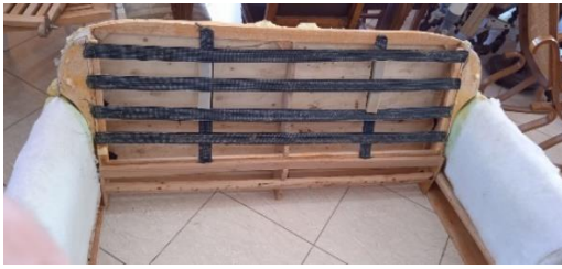
Εικόνα 11. Σκελετός με παλαιούς ιμάντες