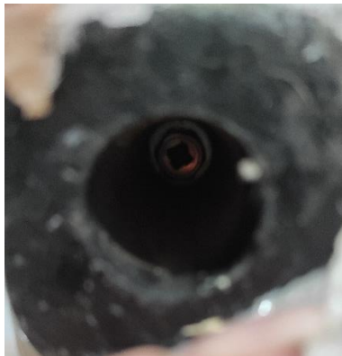
Εικόνα 42. Βίδα ξύλινου στηρίγματος