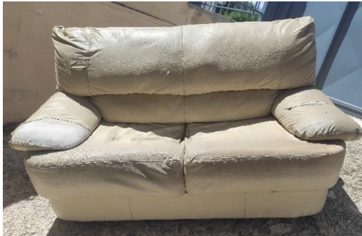
Εικόνα 1. Καναπές 1