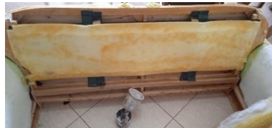
Εικόνα 23. Τοπ. Αφρολ 2 πλάτη