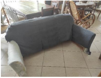
Εικόνα 36. Τοπ. καλύμματος