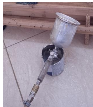
Εικόνα 26. Εργαλείο για συγκόλληση

Στη συνέχεια τοποθετήθηκαν, η φόδρα και τρία κομμάτια αφρολέξ διαφορετικού πάχους και πυκνότητας το καθένα, σε τρεις φάσεις (Εικόνα 25). Πιο συγκεκριμένα, πρώτα τοποθετήθηκε πάνω στο σκελετό με καρφωτικό εργαλείο η φόδρα (Εικόνα 19). Σε δεύτερη φάση συγκολλήθηκαν με ειδικό εργαλείο (εικόνα 26) σε στρώσεις τα αφρολέξ. Ξεκινώντας από το πιο παχύ και πυκνό (No 3) που κολλήθηκε πάνω στην φόδρα (Εικόνα 20), συνεχίζοντας στο λίγο πιο λεπτό (No 2) που κολλήθηκε αμέσως μετά (Εικόνα 21,23) και το ακόμα πιο λεπτό (No 1) που κολλήθηκε στο τέλος. Αμέσως μετά τα δύο κομμάτια (πλάτη, κάθισμα) ντύθηκαν με βάτα πολυεστερική. (Εικόνα 22,24) Σε αυτή τη φάση έχουν τελειώσει οι απαραίτητες εργασίες στο σκελετό και το έπιπλο είναι έτοιμο για την τοποθέτηση του καλύμματος.