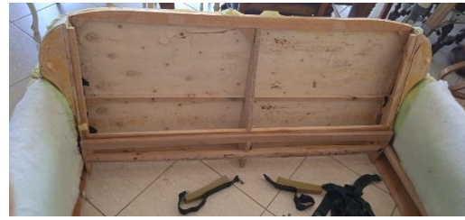
Εικόνα 12. Σκελετός χωρίς ιμάντες

Έπειτα από την επιλογή και παραγγελία του υφάσματος, η διαδικασία προχώρησε με την προσεκτική αφαίρεση του παλαιού υφάσματος και της φόδρας, τα οποία κρατήθηκαν ως πατρόν. Πιο συγκεκριμένα αφαιρέθηκαν από την βάση του καναπέ τα παλαιά καρφωμένα συρραπτικά που συγκρατούσαν την φόδρα στο κάτω μέρος, η οποία και απομακρύνθηκε. Στη συνέχεια αφαιρέθηκαν τα συρραπτικά που συγκρατούσαν το κάλυμμα, κόπηκαν τα σημεία ένωσης με ψαλίδι και αφαιρέθηκε το ύφασμα σε κομμάτια. Επιπλέον, αφαιρέθηκαν οι παλιές σούστες, οι ιμάντες καθώς και τα αφρολέξ του καθίσματος και της πλάτης.