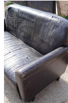
Εικόνα 4. Καναπές 2