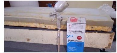
Εικόνα 21. Τοπ. Αφρολ 2 κάθισμα