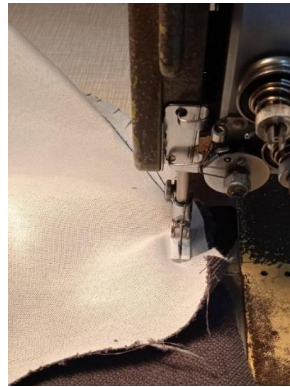
Εικόνα 33. Ραφή υφασμάτων