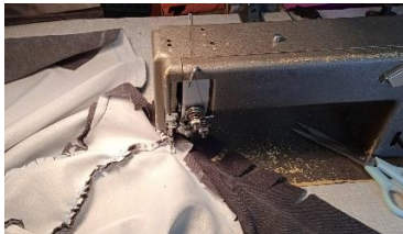
Εικόνα 32. Ραφή υφασμάτων