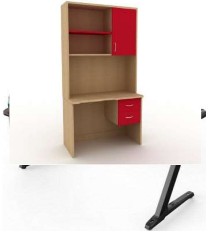
( Εικ.2.34 Παιδικό Γραφείο, Πηγή [137] )