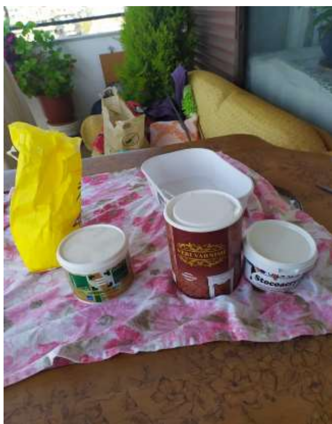
( Εικ.3.3 Υλικά για δημιουργία υφής )

Ξεκίνησα καθαρίζοντάς τον από τις σκόνες του χρησιμοποιώντας ένα κοινό πανί ξεσκονίσματος και ειδικό σπρέυ για την ίδια δουλειά. Αφού καθαρίστηκε λοιπόν αποφάσισα πως ήταν η ώρα να του δώσω το ψυχρό στυλ που αναφέρεται και στην περίληψη. Και τι θυμίζει περισσότερο Σκανδιναβία και Νορβηγική Μυθολογία απότι οι λευκοί από το χιόνι κορμοί δέντρων στα παγωμένα βόρεια δάση. Θυμήθηκα κάτι που είχα δει σε ένα παλιό βίντεο κάπου στο διαδίκτυο ότι μπορείς εύκολα να δημιουργήσεις υφή κορμού δέντρου πάνω σε σχεδόν οποιαδήποτε επιφάνεια χρησιμοποιώντας νισεστέ, μια αμυλούχες ουσία σαν αλεύρι το οποίο συνήθως χρησιμοποιείται για κρέμες, ξυλόκολα, βερνίκι και υγρό στόκο. Την ξυλόκολλα και τον υγρό στόκο τα χρειαζόμαστε για να γίνει στυβαρή η αίσθηση που θέλουμε να πετύχουμε ώστε να μην “γρατζουνιέται” τόσο εύκολα αλλά και να είναι πιο εύκολη στην βαφή της.