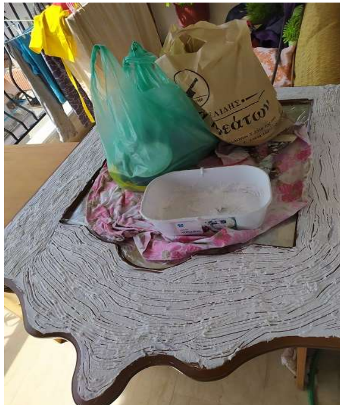
( Εικ.3.10 Ολοκλήρωση υφής )

Μέχρι που εν τέλει μετά από κάποιες ώρες ήταν σπατουλαρισμένος ο καθρέφτης και οι ιδιαιτερότητες του κορμού έτοιμες.