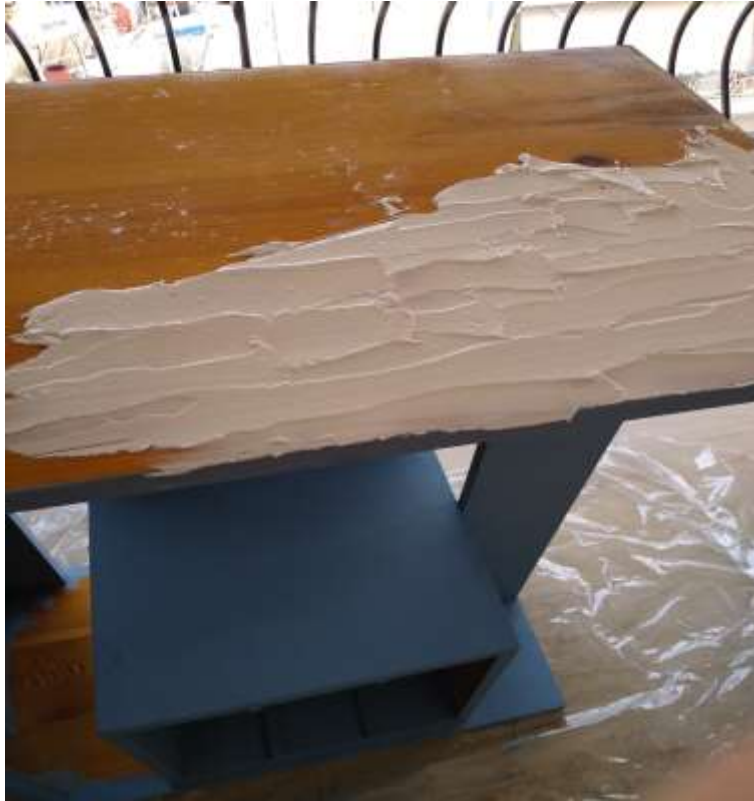
( Εικ.3.31 Εφαρμογή υφής στην επιφάνεια )

δώσουν μια πολυ ωραία εικόνα στο μάτι του χρήστη του. Συγκεκριμένα το μυαλό μου σκέφτηκε πως θα είναι σαν να βρίσκεσαι ανάμεσα σε δυο δέντρα και να εργάζεσαι πάνω σε ένα γραφείο φτιαγμένο από το ίδιο το δάσος.