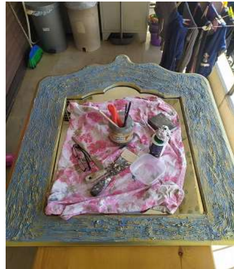
( Αφού στεγνώσε ) ( Εικ.3.21 )

Έτσι λοιπόν αντίκρισα την πρώτη μου κατασκευή μετά από μέρες δουλειάς να είναι έτοιμη αφού της πέρασα και δύο χέρια βερνίκι για να μην φεύγει το χρώμα. Επειδή βγήκε και πολύ ωραίο το τελικό σχέδιο την βάλαμε μέσα στο σπίτι μέχρι να έρθει η ώρα να την παρουσιάσω στο Πανεπιστήμιο.