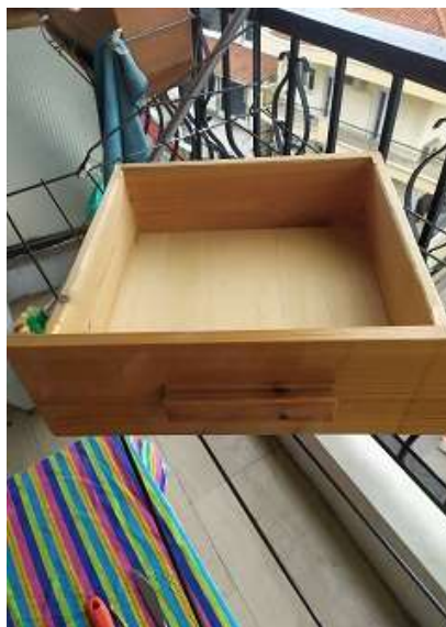
( Εικ.3.34 Αρχική μορφή συρταριού )

Με την ολοκλήρωση του βασικού επίπλου συνέχισα με την επεξεργασία των συρταριών καθώς είναι να τοποθετηθούν και αυτά στο μέλλον ώστε να έχει ολοκληρωμένη όψη και χρήσεις το έπιπλο. Για αυτο λοιπόν τα τρία ράφια που είχα αφαιρέσει στην αρχή ξεκίνησα την διαδικασία ώστε να τα κάνω όπως τον καθρέφτη και το γραφείο.