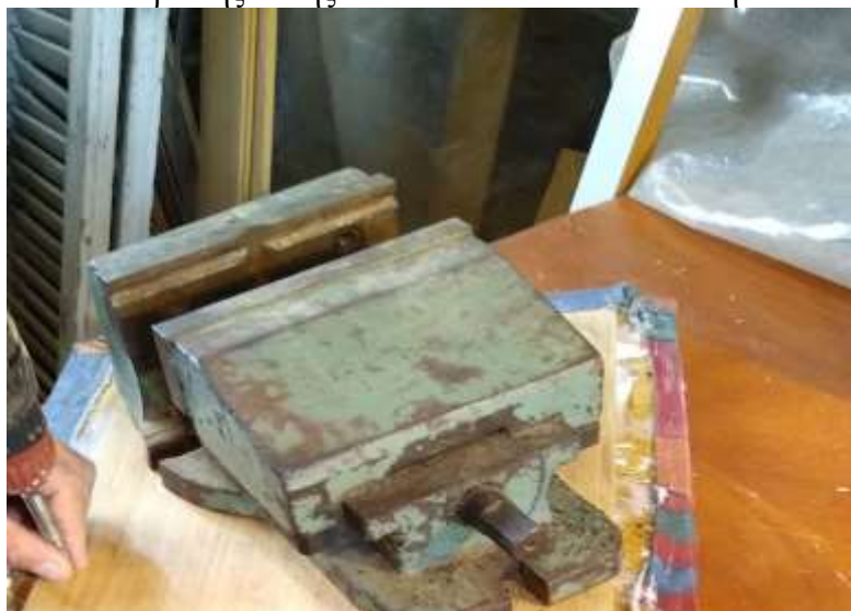
( Εικ.3.42 Διόρθωση θέσης και εφαρμογή βιδών )

Έπειτα προκειμένου να ενισχυθεί ακόμα περισσότερο για σιγουριά, μιας που δεν είναι σίγουρο ότι σε μια καρέκλα κάθονται μόνο ελαφριοί άνθρωποι, την ενίσχυσα ακόμα περισσότερο βιδώνοντας κάποιες βίδες στην κάτω πλευρά της θέσης ώστε να είναι πιο ανθεκτική.