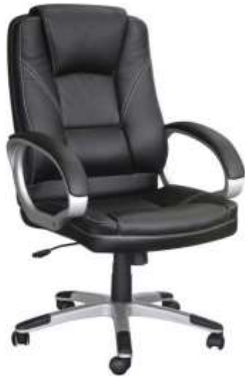
( Εικ.2.11 Καρέκλα διευθυντή )