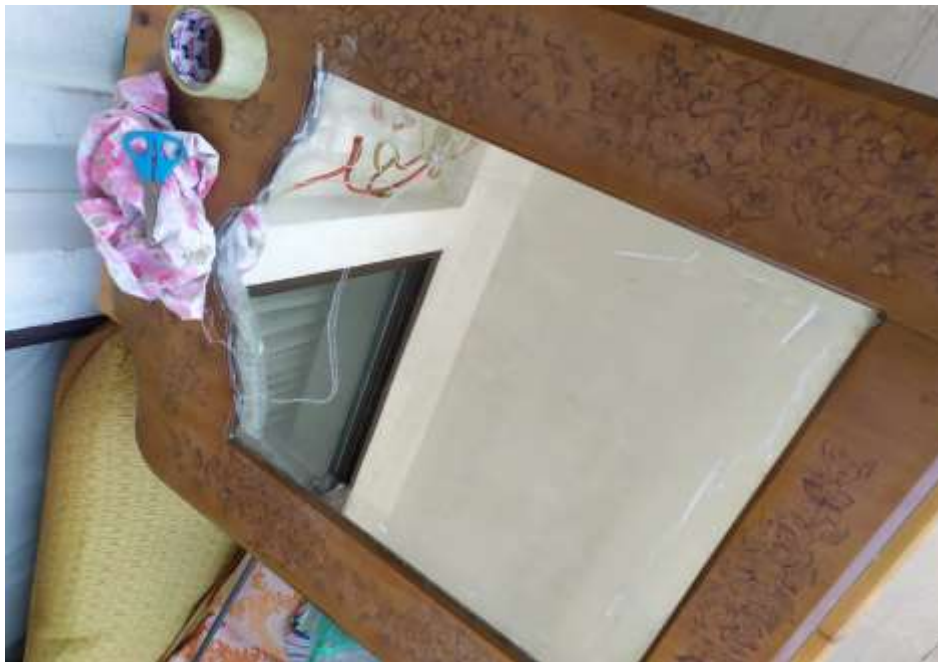
( Εικ.3.5 Προστασία Καθρέφτη )

Αφού συνέβει και αυτό το μείγμα ήταν έτοιμο να αρχίσει σιγά σιγά με την τεχνική του σπατουλαρίσματος να τοποθετείται πάνω στον καθρέφτη.