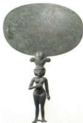
( Εικ.2.1β Καθρέφτης Ιθαγενών, Πηγή [101] )