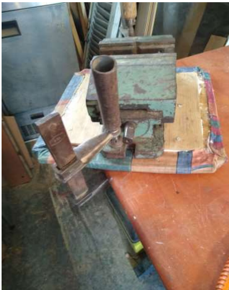
( Εικ.3.41 Πρέσσα για διόρθωση θέσης )

Το γεγονός πως η θέση ήταν σπασμένη από κάτω με βοήθησε στο να δουλέψω με πατέντα στην αναπαλαίωση της καρέκλας καθώς δεν θα φαινόταν με την πρώτη ματιά μιας που βρίσκεται από την κάτω πλευρά. Έτσι τοποθέτησα ξυλόκολλα πάνω της και τοποθέτησα ένα πλακέ ξύλο πάνω ώστε να την ενισχύσω και την τοποθέτησα σε μέγγενη ώστε να σφιχτεί πάνω της και να κολλήσει καλά το ένα ξύλο με το άλλο.