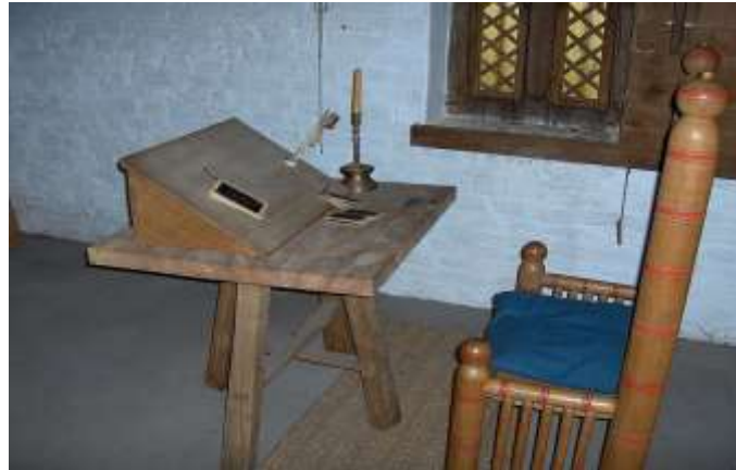
( Εικ.2.21 Γραφείο γραφής και ανάγνωσης Μεσαίωνα, Πηγή [124] )

Πριν την εφεύρεση του πιεστηρίου των 15ο αιώνα μ.Χ. Όλοι όσοι διάβαζαν βιβλία κατά πάσα πιθανότητα ήταν επίσης και συγγραφείς και εκδότες η και τα δύο καθώς την τότε εποχή όλα τα βιβλία και τα αρχεία έπρεπε τακτικά να αντιγράφονται σε νέες σελίδες ώστε να μην φθαρούν και σε βάθος χρόνου εξαφανιστούν. Για αυτόν τον λόγο πολλά γραφεία σχεδιάζονταν με ειδικές βάσεις και γάντζους για τα τοποθετούνται τα βιβλία [9].