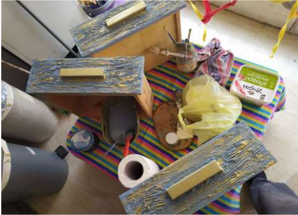
( Εικ.3.37 Συρτάρια ολοκληρωμένου χρωματισμού )