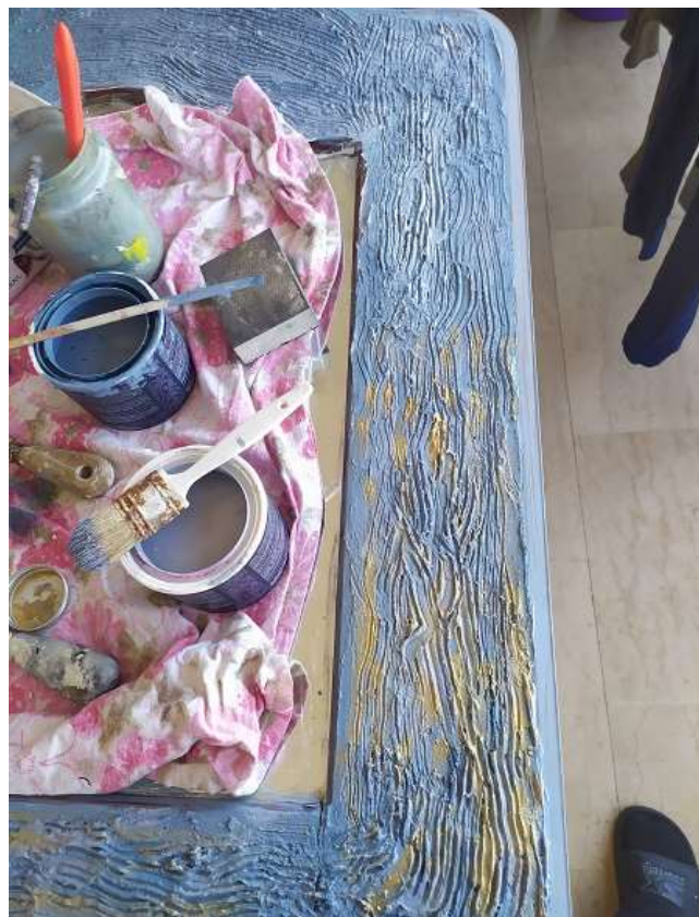
( Εικ.3.19 Χρυσές πινελιές όγη )