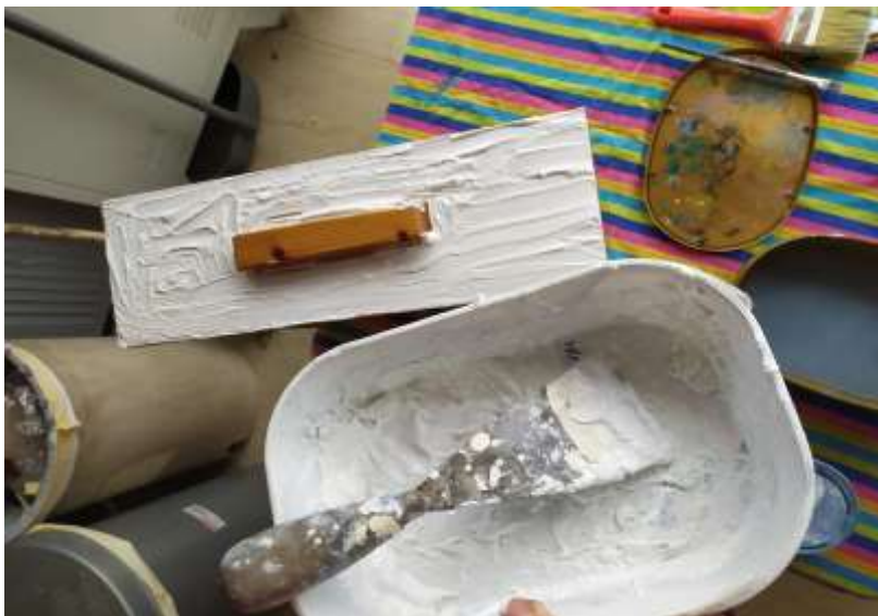
( Εικ.3.35 Δημιουργία μείγματος για συρτάρια )

Ξαναδημιούργησα λοιπόν το μείγμα και το πέρασα σε όλες τις εξωτερικές επιφάνειες του συρταριού ώστε να περαστεί μέσα πάνω και το χρώμα.