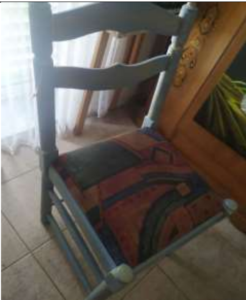
( Εικ.3.43 Καρέκλα ολοκληρωμένη )

Συνεπώς ξεκίνησα το βάψιμό της μόνο με το βόρειο ψυχρό θέμα που έχουν γίνει ως τώρα και τα άλλα δύο έπιπλα. Έβαψα πρώτα όλα της τα σημεία με το γαλάζιο χρώμα προσεκτικά ώστε να μην στάξει πάνω στην θέση χρώμα και χαλάσει η όψη της, και στην συνέχεια αφού βάφτηκαν όλα της τα σημεία από 2 χέρια το άφησα να στεγνώσει. Με το που στέγνωσε πέρασα τις χρυσές πινελιές αντίθεσης και πάλι σε διάφορα σημεία της καρέκλας με ένα μικρό πινέλο και το τελικό αποτέλεσμα ήταν το εξής.