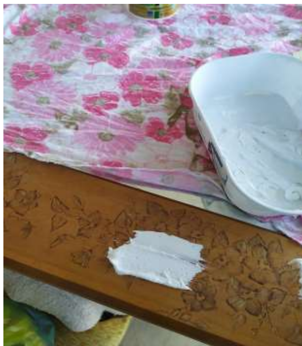
( Εικ.3.6 Πρώτη εφαρμογή μείγματος στον καθρέφτη ) Αυτή είναι η μορφή της ουσίας μεμονομένη.