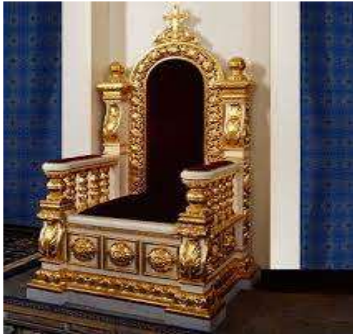
( Εικ.2.14 Θρόνος Βασιλιά, Πηγή [118] )