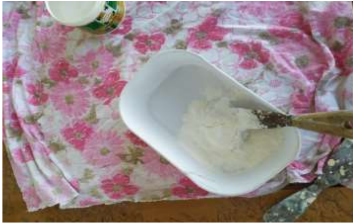
( Εικ.3.4 Μείγμα αλευρώδες με ξυλόκολλα )

Επειδή όμως δεν έγινε αμέσως αυτό που ήθελα πρόσθεσα στόκο και ξυλόκολλα μέχρι να πάρει μια πιο υγρή μορφή το μείγμα.