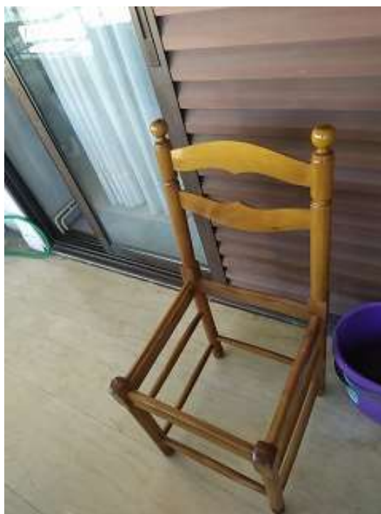
( Εικ.3.39 Αρχική Μορφή καρέκλας )

Η καρέκλα η οποία βρέθηκε στο σπίτι της γιαγιάς μου ήταν λίγο πιο περίπλοκη από ότι το γραφείο και ο καθρέφτης καθώς ήταν σπασμένη η θέση της και το ξύλο είχε φαγωθεί σε πάρα πολλά σημεία. Αυτό βέβαια δεν ήταν σοβαρό εμπόδιο καθώς είχα τα απαραίτητα υλικά και γνώσεις ώστε να διορθώσω και τα δύο προβλήματα που είχαν προκύψει.