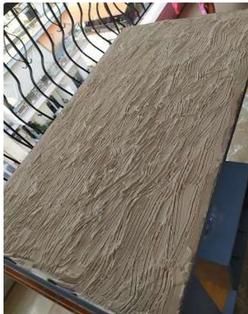
( Εικ.3.32 Εφαρμογή υφής στο πλάι )

Έπειτα το έβαγα με την μπλε απόχρωση και σχημάτισα τα ίδια χρυσά στοιχεία όπως συνήθως.