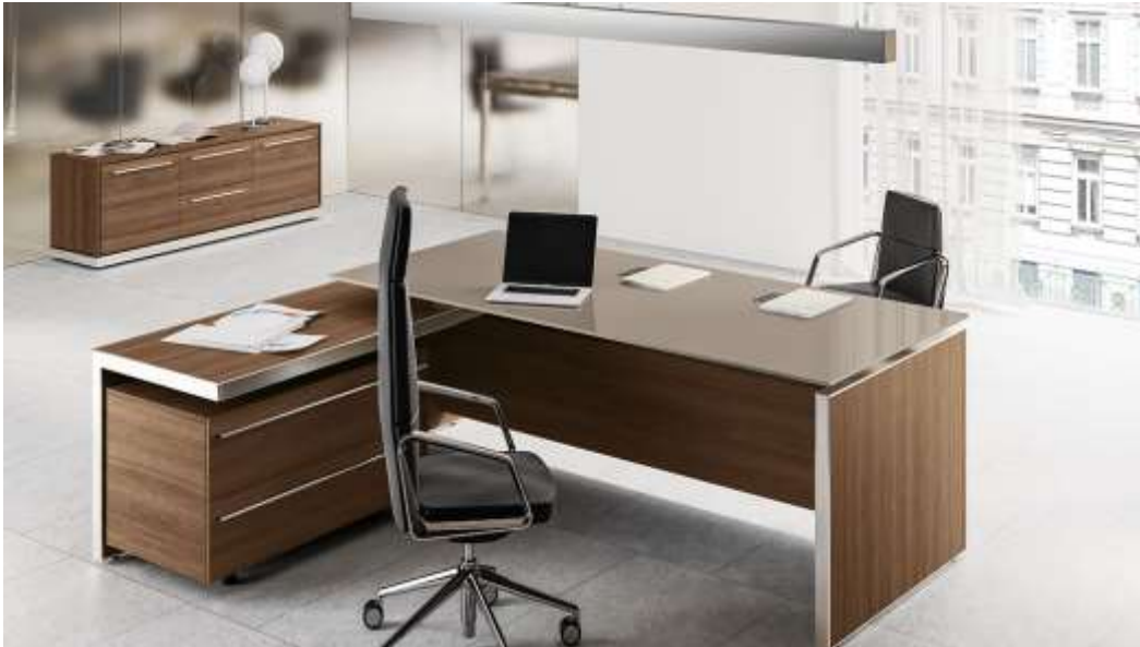
( Εικ.2.37 Γραφείο επιχείρησης )