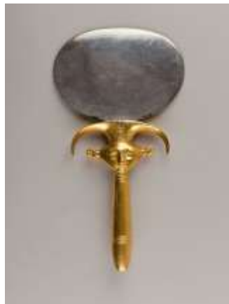
( Εικ.2.1α Καθρέφτης ανατολιτών, πηγή [100] )

Παρόλα αυτά οι άνθρωποι από όλα τα μέρη της Γης χρησιμοποιούσαν και άλλους τρόπους καθρεπτισμού πολλά χρόνια πριν την ανακάλυψη της εν λόγω επικάλυψης. Συγκεκριμένα στην αρχαία Ανατολία, πριν 8.000 χρόνια, χρησιμοποιούσαν ένα ηφαιστειακό πέτρωμα το οποίο το γυάλιζαν ώστε να αντανακλά ότι φαινόταν πάνω στο συγκεκριμένο πέτρωμα, το όνομα του ήταν οψιδιανός, την παραπάνω τεχνολογία ακολούθησαν με μια χρονική καθυστέρηση 1000-2000 χρόνων οι Μεσοποτάμιοι και οι Αιγύπτιοι όπου αντικατέστησαν την χρήση οψιδιανού με χαλκό.