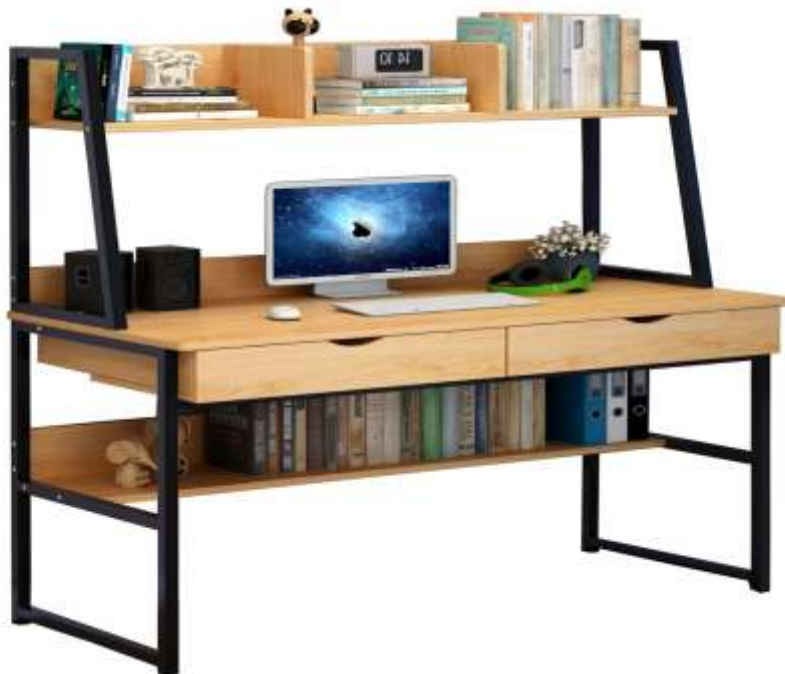
( Εικ.2.32 Μοντέρνο εύχρηστο γραφείο )

Επίσης σήμερα τα γραφεία είναι αναρίθμητα διαφορετικά στυλ ανάλογα με την λειτουργία τους, την τοποθεσία τους, την χώρα προέλευσης και ένα σωρό άλλοι λόγοι ώστε να σχεδιαστεί διαφορετικά το κάθε γραφείο. Από gaming γραφεία μέχρι γραφεία εκκλησιών και από γραφεία επιχειρήσεων μέχρι παιδικά γραφεία, όλα είναι εξίσου διαδεδομένα και εξίσου σημαντικά για την κοινωνία του 21ου αιώνα.