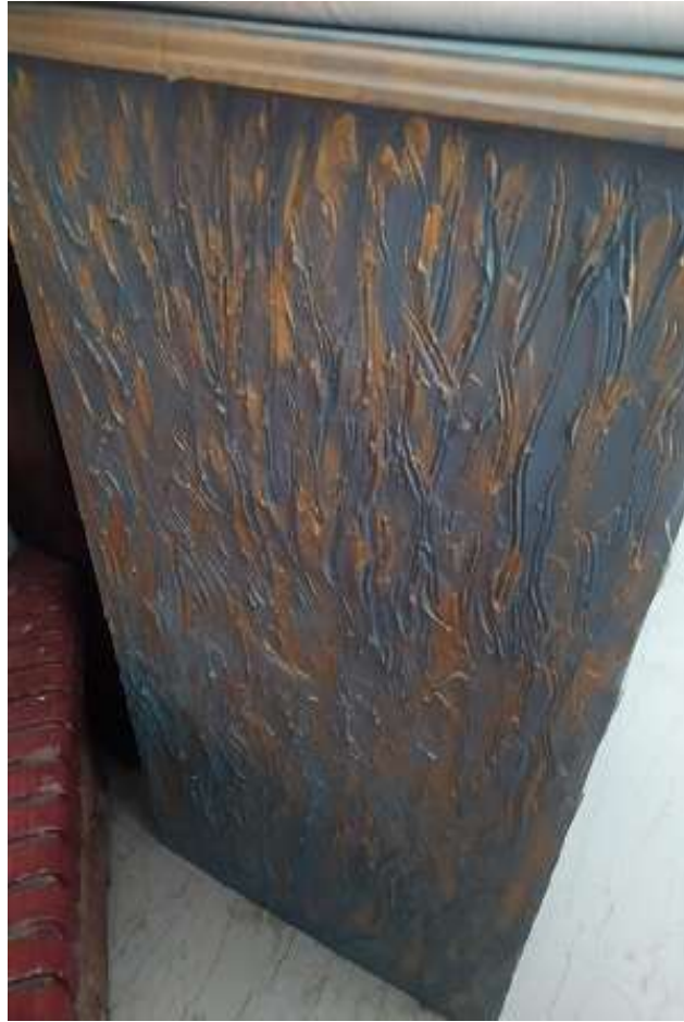
( Εικ.3.33 Ολοκλήρωση χρωματισμου και υφής στο πλάι )

Με την ολοκλήρωση του βασικού επίπλου συνέχισα με την επεξεργασία των συρταριών καθώς είναι να τοποθετηθούν και αυτά στο μέλλον ώστε να έχει ολοκληρωμένη όψη και χρήσεις το έπιπλο. Για αυτο λοιπόν τα τρία ράφια που είχα αφαιρέσει στην αρχή ξεκίνησα την διαδικασία ώστε να τα κάνω όπως τον καθρέφτη και το γραφείο.