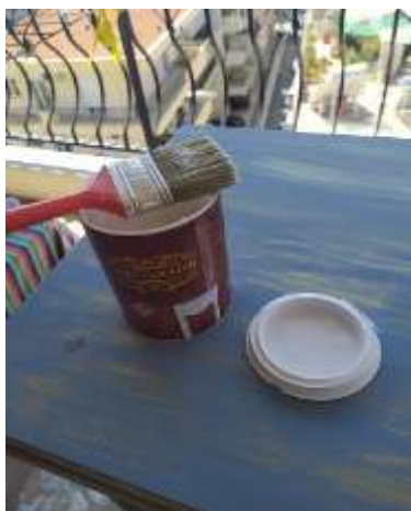
( Εικ.3.29 Βερνίκι )

Με το τέλος της εργασίας άφησα για κάποιες ώρες το μπλε χρώμα να στεγνώσει και όπως με τον καθρέφτη, έδωσα τις ίδιες χρυσές λεπτομέρειες με πιο λεπτεπίλεπτες κινήσεις για να δημιουργηθεί αντίθεση. Τέλος με το στέγνωμα και του χρυσού χρώματος πέρασα το βερνίκι πάνω στις βαμμένες επιφάνειες ώστε να μην φεύγει το χρώμα με την πάροδο του χρόνου.