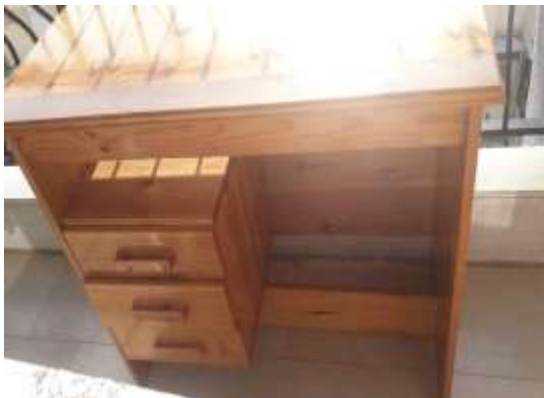
( Πριν το πλύσιμο ) ( Εικ.3.24 )