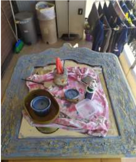
( Πριν στεγνώσει και το χρυσό ) ( Εικ.3.20 )