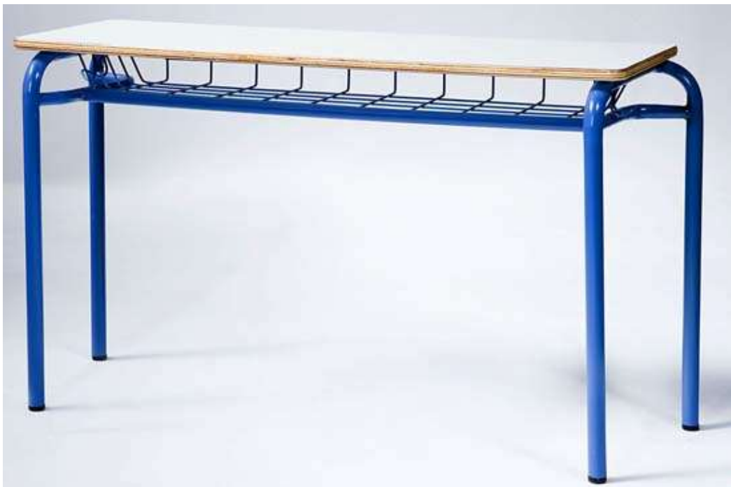
( Εικ.2.36 Θρανίο Σχολείου, Πηγή [140] )