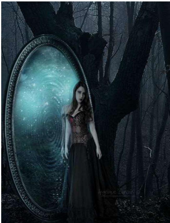
( Εικ.2.1ζ Απεικόνιση της σύνδεσης των δύο κόσμων )

Μια τελευταία δεισιδαιμονία αναφέρει πώς οι καθρέφτες δεν πρέπει ποτέ να βρίσκονται μέσα στο υπνοδωμάτιο καθώς απασχολούν το μυαλό μας μες την νύχτα και δεν αφήνουν το πνεύμα και το σώμα μας να ηρεμήσουν κατά την διάρκεια του ύπνου. Επιπλέον στην είσοδο του σπιτιού ή των χώρων εργασίας συνίσταται η χρήση μικρών και στρόγγυλων καθρεφτών οι οποίοι βρίσκονται μέσα σε οκταγωνικό πλαίσιο που το στολίζουν οχτώ γράμματα, κάτι το οποίο φέρνει τύχη. Αυτή είναι και η θεωρία του φενγκ σουί [4].