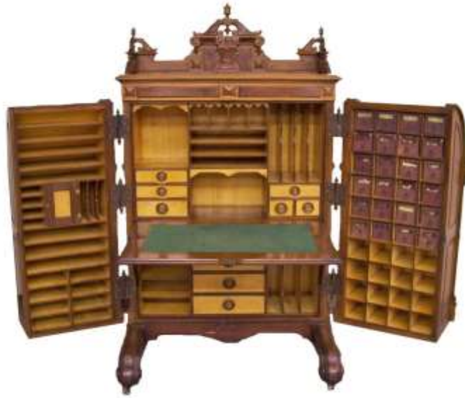
( Εικ.2.27 Γραφείο της ελίτ, Πηγή [130] )

Η ανάπτυξη της χαρτοποιίας οδήγησε στο σχεδιασμό πιο στυλάτων γραφείων μαζικής παραγωγής καθώς και οι ανάγκες για ομορφιά στις κατώτερες τάξεις αναπτύχθηκε. Αυτό οδήγησε στην δημιουργία των κυκλικών και των γραφείων με ράφια.