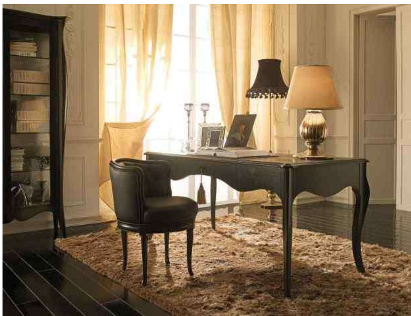
( Εικ.2.30 Σημερινό γραφείο )