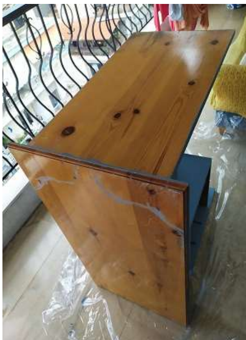
( Εικ.3.26 Ολοκλήρωση χρωματισμού κάτω πλευράς )

καθρέφτη. Με τα ίδια πινέλα και τον ίδιο τρόπο σπασίματος του χρώματος με νερό ξεκίνησα να βάφω το γραφείο.