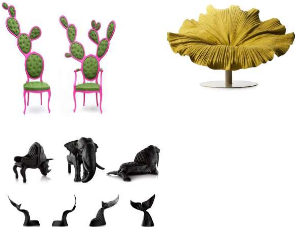
( Εικ.2.16, Εικ.2.17, Εικ.2.18 Καρέκλες έργα τέχνης, Πηγή [120] )