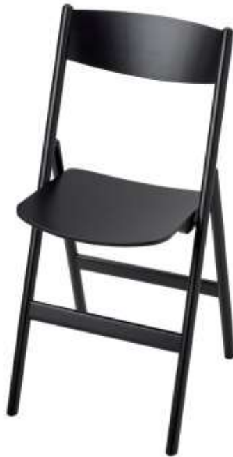
( Εικ.2.8 Μεταλλική αναδιπλούμενη καρέκλα, Πηγή [113] )