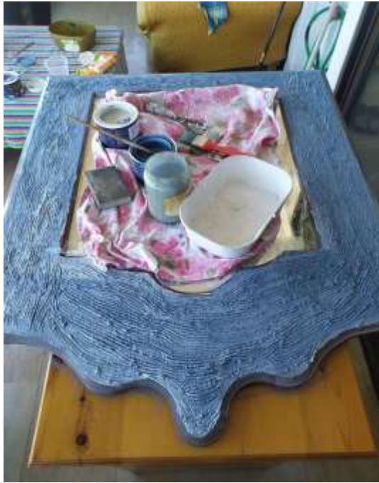
( Εικ.3.16 Ολοκλήρωση εφαρμογής δεύτερου χρώματος )

Η εικόνα που αντίκρισα μετά το βάψιμο μου άρεσε πάρα πολύ και υποσχόταν πολλά για την συνέχεια της δουλειάς. Άφησα λοιπόν την μπογιά για ένα βράδυ στο μπαλκόνι ώστε να στεγνώσει καλά πάνω στον καθρέφτη. Την επόμενη μέρα όταν τον είδα με ξεκούραστο μάτι πρόσεξα πως ίσως του ταίριαζε και μια πιο ανοιχτή απόχρωση μπλε να ρέει σαν νερό πάνω στο υπάρχον χρώμα. Για αυτόν λοιπόν τον λόγο αποφάσισα να βάλω και το άλλο μπλε από την προηγούμενη εικόνα πάνω στο ξύλο.