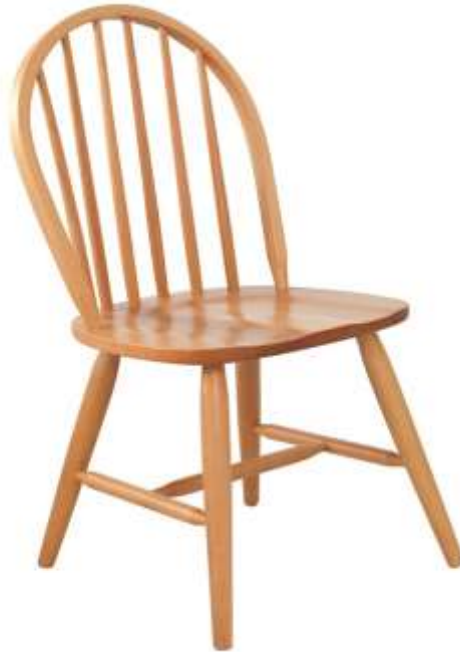
( Εικ.2.5 Καθημερινή ξύλινη καρέκλα του σήμερα )

Σήμερα υπάρχουν ατέλειωτα είδη καρέκλας για κάθε είδος ανάγκης που μπορεί να προκύψει. Από τις απλές καθημερινές καρέκλες τραπεζιού, γραφείου κτλ μέχρι gaming καρέκλες, θρόνους, καρέκλες διευθυντή και η λίστα δεν τελειώνει ποτέ. Μέχρι και πλαστικές καρέκλες για εξωτερικούς χώρους για τα πιο φτωγά ή και πλούσια σπίτια καθώς μέχρι έργα τέχνης σκαλισμένα σε στυλ καρέκλας αλλά όχι για την συνηθισμένη χρήση αυτού του επίπλου.