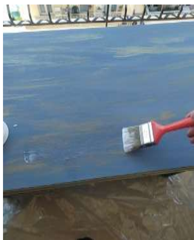
( Εικ.3.30 Εφαρμογή Βερνικιού )

Στην συνέχεια με το μείγμα στόκου, ξυλόκολλας και αμυλούχας ουσίας που μας δίνει το αποτέλεσμα που ψάχνουμε, γέμισα τις δύο πλαϊνές πλευρές του γραφείου με το σκεπτικό ότι θα