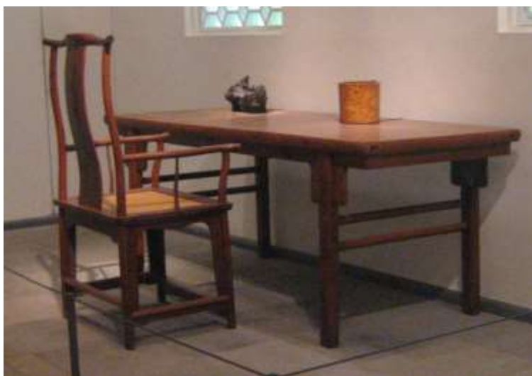
( Εικ.2.20 Γραφείο από των 12ο αιώνα στην Κίνα )