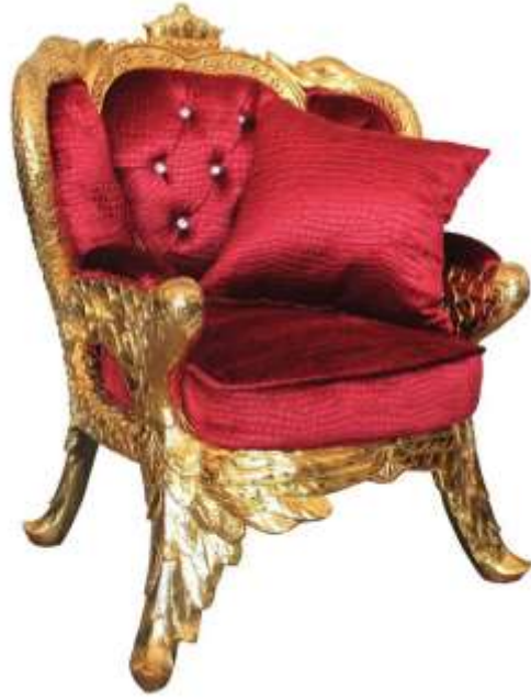
( Εικ.2.13 Βασιλική Πολυθρόνα, Πηγή [117] )