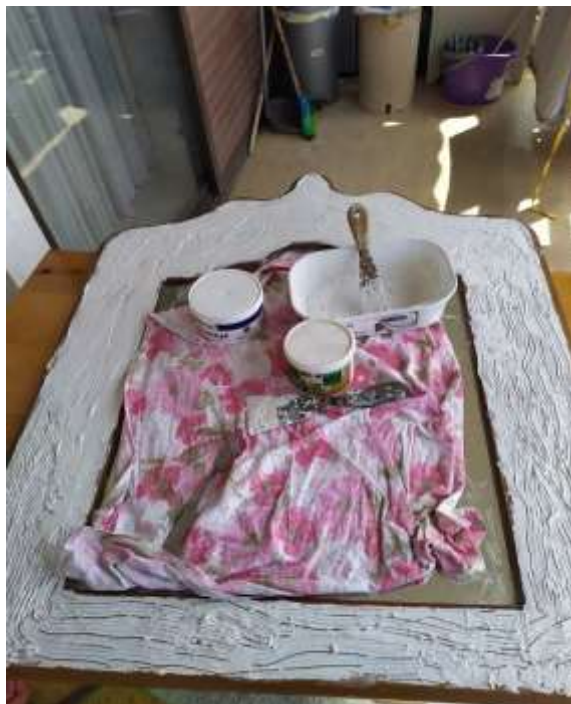
( Εικ.3.11 Ολοκλήρωση υφής 2 )

Με την ολοκλήρωση του πρώτου σταδίου εργασίας, σειρά πήρε ο χρωματισμός του Νορβηγικού κορμού. Καθώς βρίσκεται στην Νορβηγία, ο κορμός δεν θα ήταν αισθητικά ωραίος να ήταν ένα απλό καφέ καθώς πέρα του ότι δεν βγάζει κάποια τρομερή ιδιαιτερότητα και χαρακτήρα σαν χρώμα, τα δέντρα αυτού του τόπου έχουν κάτι το πιο χρωματιστό και ξεχωριστό. Έτσι, όπως και το Βόρειο Σέλας, αποφάσισα να παίξω με τα χρώματα και να διαλέξω κάτι ψυχρο και χειμωνιάτικο που θα σε κάνει να νιώσεις τόσο την σκανδιναβική φύση όσο και το να είναι εμπλουτισμένο με πινελιές χρυσού ώστε να δημιουργεί μια μαγευτική, στα μάτια μου, αντίθεση το χρώμα που θα το καταστήσει μοναδικό και διαφορετικό.