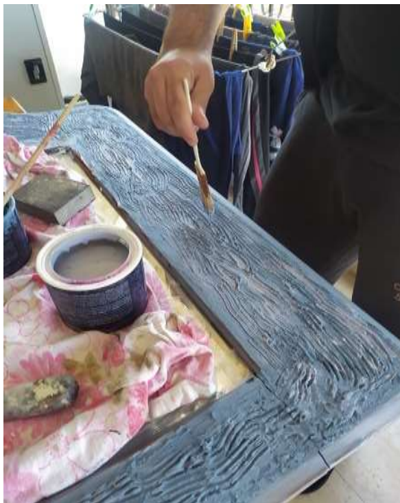
( Εικ.3.17 Πινελιές δεύτερου χρώματος )

Η εικόνα που αντίκρισα μετά το βάψιμο μου άρεσε πάρα πολύ και υποσχόταν πολλά για την συνέχεια της δουλειάς. Άφησα λοιπόν την μπογιά για ένα βράδυ στο μπαλκόνι ώστε να στεγνώσει καλά πάνω στον καθρέφτη. Την επόμενη μέρα όταν τον είδα με ξεκούραστο μάτι πρόσεξα πως ίσως του ταίριαζε και μια πιο ανοιχτή απόχρωση μπλε να ρέει σαν νερό πάνω στο υπάρχον χρώμα. Για αυτόν λοιπόν τον λόγο αποφάσισα να βάλω και το άλλο μπλε από την προηγούμενη εικόνα πάνω στο ξύλο.