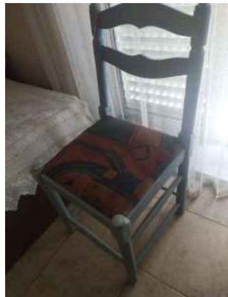
( Εικ.3.44 Καρέκλα ολοκληρωμένη )