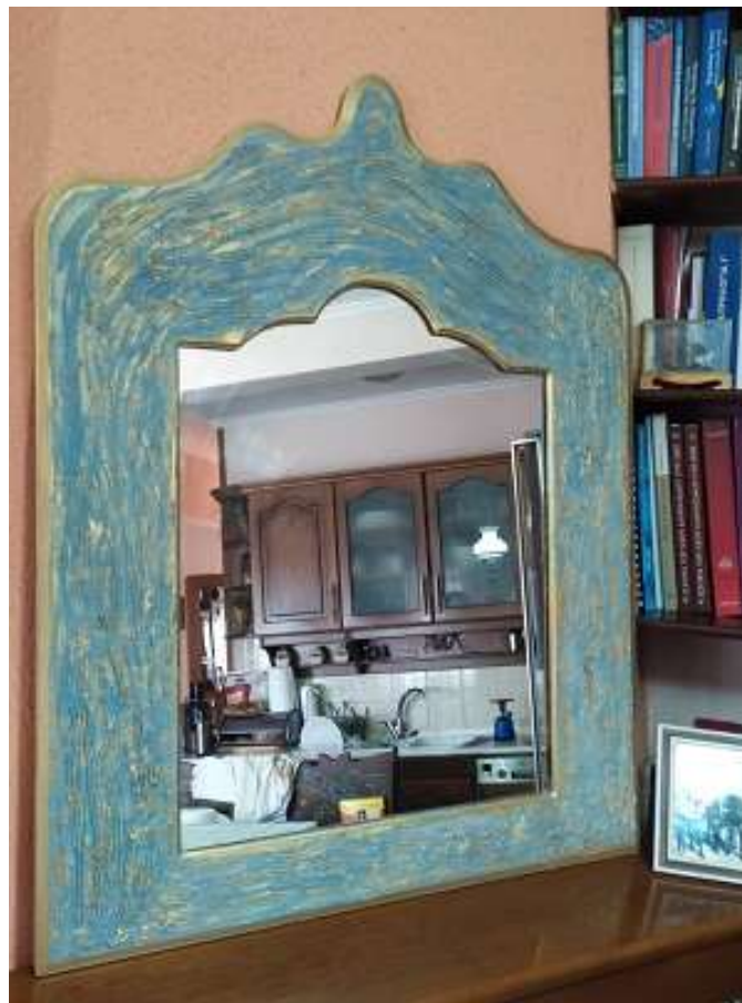
( Όψη ολοκληρωμένου καθρέφτη ) ( Εικ.3.22 )

Έτσι λοιπόν αντίκρισα την πρώτη μου κατασκευή μετά από μέρες δουλειάς να είναι έτοιμη αφού της πέρασα και δύο χέρια βερνίκι για να μην φεύγει το χρώμα. Επειδή βγήκε και πολύ ωραίο το τελικό σχέδιο την βάλαμε μέσα στο σπίτι μέχρι να έρθει η ώρα να την παρουσιάσω στο Πανεπιστήμιο.