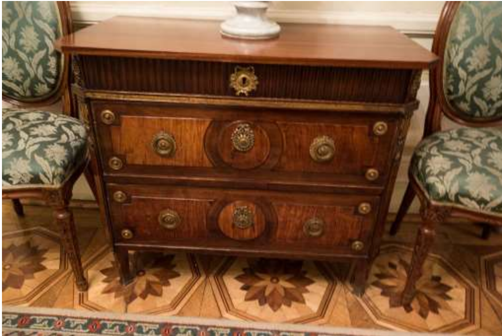
( Εικ.2.23 Στυλ βασίλισσας Άννας 1 )

Το στυλ της βασίλισσας Άννας χαρακτηρίζεται από τη βαριά μπαρόκ γραμμή του ενώ το Chippendale είναι πιο πρωτότυπο και αρεστό στην αστική καλαισθησία. Η ονομασία του οφείλεται στον επιπλοποιό Tomas Chippendale, που προτιμούσε τα αναπαυτικά και απλά σχήματα, αν και η κλίση του για περίπλοκη διάτρητη διακόσμηση τον οδήγησε σε υπερβολές. Το στυλ αυτό συγκεντρώνει χαρακτηριστικά νεογοθθικά, νεοκλασικά και γαλλικού ροκοκό, δημιουργώντας φόρμες με σαφή επίδραση της ανατολίτικης τέχνης. Τα έπιπλα ακολουθούσαν τις γραμμές των γοθθικών αψίδων, ενώ οι βιτρίνες και τα κρεβάτια κατέληγαν σε σχήμα παγόδας. [10].