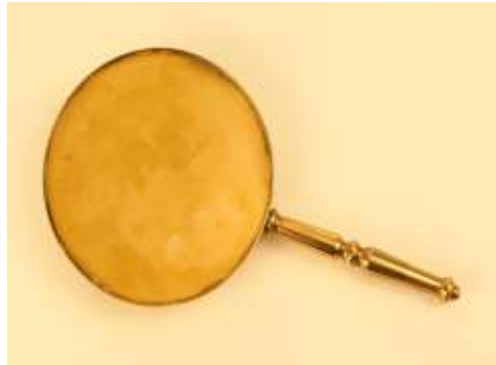
( Εικ.2.1γ Ρωμαϊκός Καθρέφτης φτηνής παραγωγής )

Οι πρώτοι καθρέφτες που θύμιζαν αυτό που ξέρουμε σήμερα και οδήγησαν σε βάθος χρόνου στην δημιουργία τους, πρωτοεμφανίστηκαν στην Λιβανέζικη Σιδώνα και στην Ρώμη όπου τοποθετούσαν στην μία πλευρά μέταλλο και στην άλλη γυαλισμένο γυαλί με υπόστρωμα μολύβδου, λίγους αιώνες μετά δημιούργησαν και τους πρώτους ανακλαστήρες. Οι παραπάνω καθρέφτες έμοιαζαν όπως οι εικόνες 2.1γ και 2.1δ: