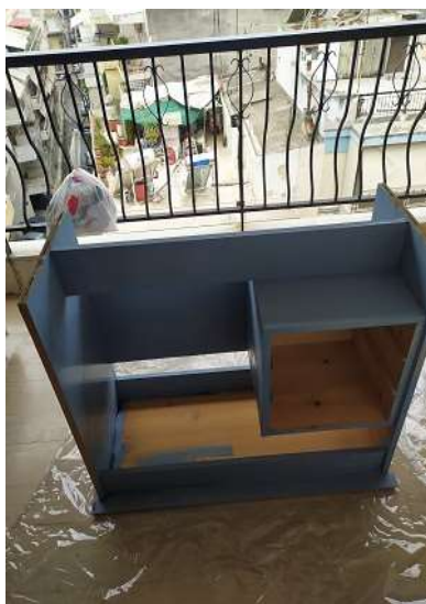
( Εικ.3.28 Χρωματισμός κάτω πλευράς )

Με το τέλος της εργασίας άφησα για κάποιες ώρες το μπλε χρώμα να στεγνώσει και όπως με τον καθρέφτη, έδωσα τις ίδιες χρυσές λεπτομέρειες με πιο λεπτεπίλεπτες κινήσεις για να δημιουργηθεί αντίθεση. Τέλος με το στέγνωμα και του χρυσού χρώματος πέρασα το βερνίκι πάνω στις βαμμένες επιφάνειες ώστε να μην φεύγει το χρώμα με την πάροδο του χρόνου.