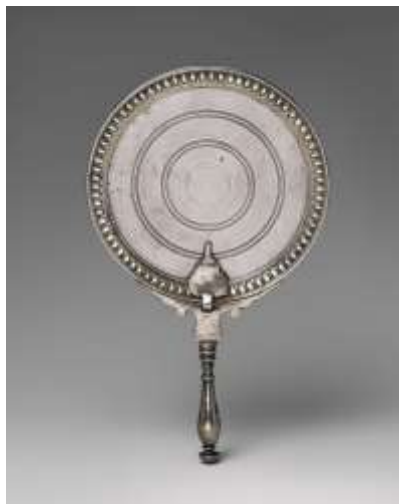
( Εικ.2.1δ Ρωμαϊκός Καθρέφτης ευκατάστατων )

Το γυαλί είναι ένα πολύ θεμιτό υλικό για τα κάτοπτρα καθώς η επιφάνεια του είναι λεία από τη φύση του και δημιουργεί ιδιαίτερα καθαρά είδωλα. Επίσης είναι σκληρό και ανθεκτικό στις γρατζουνιές. Όμως από μόνο του έχει χαμηλή ανακλαστικότητα με αποτέλεσμα οι άνθρωποι να το χρησιμοποιούν επικαλύπτοντας το με άλλα μέσα ώστε να την αυξήσουν. Τέτοια κάτοπτρα λέγεται πως ανακαλυφτήκαν στη Σιδώνα του Λιβάνου τον 1ο αιώνα μ. Χ.