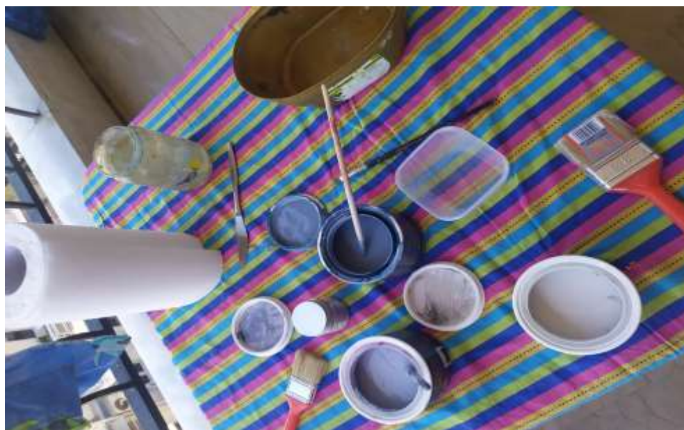
( Εικ.3.12 Χρώματα )

Με την ολοκλήρωση του πρώτου σταδίου εργασίας, σειρά πήρε ο χρωματισμός του Νορβηγικού κορμού. Καθώς βρίσκεται στην Νορβηγία, ο κορμός δεν θα ήταν αισθητικά ωραίος να ήταν ένα απλό καφέ καθώς πέρα του ότι δεν βγάζει κάποια τρομερή ιδιαιτερότητα και χαρακτήρα σαν χρώμα, τα δέντρα αυτού του τόπου έχουν κάτι το πιο χρωματιστό και ξεχωριστό. Έτσι, όπως και το Βόρειο Σέλας, αποφάσισα να παίξω με τα χρώματα και να διαλέξω κάτι ψυχρο και χειμωνιάτικο που θα σε κάνει να νιώσεις τόσο την σκανδιναβική φύση όσο και το να είναι εμπλουτισμένο με πινελιές χρυσού ώστε να δημιουργεί μια μαγευτική, στα μάτια μου, αντίθεση το χρώμα που θα το καταστήσει μοναδικό και διαφορετικό.