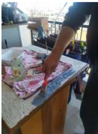
( Εικ.3.13 Εφαρμογή χρωμάτων )

που ήθελα να κάνω και ξεκίνησα το βάνιμο με το πιο σκούρο μπλε.