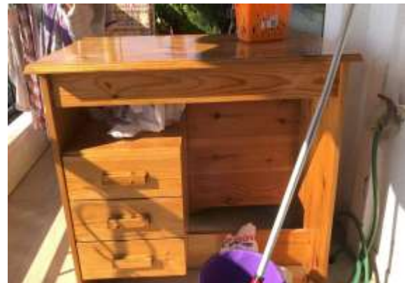
( Μετά το πλύσιμο ) ( Εικ.3.25 )

Η διαδικασία που ακολούθησα για να κάνω το γραφείο είναι μεν παρόμοια με του καθρέφτη αλλά καθώς είναι άλλο είδος έπιπλου έπρεπε να γίνουν κάποια έξτρα μικροπράγματα προτού περαστεί το πρώτο χρώμα. Αφαίρεσα λοιπόν τα συρτάρια του ώστε να μπορεί να βαφτεί και εσωτερικά το έπιπλο και το γύρισα ανάποδα ώστε να αρχίσω το μπογιατίσιμα από τις κάτω επιφάνειες.