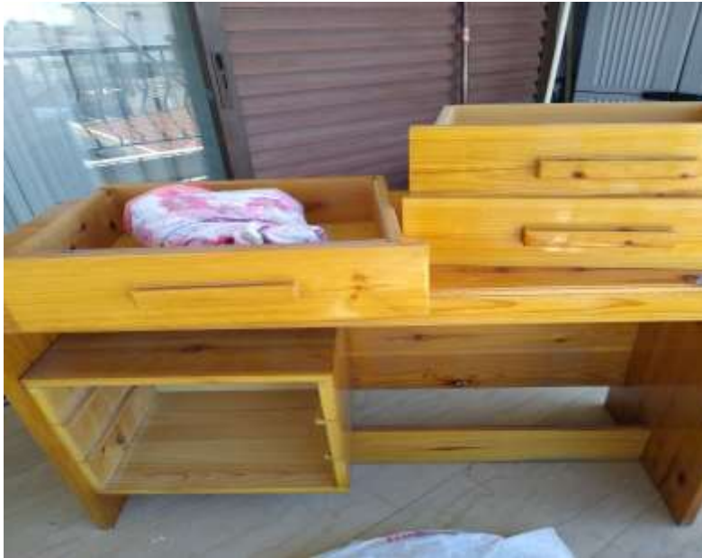
( Εικ.3.23 Αρχική Μορφή Γραφείου )

Με την ολοκλήρωση του βασικού καθρέφτη έπρεπε να ξεκινήσω την ετοιμασία του γραφείου με το οποίο θα πηγαίνει σετ μαζί με την καρέκλα αργότερα. Η κατάσταση στην οποία είχε βρεθεί το γραφείο δεν ήταν η καλύτερη καθώς εκτός απο σκόνη και βρωμιά είχε χαλάσει και το χρώμα σε αρκετά σημεία του, επιπλέον τα συρτάρια του βρίσκονταν ξεχωριστά από το γραφείο. Ευτυχώς όμως αυτό δεν θα με επηρέαζε καθώς σκοπός μου είναι να του δώσω μια εντελώς νέα εμφάνιση συνεπώς θα αλλάξει και το χρώμα του.