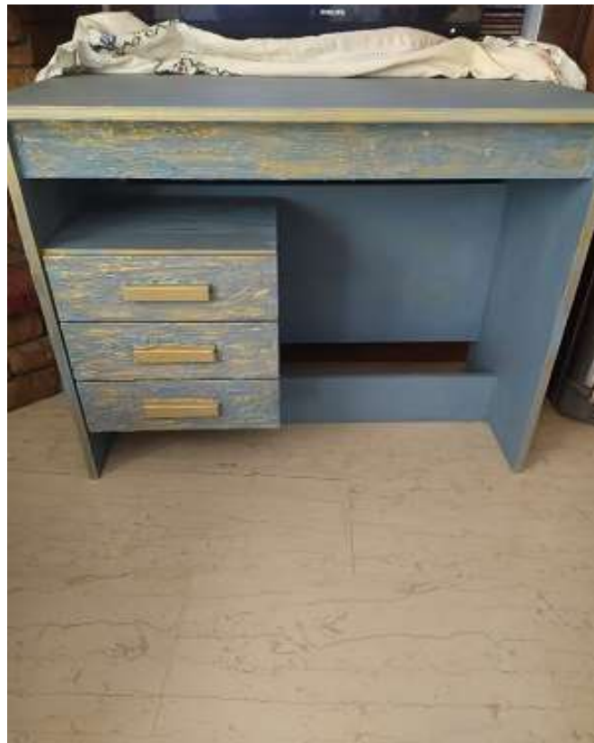
( Εικ.3.38 Ολοκληρωμένο γραφείο )