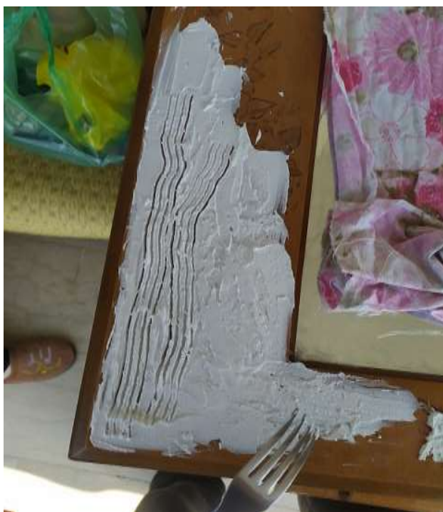
( Εικ.3.7 Όψη υφής προ ολοκλήρωσης ) Και αυτή είναι αφού καλύφθηκε ένα μέρος του καθρέφτη. Όπως βλέπετε χρησιμοποιώ ένα πιρούνι προκειμένου να πετύχω τα νερά και την αίσθηση που βγάζει το ξύλο και ο κορμός των δέντρων. Η εργασία συνεχίστηκε προσεκτικά ώστε να μην γίνει κάποιο λάθος και χρειαστεί να ξαναρχίσει από την αρχή ή ακόμα χειρότερα να καταστραφεί ο καθρέφτης.