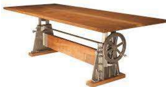
( Εικ.2.26 Γραφείο εργάτη, Πηγή [129] )

Οι σχεδιαστές συνέχισαν να φτιάχνουν γραφεία με ωραίες λεπτομέρειες και σχέδια πάνω τους κυρίως για τις πλούσιες οικογένειες και τα υψηλόβαθμα μέλη των εκάστοτε κυβερνήσεων, όσο οι κατώτερες τάξεις έπρεπε να βολεύονται με τα γραφεία που παράγονταν μαζικά από ανειδίκευτους εργάτες και δεν είχαν κάποια ιδιαιτερότητα που να τα ξεχωρίζει το ένα με το άλλο.