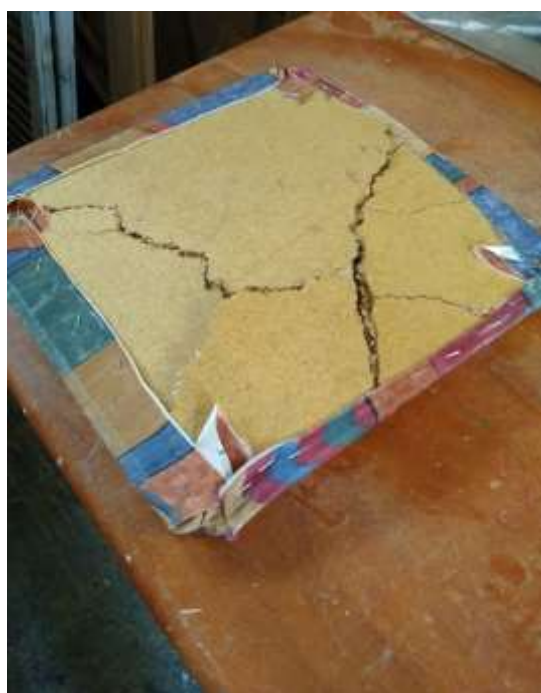
( Εικ.3.40 η σπασμένη θέση )