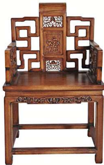
( Εικ.2.4β Μια καθημερινή κινεζική καρέκλα του 1300 μ.Χ.  )

Με το πέρασμα των χρόνων και την αλλαγή των εποχών φυσικά οι καρέκλες θα έπρεπε, όπως και όλα τα αντικείμενα στην ζωή, να μεταλλαχθούν, τροποποιηθούν και γενικά να αλλάξουν την όψη τους ώστε να ταιριάζουν και να προσαρμόζονται στις νέες συνθήκες ζωής της εκάστοτε εποχής. Ο