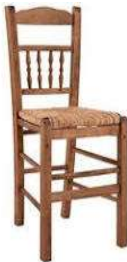
( Εικ.2.6 Καθημερινή ψάθινη καρέκλα )