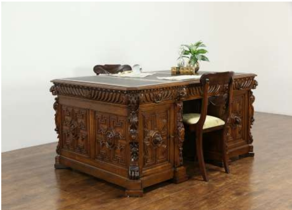
( Εικ.2.24 Πολυτελές γραφείο )