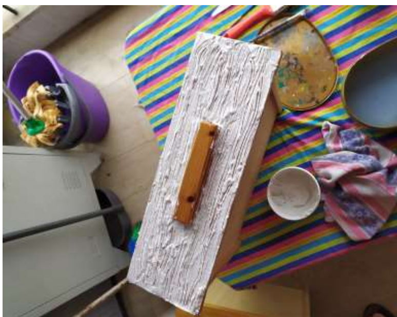
( Εικ.3.36 Εφαρμογή στα συρτάρια )

Στην συνέχεια πέρασα και με το πιρούνι την αίσθηση κορμού. Αφού στέγνωσε έμοιαζε κάπως έτσι: