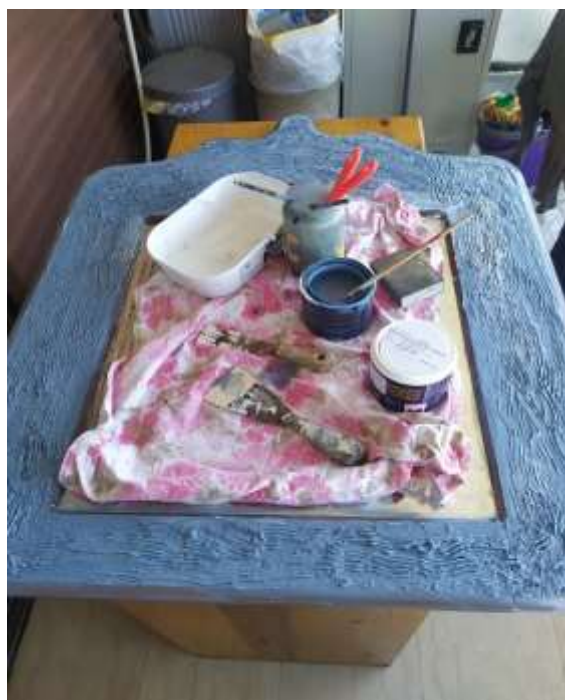
( Εικ.3.15 Ολοκλήρωση εφαρμογής αρχικού χρωματος )