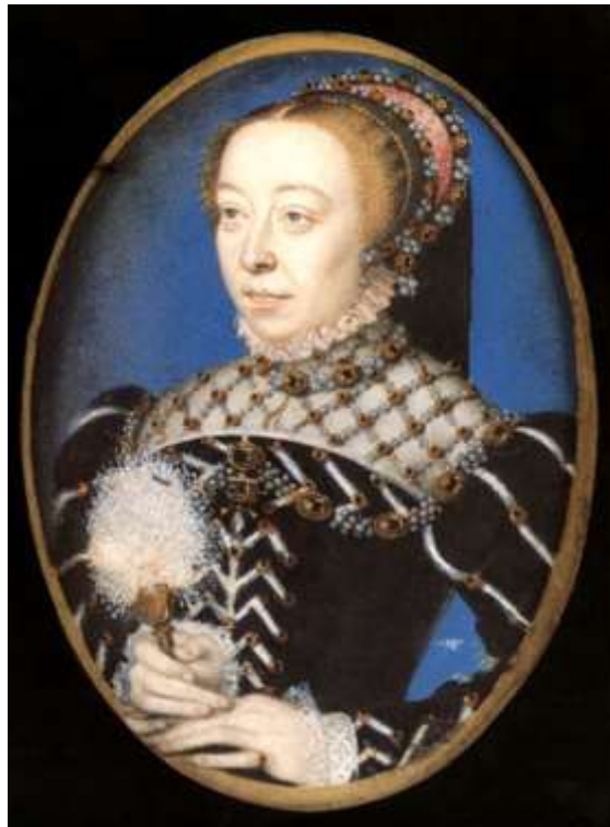
( Εικ.2.2 Η Εκατερίνη των Μεδίκων κατά την περίοδο της Αναγέννησης, Πηγή [106] )

τις εχθρικές κινήσεις. Σήμερα αυτό το είδος της μαντείας εξακολουθεί να υπάρχει στην υποσαχάρια Αφρική[5].