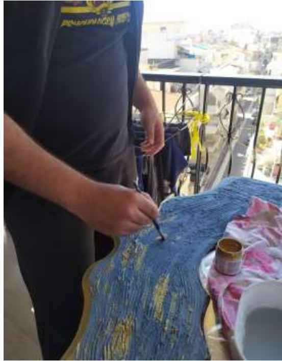
( Εικ.3.18 Χρυσές πινελιές )