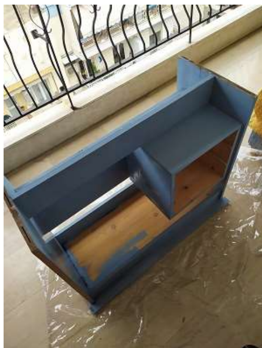
( Εικ.3.27 Χρωματισμός κάτω πλευράς )