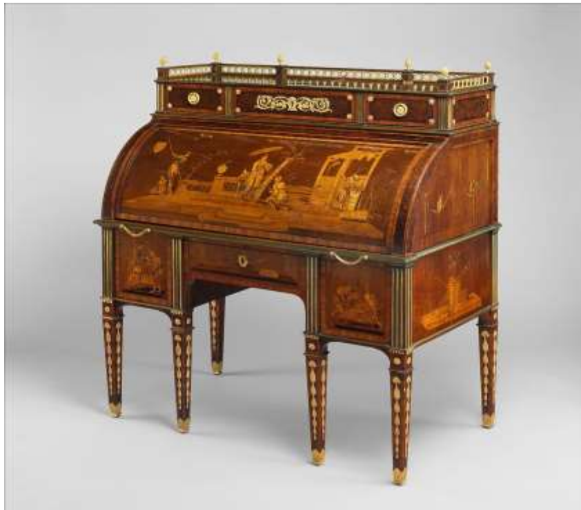
( Εικ.2.28 Κυλινδρικό τραπέζι rolltop )

Η ανάπτυξη της χαρτοποιίας οδήγησε στο σχεδιασμό πιο στυλάτων γραφείων μαζικής παραγωγής καθώς και οι ανάγκες για ομορφιά στις κατώτερες τάξεις αναπτύχθηκε. Αυτό οδήγησε στην δημιουργία των κυκλικών και των γραφείων με ράφια.