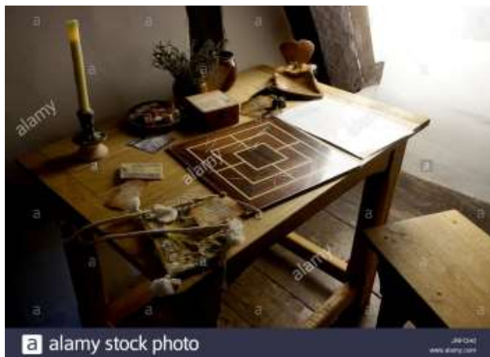
( Εικ.2.19 Γραφείο Μεσαιώνικου Τύπου )

Τα τραπέζια είναι ένα από τα λίγα έπιπλα που ενώ φαίνονται σαν η ιστορία τους να ξεκινάει από τα πολύ αρχαία χρόνια, κάτι τέτοιο δεν ισχύει καθώς δεν τα χρησιμοποιούσαν ούτε στην αρχαία Ελλάδα ούτε στην Μέση Ανατολή αλλά ούτε και στα βόρεια της Ασίας. Η εμφάνιση των πρώτων αναφορών σε γραφεία έγινε κατά τον Μεσαίωνα τα οποία βέβαια δεν ήταν ακριβώς γραφεία όσο περισσότερο έπιπλα που βοηθούσαν στο διάβασμα και την γραφή [9].