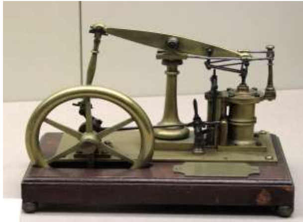
( Εικ.2.25 Ατμομηχανή, Πηγή [128] )

Τα πρώτα γραφεία που σχεδιάστηκαν τα οποία έχουν τις περισσότερες ομοιότητες με τα σημερινά, φτιάχτηκαν τον 17ο με 18ο αιώνα. Τα μοντέρνα εργονομικά γραφεία, τα οποία είναι βασισμένα στα σχεδιαστικά γραφεία μας έρχονται από το τέλος του 18ου αιώνα. Αυτό οδήγησε στην μεγάλη ανάπτυξη και παραγωγή γραφείων τον 19ο αιώνα και κατά την Βιομηχανική Επανάσταση. Εκείνη την περίοδο πολύς κόσμος δούλευε πάνω σε γραφείο είτε άνηκε σε υψηλή κοινωνική τάξη είτε άνηκε στην εργατική τάξη, οι δουλειές για το οποίο θα χρησιμοποιούσαν βέβαια το γραφείο θα ήταν παντελώς διαφορετικές, συνεπώς έπρεπε ο καθένας να έχει το γραφείο που αναλογούσε στην δική του δουλειά, π.χ ο εργάτης θα είχε ενσωματωμένη μια ραπτομηχανή επάνω στο γραφείο. Μέσα σε ένα εργοστάσιο πάλι θα μπορούσαν να υπάρχουν γραφεία πάνω στα οποία θα είχαν τοποθετήσει ατμοκίνητες μηχανές για να τους βοηθήν στην παραγωγή [11].