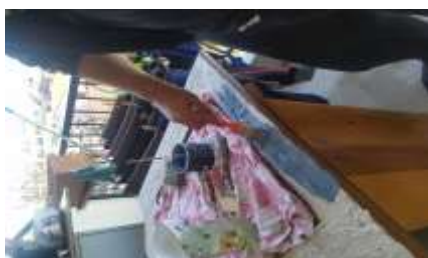
( Εικ.3.14 Εφαρμογή χρωμάτων )

Τοποθετώντας μέσα στο νερό το σκούρο μπλε παρατήρησα ότι έβγαινε το χρώμα που αναζητούσα χωρίς την ανάγκη πιο ανοιχτού μπλε καθώς μετά το βούτηγμα σε νερό το χρώμα άνοιγε και γινόταν πιο φυσικό και όμορφο. Έτσι λοιπόν συνέχισα μόνο με το ένα από τα δύο.