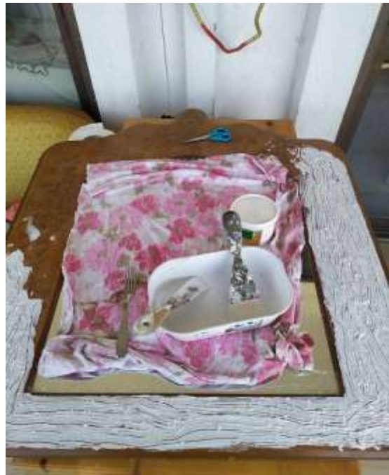
( Εικ.3.9 Γενική όψη μετά από εφαρμογή υφής )

Μέχρι που εν τέλει μετά από κάποιες ώρες ήταν σπατουλαρισμένος ο καθρέφτης και οι ιδιαιτερότητες του κορμού έτοιμες.