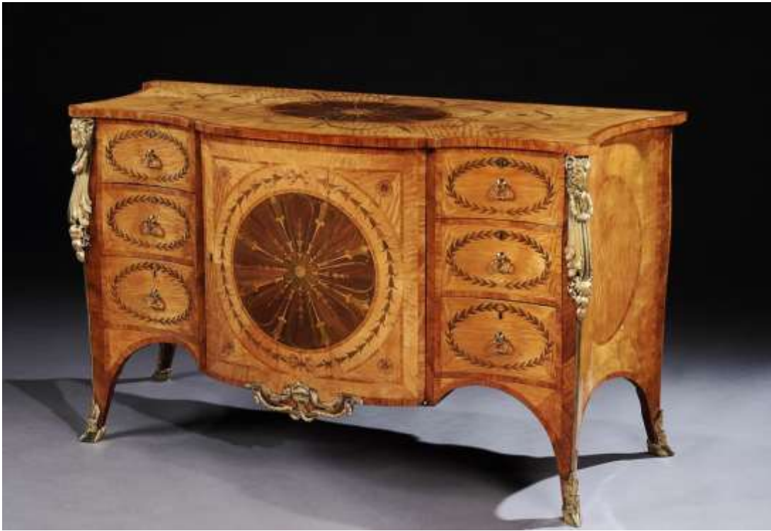
( Εικ.2.22 Στυλ chippendale )