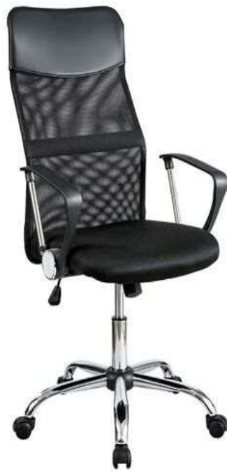
( Εικ.2.10 Καρέκλα Γραφείου με Ρόδες, Πηγή [114] )