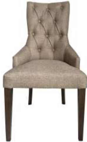
( Εικ.2.9 Πολυθρόνα )