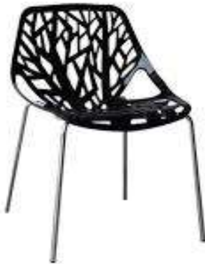
( Εικ.2.15 Σιδερένια Καρέκλα )