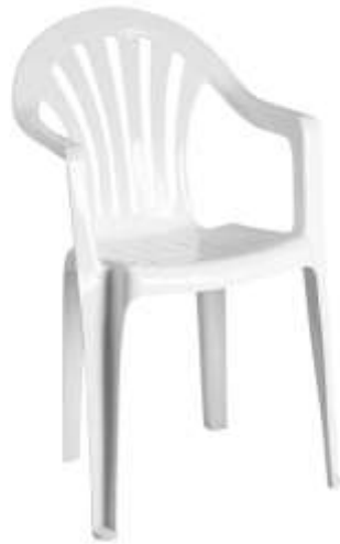
( Εικ.2.7 Πλαστική Καρέκλα )