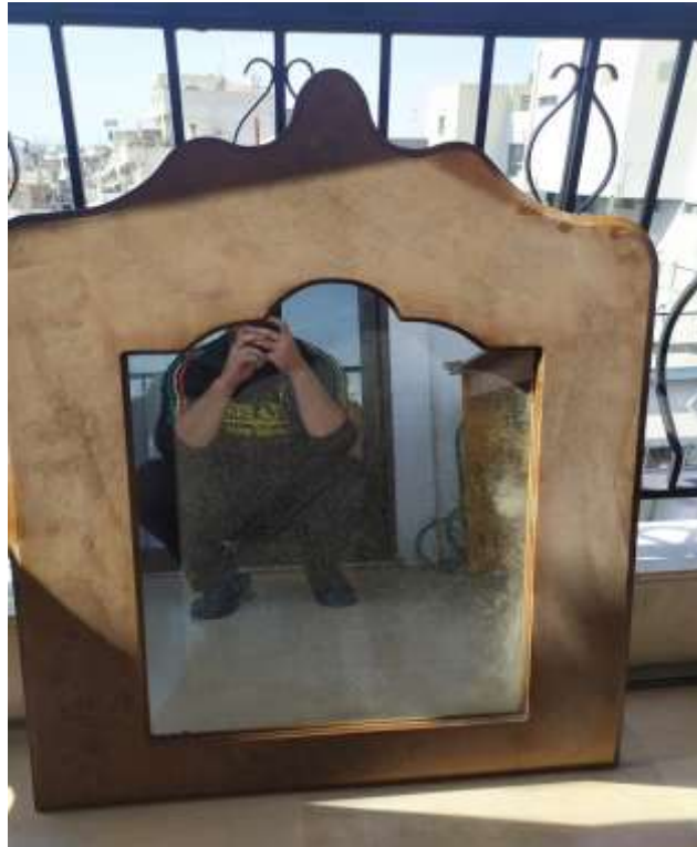
( Εικ.3.1 Αρχική μορφή καθρέφτη )

Η προέλευση όλων των αντικειμένων είναι από το σπίτι της γιαγιάς μου στα “νεκρά” έπιπλα της αποθήκης της. Η κατάσταση των παρακάτω επίπλων ήταν από απλή βρωμιά έως σπασμένα και ξεχασμένα. Η αναπαλαίωσή τους ξεκίνησε προκειμένου να πετύχω τον τελικό μου στόχο ώστε να είναι σαν καινούργια, αχρησιμοποίητα αλλά και καινοτόμα.