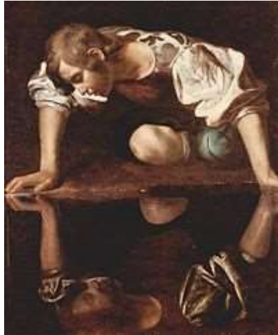
(Εικ.2.1ε Ο Νάρκισσος στην πηγή, Μιχαήλ-Αγγελος, Πηγή [104])

Κατά τον Μεσαίωνα οι καθρέφτες είχαν συνδεθεί με την μαγεία και τις μάγισσες καθώς θεωρούνταν εργαλείο το οποίο της βοηθούσε να εγκλωβίσουν ψυχές, οντότητες ακόμα και δαίμονες. Σε πολλά παραμύθια της τότε εποχής, απεικονίζονται μάγισσες οι οποίες βλέπαν στο παρελθόν, παρό, και μέλλον μέσω των καθρεφτών