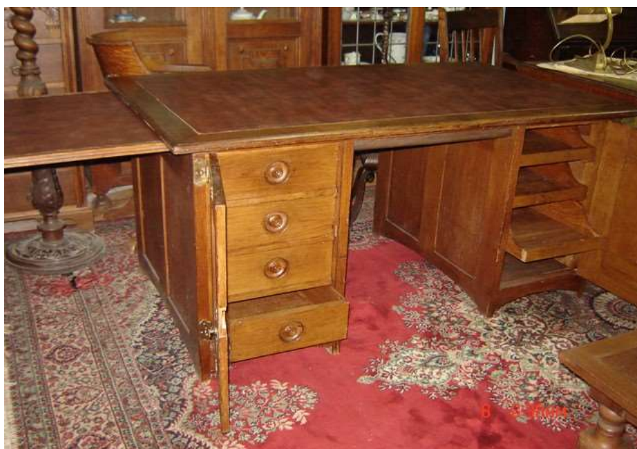
( Εικ.2.31 Σημερινό ξύλινο γραφείο, Πηγη [134] )

Κατά τον 21ο αιώνα, τάση στο έπιπλο είναι η εκβιομηχάνισή του. Πλέον, τα έπιπλα κατασκευάζονται σε βιοτεχνική ή και βιομηχανική κλίμακα, γεγονός που έχει εξοβελίσει τα χειροποίητα έπιπλα από την αγορά. Στόχος είναι όπως είναι φυσικό η μεγαλύτερη, ταχύτερη παραγωγή και η ελαχιστοποίηση του κόστους.