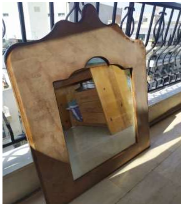
( Εικ.3.2 Αρχική μορφή καθρέφτη )