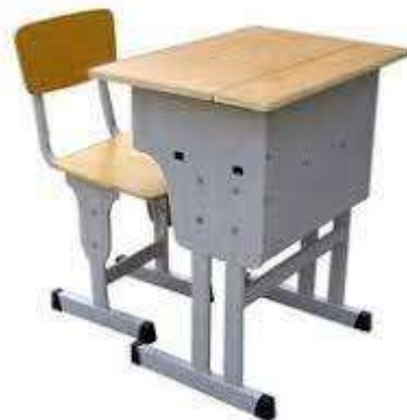
( Εικ.2.35 Μονή θέση με γραφείο ξύλινη )