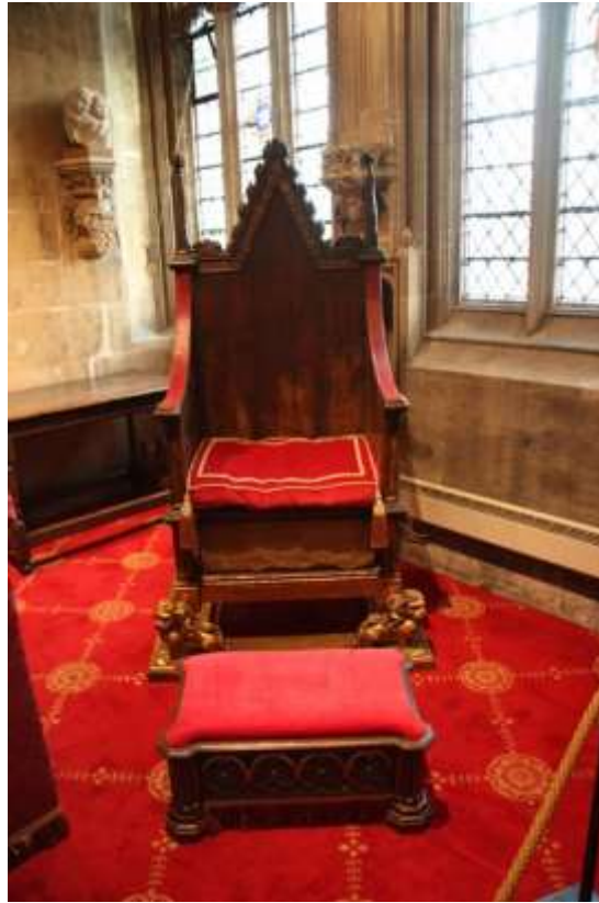
( Εικ.2.4α Μια κινεζική καρέκλα υψηλόβαθμου ή μέλους βασιλικής οικογένειας το 1300 μ.Χ. Πηγή [108] )