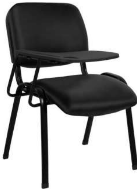
( Εικ.2.36 Μονή θέση με γραφείο, Πηγή [139] )