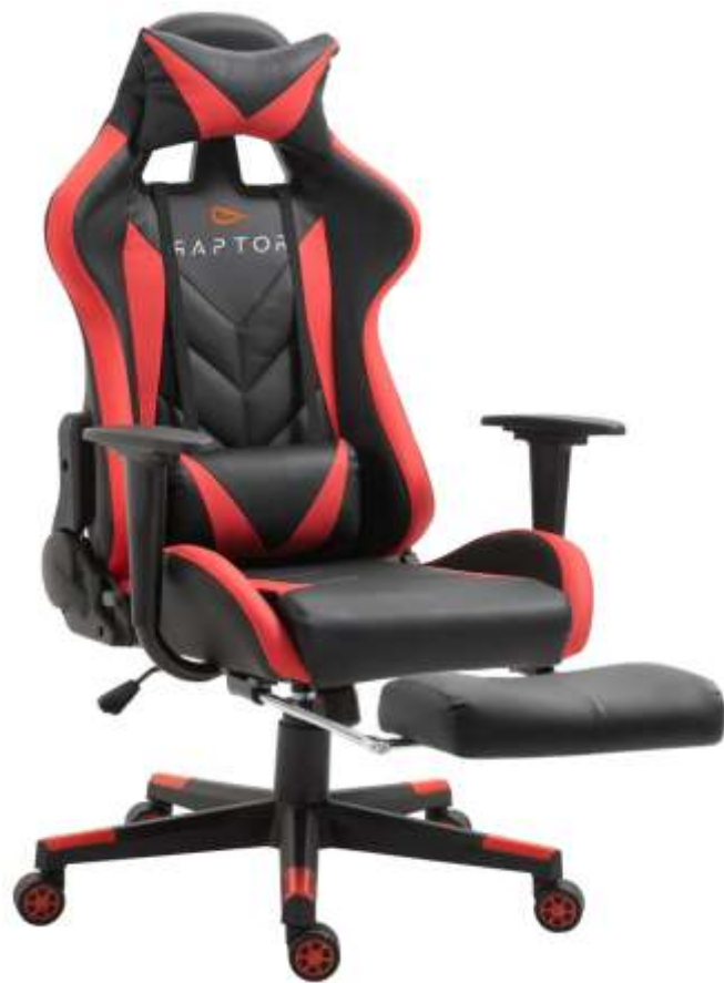
( Εικ.2.12 Gaming καρέκλα )