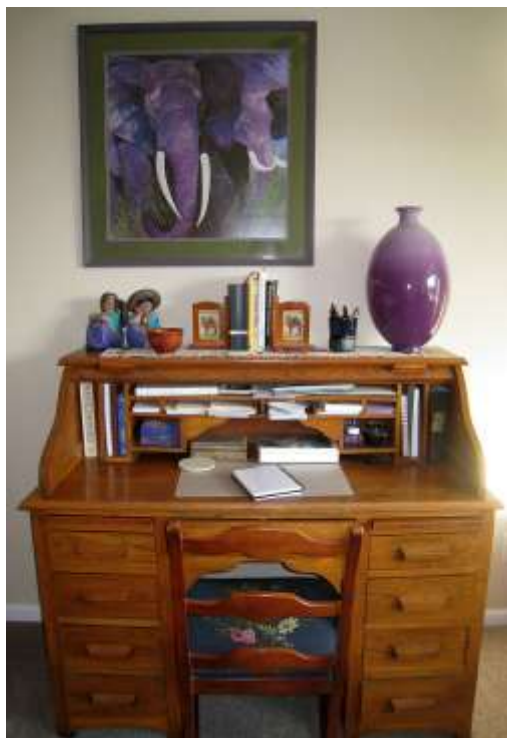
( Εικ.2.29 Σημερινό γραφείο rolltop )

Φτάνοντας στο 19ο Αιώνα και μετά την πτώση του Ναπολέοντα, οι γαλλικοί ρυθμοί επανήλθαν στο προσκύνιο με την μορφή του Διευθυντήριο και Αυτοκρατορίας. Το κύριο χαρακτηριστικό στα σχέδια αυτού του ρυθμού ήταν η Ψυχή ( ένας κινητός καθρέφτης ορθογώνιου σχήματος ο οποίος στέκεται πάνω σε δύο κιονίσκους με διάφορα ποικίλματα [10].