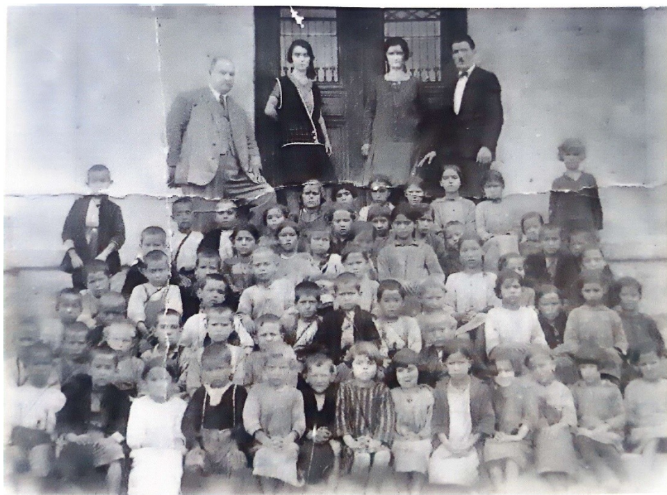
2. Δάσκαλοι και μαθητές Δημοτικού Σχολείου του 1920