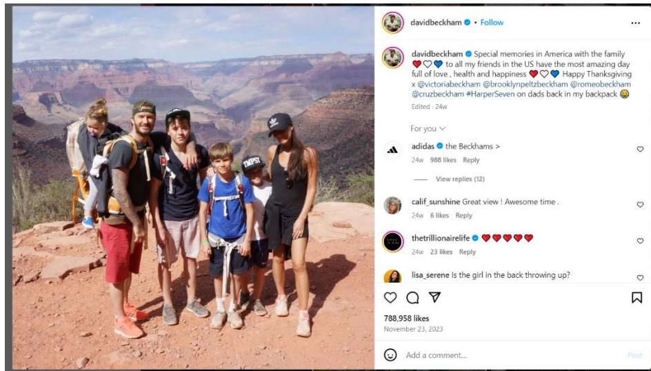
Εικόνα 3. Οικογένεια Beckham

Η τελευταία περίπτωση sharenting, με την οποία θα ασχοληθούμε, αποτελεί το παράδειγμα της οικογένειας Beckham (Εικόνα 3).