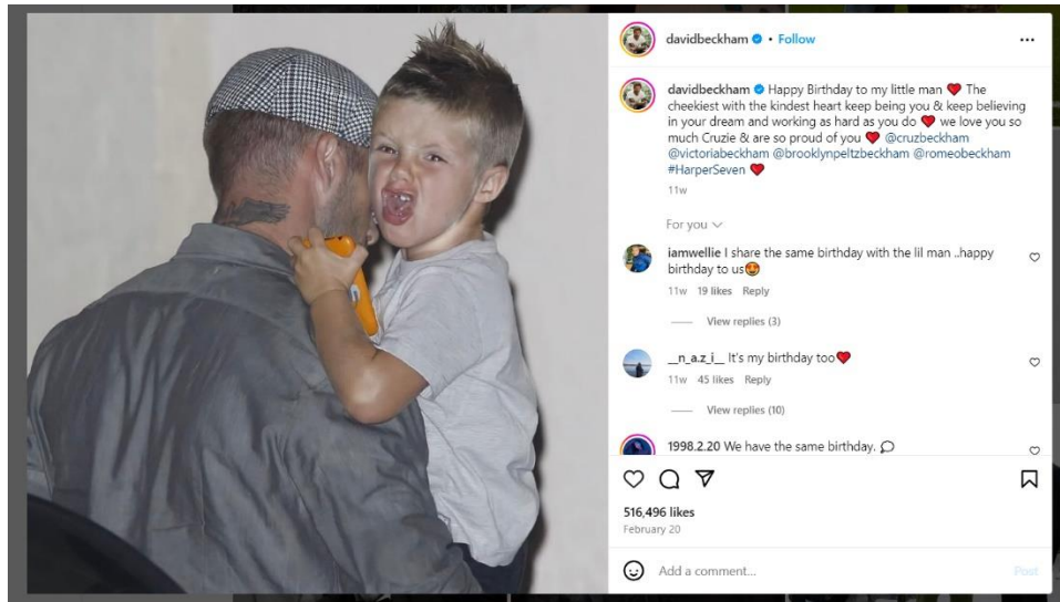
Εικόνα 4. Δημοσίευση του Beckham με τον γιο του στο Instagram