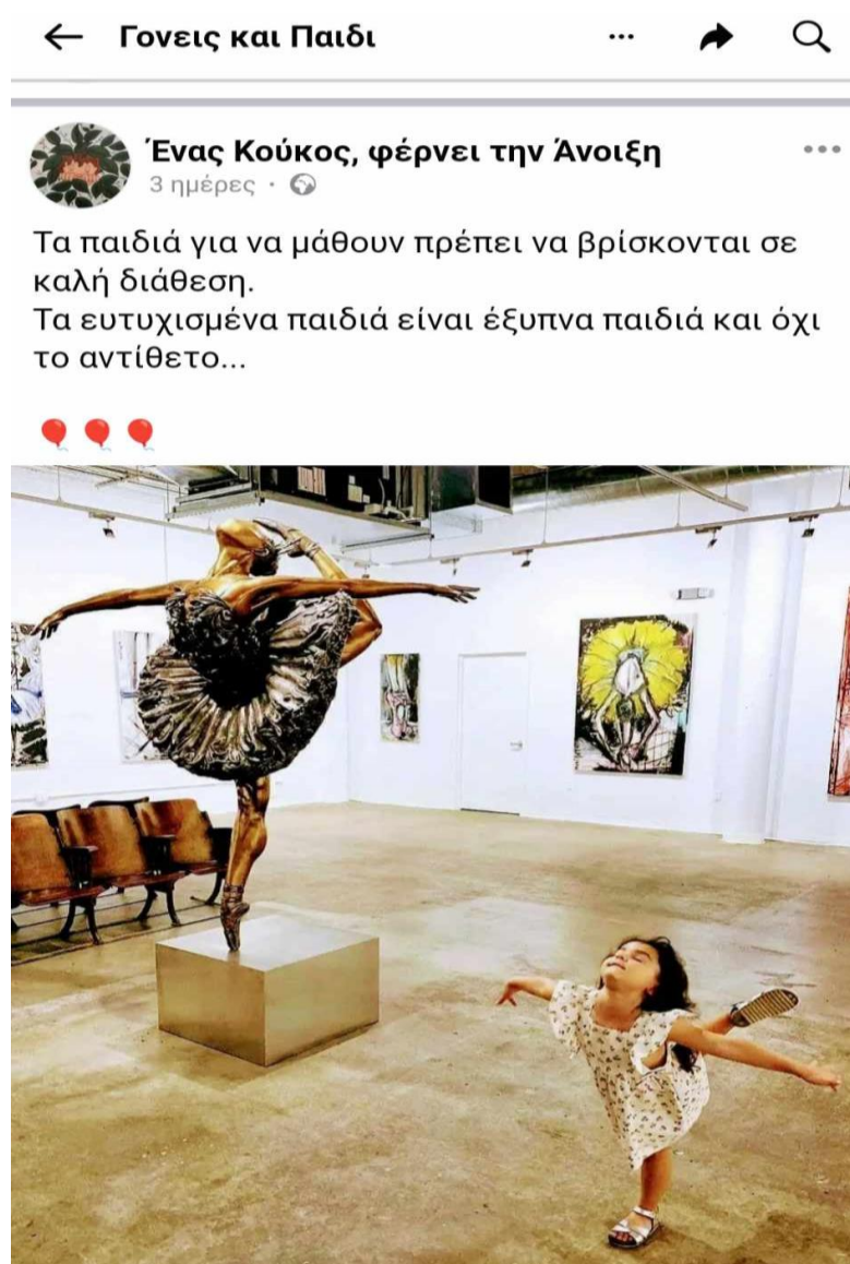
Εικόνα 1. Δημοσίευση ομάδας αλληλοβοήθειας γονέων

του παιδιού είναι αρκετές για να δημιουργηθεί μια πρώτη ταυτότητα, μέσα από τα μάτια του γονέα, η οποία ενδεχομένως θα έρθει σε αντιπαράθεση αργότερα με την ταυτότητα που θα θελήσει να δημιουργήσει το παιδί.