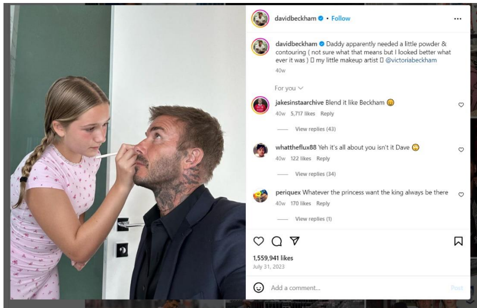
Εικόνα 5. Δημοσίευση του Beckham με την κόρη του στο Instagram