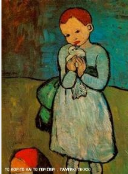
Το κορίτσι και το περιστέρι , Πάμπλο Πικάσο