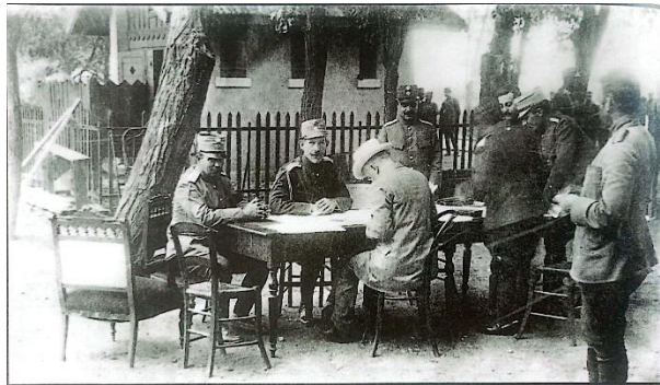
Εικόνα 2: Βυρώνεια 14 Ιουνίου 1913 (Μουσείο Μπενάκη) Ελληνικό στρατηγείο Χατζή-Μπεηλίκ: από αριστερά καθήμενος ο Βίκτωρ Δούσμανης, ο Κωνσταντίνος Α', όρθιος ο Ιωάννης Μεταξάς και με πλάτη στην κάμερα ο Ελευθέριος Βενιζέλος. Δύο ημέρες μετά αρχίζει ο Β' Βαλκανικός Πόλεμος, ύστερα από την εισβολή των Βουλγαρικών δυνάμεων εναντίον των