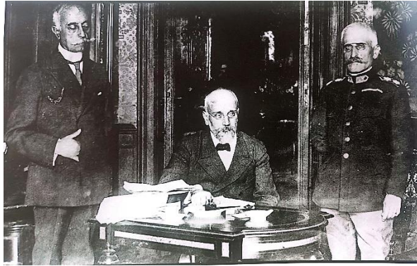
Εικόνα 10: ΤΡΙΑΝΔΡΙΑ: Ελ. Βενιζέλος, ναύαρχος Π. Κουντουριώτης, στρατηγός Παναγιώτης Δαγκλής. Οκτώβριος του 1916. Κεντρικά, ηγετικά πρόσωπα του Κινήματος της Εθνικής Άμυνας Θεσσαλονίκης.

Βενιζέλου 90 . Στην παλαιά Ελλάδα το κίνημα δεν θεωρήθηκε ως κάτι τόσο αξιόλογο δεδομένης της αδιαφορίας την οποία επέδειξε ο απλός λαός αλλά και οι πολλοί στρατιωτικοί. Ο Ελευθέριος Βενιζέλος περίμενε την έγκριση της Αγγλίας και άλλων ευρωπαϊκών χωρών, εντούτοις, η Αγγλία διατήρησε επιφυλακτική στάση αρνούμενη να συνηγορήσει σε μια επαναστατική κίνηση που θα βασιζόταν στην αντίθεση προς τη μοναρχία 91 .