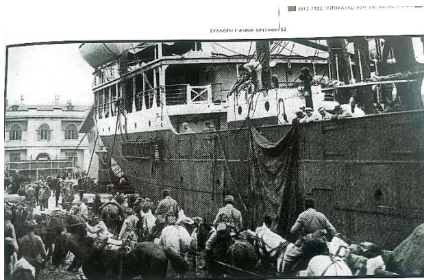
ΘΕΣΣΑΛΟΝΙΚΗ, 5 ΟΚΤΩΒΡΙΟΥ 1915. τσπη εζόδου τής Ελλάδος στον πο-

Ράλλης, Δραγούμης και Γούναρης, ο υποστράτηγος Γιαννακίτσας και ο αντι-ναύαρχος Παύλος Κουντουριώτης. Για να μην γίνει διάλυση της Βουλής, οι Φιλελεύθεροι θα ανεχθούν το κυβερνητικό σχήμα με την δηλωμένη «Ανοχή», αλλά ο Ζαΐμης δεν θα ζητήσει ψήφο εμπιστοσύνης για την κυβέρνησή του. Σύμφωνα με την «Εφημερίς των Συζητήσεων της Βουλής», στις 28 Σεπτεμβρίου 1915, σ.184, η κυβέρνηση αυτή χαρακτηρίζεται ως «σύλλογος προκρίτων» 36 . Παραμονή της επίθεσης της Βουλγαρίας στη Σερβία, αρνείται να την βοηθήσει στα πλαίσια του Συμφώνου φιλίας του 1913, όπως επίσης απέρριψε, στα πλαίσια της «ουδετερότητας», την πρόταση της Αγγλίας να δώσουν στη Ελλάδα την Κύπρο καθώς και τη δυτική Θράκη που ανήκε στη Βουλγαρία, προκειμένου να βοηθήσει τη Σερβία 37 .