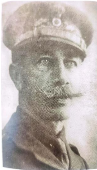
Εικόνα 16: Εμμανουήλ Ζυμβρακάκης

Η Επιτροπή της Εθνικής Άμυνας αποτέλεσε τον πυρήνα του Κινήματος της Θεσσαλονίκης, με πολιτικά και στρατιωτικά στελέχη να παίζουν σημαντικό ρόλο στην οργάνωση και λειτουργία του. Ένα από τα πρώτα ηγετικά πρόσωπα που συνέβαλαν στην ίδρυση της Επιτροπής ήταν ο Παμίκος Ζυμβρακάκης, ένας αξιωματικός που ηγήθηκε στρατιωτικών επιθέσεων κατά της Βουλγαρίας. Ο Ζυμβρακάκης, μαζί με άλλους αξιωματικούς, συμπεριλαμβανομένου του αδελφού του Μανώλη Ζυμβρακάκη, και άλλων μαχητών, συνέβαλαν στην ενίσχυση της στρατιωτικής δράσης υπέρ του Κινήματος.