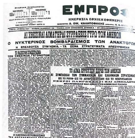
Εικόνα 5: Η ρήξη της βασιλείας των Αθηνών με τις δυνάμεις της Αντάντ, επήλθε το Νοέμβριο του 1916 και θεωρείται μια καίρια στιγμή του Μεγάλου Πολέμου. Πρωτοσέλιδο Εφ. « ΕΜΠΡΟΣ», του Δ. Καλαποθάκη, αρ. φύλλο 7220, 19/11/1916. Από το βιβλίο «Ελευθέριος Βενιζέλος «Η Μεγάλη πορεία. Από το Ανάθεμα στην Αποδέσμευση». Σελ. 127-128 της Δέσποινας Παπαδημητρίου «Η ΧΘΕΣΙΝΗ ΕΚΔΙΚΗΤΗΡΙΟΣ ΗΜΕΡΑ», Ε-ΙΣΤΟΡΙΚΑ , εκ. ΕΛΕΥΘΕΡΟΥΤΥΠΙΑ

Οι εξελίξεις ήταν ραγδαίες και ο Ημερήσιος Τύπος ενημέρωνε το λαό για την επιβολή της εγκατάλειψης της ουδετερότητας και την έγκαιρη είσοδο της χώρας στον πόλεμο στο πλευρό της τριπλής συμμαχίας 45 . Ο φιλοβασιλικός τύπος έδειχνε μια ιδιαίτερη προτίμηση στις αποφάσεις του Κωνσταντίνου και σημείωνε ότι ο ελληνικός στρατός θα γινόταν ένα μισθοφορικό σώμα, ενώ η «Σκριπ» του Ευστρατιάδη, έκανε αναφορές και στις επιδιώξεις της Αγγλίας και της Γαλλίας 46 . Στη συνέχεια, η εφημερίδα «Ακρόπολις» του Γαβριηλίδη, παρομοίαζε το Βενιζέλο με ιατρό που ήταν υπεύθυνος για το ιατρικό συμβούλιο. Αυτά αφορούσαν στην αποτίμηση της κατάστασης από τον ελληνικό τύπο, όμως στο εξωτερικό, η κατάσταση που επικρατούσε ήταν διαφορετική, αφού, σύμφωνα με την «Ακρόπολις» και πάλι, οι εξελίξεις στην Ελλάδα σχολιάστηκαν αρνητικά 47 . Η δυσαρέσκεια τους οφειλόταν στην παραίτηση ενός άξιου πολιτικού. Ο «εωθινός ταχυδρόμος» υποστήριζε ότι η πολιτική κρίση