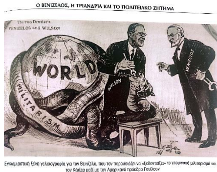
Εικόνα 7: Φωτογραφία από το αρχείο του Μουσείου Μπενάκη, «Ελευθέριος Βενιζέλος. Η Μεγάλη πορεία. Από το Ανάθεμα στην αποθέωση», Παύλος Πετρίδης «Ο Βενιζέλος η Τριανδρία και το Πολιτειακό Ζήτημα», σελ.87, Ε-ΙΣΤΟΡΙΚΑ, εκδ. ΕΛΕΥΘΕΡΟΤΥΠΙΑ

πληροφοριών και της προπαγάνδας. Με αρχηγείο το ξενοδοχείο «Μεγάλη Βρετανία» και πολλά γερμανικά μάρκα, ο διαβόητος βαρόνος Σενγκ, έρχεται στην Αθήνα ως υπάλληλος της Krupp. Είναι όμως ο κύριος συντονιστής των μυστικών υπηρεσιών της Γερμανίας. Με ένα τεράστιο δίκτυο κατασκόπων εξαγοράζει εκδότες και δημοσιογράφους και εφημερίδες. Η αγγλο-ελληνική Ένωση κάνει λόγο για 3000 Γερμανούς πράκτορες στην Αθήνα 50 .