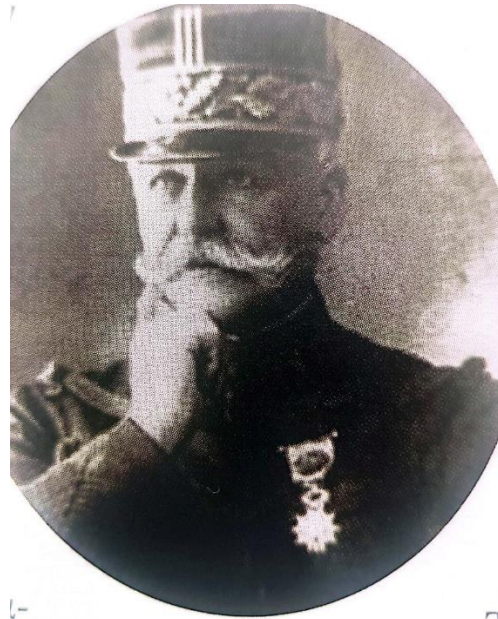
Ο Γάλλος στρατηγός Μορίς Σαράιγ