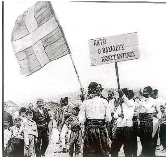
Εικόνα 8: Φωτογραφία από το αρχείο του Μουσείου Μπενάκη: «ΚΑΤΩ Ο ΒΑΣΙΛΙΑΣ ΚΩΝΣΤΑΝΤΙΝΟΣ» Θεσσαλονίκη 6 Μαΐου 1917. Οι φιλοβενιζελικοί διαδηλώνουν εναντίον του Κωνσταντίνου. Στις 30 Μαΐου εξαναγκάζεται σε παραίτηση από κατόπιν πιέσεων που δέχθηκε από τους συμμάχους. Στη συνέχεια έγινε κατάληψη του Ισθμού της Κορίνθου και απόβαση Αγγμάτων στο λιμάνι του Πειραιά.