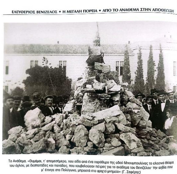
Εικόνα 9: ΤΟ ΑΝΑΘΕΜΑ. Φωτογραφία από το αρχείο του Μουσείου Μπενάκη, «Ελευθέριος Βενιζέλος. Η Μεγάλη πορεία. Από το Ανάθεμα στην αποθέωση», σελ. 98, Σύρου Μαρκάτου, «Τα Νοεμβριανά», Ε-ΙΣΤΟΡΙΚΑ, εκδ. ΕΛΕΥΘΕΡΟΤΥΠΙΑ

Στις 12 Δεκεμβρίου 1916, οι φιλοβασιλικοί στην Αθήνα οργάνωσαν τελετουργία «Αναθέματος» κατά του Βενιζέλου στο Πεδίον του Άρεως, κατόπιν αποφάσεως της Ιεράς Συνόδου της Ελλάδος. «Κατά του Ελευθερίου Βενιζέλου, φυλακίσαντος αρχιερείς και επιβουλευθέντος την Βασιλείαν και την Πατρίδα, ανάθεμα έστω!».