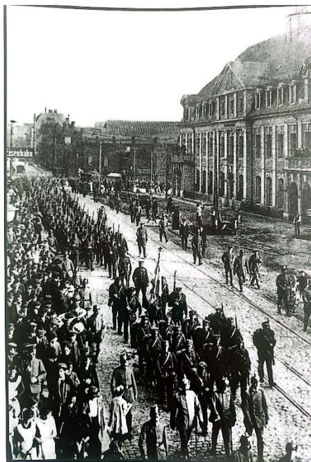
Εικόνα 4: Δ΄ ΣΩΜΑ ΣΤΡΑΤΟΥ αιχμάλωτο στο Γκέρλιτς Γερμανία

Ο Ζαΐμης παραιτείται στις 11 Σεπτεμβρίου, μη μπορώντας να διαχειριστεί τα γεγονότα που τρέχουν, αναλαμβάνει ο γηραιός πλέον Στέφανος Σκουλούδης. Έχει προηγηθεί η εισβολή των Γάλλων στην Κέρκυρα στις 26 Ιανουαρίου 1916, ακολουθεί η ατιμωτική για τη χώρα παράδοση αμαχητί του οχυρού Ρούπελ στις 26 Μαΐου (προσυμφωνημένη από τον Σκουλούδη) 40 και της Καβάλας στις 30 Αυγούστου στους Γερμανο-Βουλγάρους ως αντίβαρο για την κατάληψη της Θεσσαλονίκης από τις δυνάμεις της Αντάντ το Φθινόπωρο του 1916. Αποκορύφωμα, το δράμα της παράδοσης του Δ΄ Σώματος Στρατού στους Γερμανούς και η μεταφορά 7000 αξιωματικών και στρατιωτών ως αιχμάλωτοι σε στρατόπεδο συγκέντρωσης στο Γκέρλιτς της Γερμανίας. Όλα αυτά αποτέλεσαν γεγονότα αναξιοπρεπή για τη χώρα και το λαό της, που πάλεψε στους Βαλκανικούς πολέμους για να τα αποκτήσει.