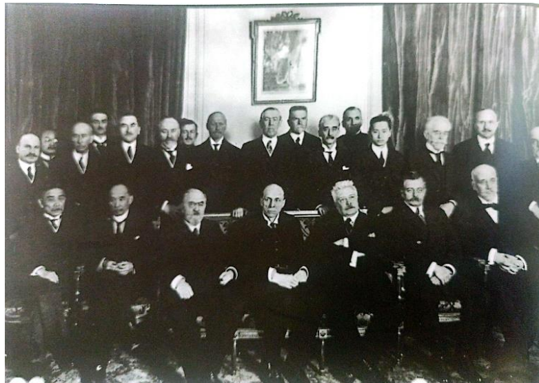
Εικόνα 14: Παρίσι 1919. Συνέδριο για την Ειρήνη, 5/18 Ιανουαρίου. Μετά τη λήξη του Α'Π.Π., συνέρχονται στο Παρίσι οι εκπρόσωποι των συμμετεχουσών χωρών για να καθορίσουν τις διεκδικήσεις τους. Ο Βενιζέλος στην άκρη δεξιά.