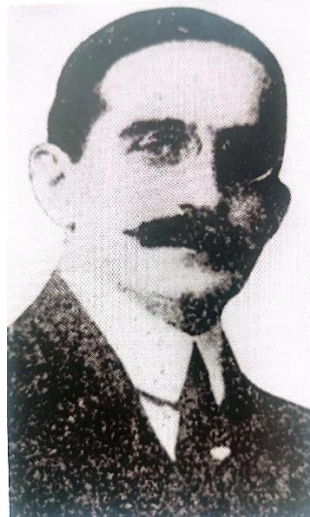
Εικόνα 15: Νικόλαος Πολίτης

Απέκτησε πολύτιμες γνώσεις σε νομικά, πολιτικά και οικονομικά θέματα κατά την φοίτησή του στο Παρίσι, διαθέτοντας διπλή υπηκοότητα, Γαλλίας και Ελλάδας. Ξεχώρισε σε έναν διαγωνισμό για τη διδασκαλία του Δημοσίου Δικαίου στα γαλλικά πανεπιστήμια και ανέλαβε τη διδασκαλία του Διεθνούς Δικαίου στο Πανεπιστήμιο της Αιξ μόλις στα 26 του χρόνια. Αναδείχθηκε σε μία από τις πιο έγκυρες επιστημονικές προσωπικότητες του απόδημου Ελληνισμού. Κέρδισε τον σεβασμό και την εκτίμηση του πρωθυπουργού Ελευθερίου Βενιζέλου, με τον οποίο συνεργάστηκε στενά. Συμμετείχε σε διεθνείς διασκέψεις στο Λονδίνο και το Βουκουρέστι κατά την περίοδο 1912-13, ενώ το 1914 επέστρεψε στην Ελλάδα και ανέλαβε τη θέση του διευθυντή στο Υπουργείο Εξωτερικών.