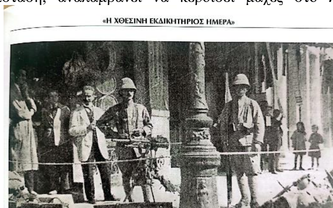
Εικόνα 6: «Ελευθέριος Βενιζέλος. Η Μεγάλη Πορεία. Από το Ανάθημα στην αποθέωση», Δέσποινα Παπαδημητρίου , «Η χθεσινή εκδίκητηρος ημέρα», σελ. 131, Ε-ΙΣΤΟΡΙΚΑ, εκδ. ΕΛΕΥΘΕΡΟΤΥΠΙΑ

Γερμανόφιλες και Ανταντικές χαρακτηρίζονται πλέον οι εφημερίδες. Στην αρχή του πολέμου, από τις 14 Αθηναϊκές εφημερίδες , μόνο 2 ήταν φιλικές με τη Γερμανία. Οι 12 έγραφαν υπέρ του Βενιζέλου και στήριζαν την Αντάντ, μας πληροφορεί ο Βρετανός ανταποκριτής στην Αθήνα Crawford Price. Ο Γερμανός πρέσβης Κουάτ, πολύ ενοχλημένος από την κατάσταση, αναλαμβάνει να κερδίσει μάχες στο πεδίο των ειδήσεων, των