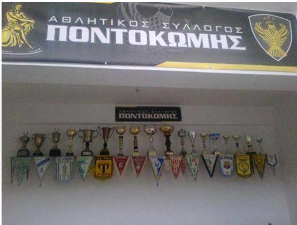
Εικόνα 5: Αθλητικός Σύλλογος Ποντοκώμης 6