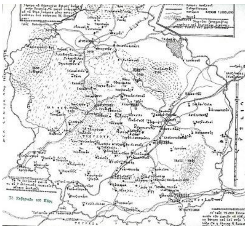
Εικόνα 6: Χάρτης του Κυβερνείου του Καρς 7

Τα έτη 1878-1881 οι εγκαταστάσεις στο «Κυβερνείο» (Kubernija) του Καρς αυξάνονται σημαντικά και έτσι πλέον δημιουργούνται 77 χωριά με ελληνικό πληθυσμό και αξιόλογη οικονομική και κοινωνική ανάπτυξη, δείγμα αυτού ήταν ότι κάθε χωριό διατηρούσε μια εκκλησία και ένα σχολείο. (Καλεντερίδης, 2006)