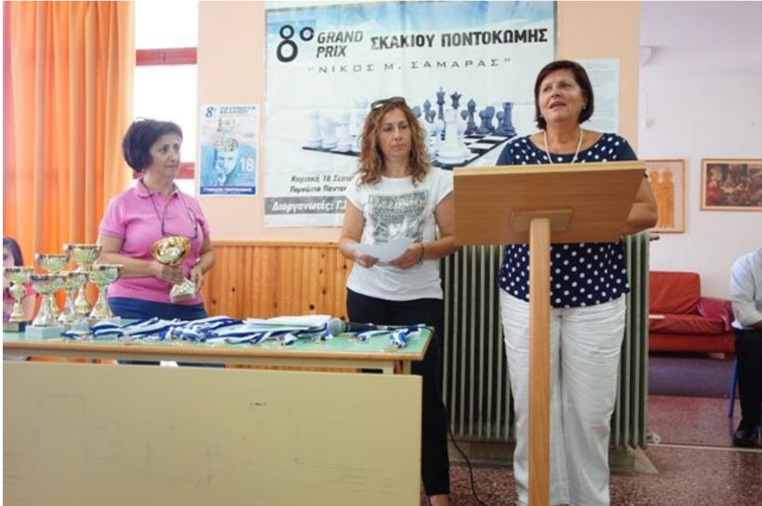
Εικόνα 4: Στιγμιότυπο από το 8 ο Ανοιχτό Τουρνουά Σκάκι «Νίκος Σαμαράς» - Σεπτέμβριος 2016 5

χωρισμένοι σε δύο γκρουπ. Στο Α' γκρουπ οι αθλητές ήταν άνω των 14 ετών, ενώ στο Β' γκρουπ συμμετείχαν οι μικρότεροι ηλικιακά αθλητές.