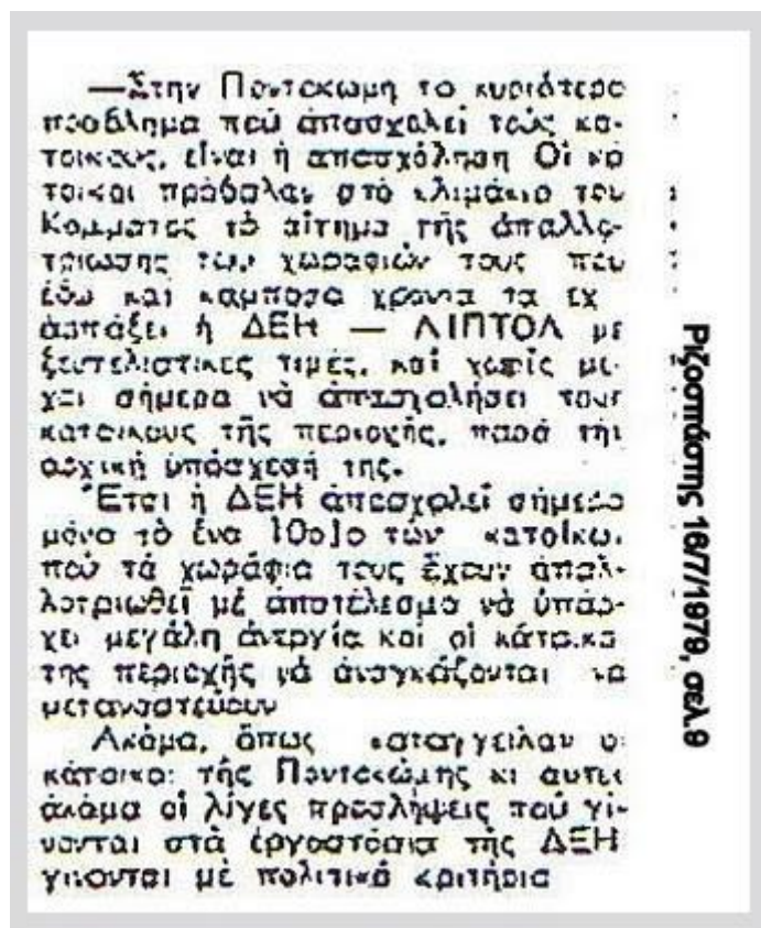
Εικόνα 12: Ποντοκώμη, ΔΕΗ και ανεργία 22