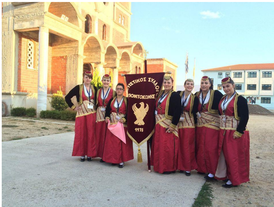
Εικόνα 3: Απόσπασμα από την συμμετοχή του Πολιτιστικού Συλλόγου Ποντοκόμης στο 12 ο Διεθνές Φεστιβάλ Ποντιακών χορών στη Ξάνθη, Οκτώβριος 2016-(2) 4