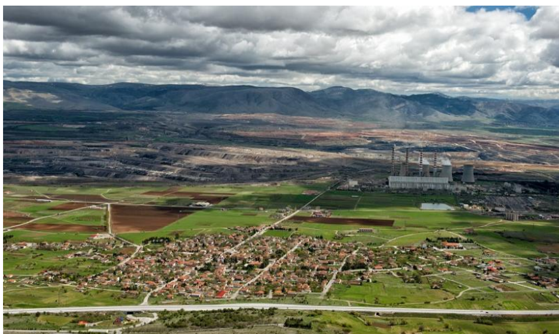
Εικόνα 1: Σημερινή άποψη της Ποντοκόμης 1

Μέχρι το 2010 οι οικισμός Ποντοκόμης υπαγόταν στον Δήμο Δημητρίου Υψηλάντη μαζί με τους οικισμούς Μαυροδενδρίου, Λιβερών και Σιδερών, ενώ με από 01/01/2011 με την εφαρμογή του προγράμματος Καλλικράτης ανήκει πλέον στο νέο Δήμο Κοζάνης. Ο οικισμός της Ποντοκόμης επέδειξε πλούσια δράση κατά τη σύντομη σχετικά ιστορία του, καθώς αποτέλεσε σημείο αναφοράς η συμμετοχή των κατοίκων της στον αντιστασιακό αγώνα, τόσο κατά τη διάρκεια του Β' Παγκοσμίου πολέμου, όσο και κατά τη διάρκεια του αντιδικτατορικού αγώνα.