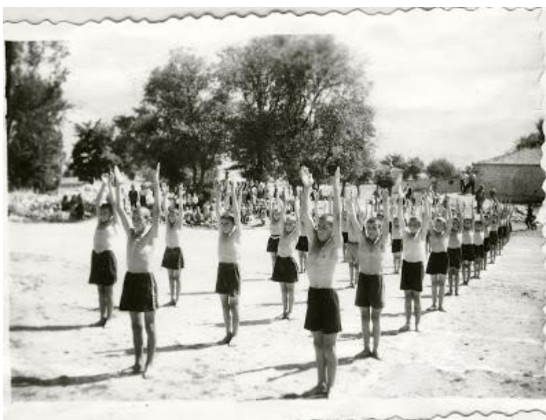
Εικόνα 14: Γυμναστικές επιδείξεις – Δημοτικό Σχολείο Ποντοκόμης 1951 27

Σημαντική ήταν η ακίνητη περιουσία που διέθετε το σχολείο Ποντοκόμης καθώς έφτανε τα 45 στρέμματα και βρισκόταν στην κτηματική περιοχή του χωριού σε οκτώ κατηγορίες κληρομεριδίων. Κατά το σχολικό έτος 1953-1954 το σχολείο λειτούργησε αρχικά ως τριτάξιο και στη συνέχεια ως τετραθέσιο. (Δημοτικό Σχολείο Ποντοκόμης Κοζάνης, 2009)