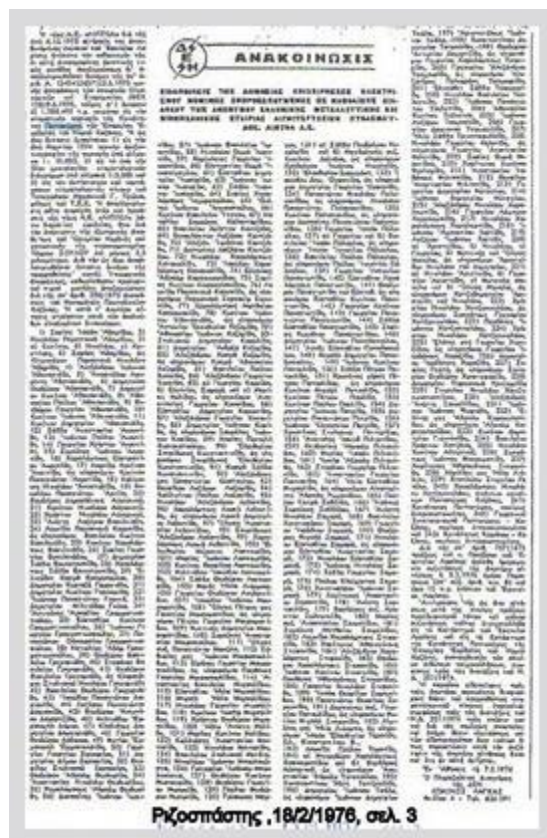
Εικόνα 11: Απόσπασμα από την εφημερίδα « Ριζοσπάστης» σχετικά με την απαλλοτρίωση έκτασης από τη ΔΕΗ 21